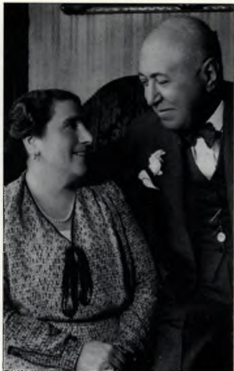
Wigner Jenő szülei (1920 táján)