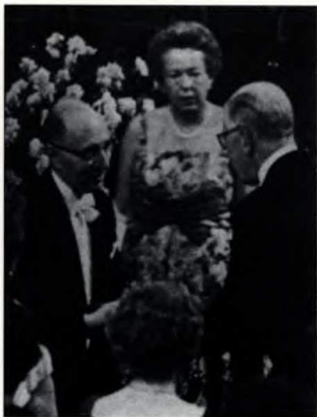
A Nobel-díj átvétele a svéd királytól (1963)