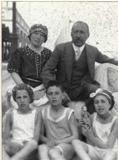
Szüleivel és testvéreivel nyaral (1910 táján)