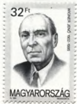
Akadémiánk Wigner-érme és a Magyar Posta emlékbélyege