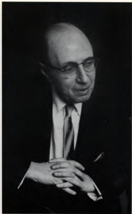
Wigner Jenő 1952-ben