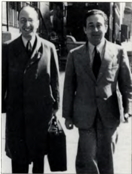
Wigner és Szilárd, az Atom a Békéért díj kitüntetettjei