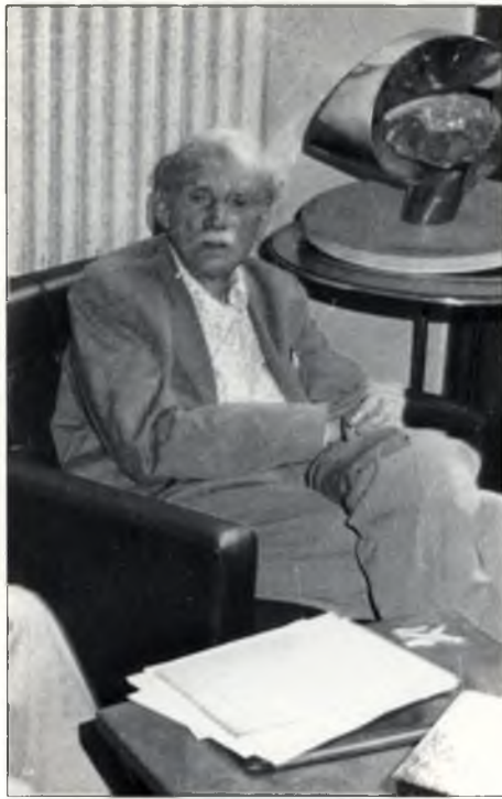
Wigner sógora, Paul Dirac Budapesten (1977)