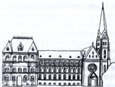
A Fasori Evangélikus Gimnázium

fedezek fel bennük” – írta Wigner Jenő Az atommag szerkezete című könyve magyar kiadásának előszavában.