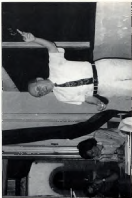
Előadás az Eötvös Egyetem Atomfizika Tanszékén (1976)