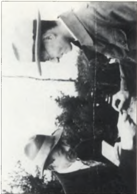
Werner Heisenberg és Wigner Jenő (1930)