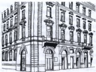
Wigner Jenő szülőháza: Budapest, VII. Király utca 76.

élt. Jenő rövidlátó volt, ezért kisgyerekek korától szemüveget hordott, ami játékban-sportban némileg hátráltatta. Nem volt erős testalkatú. Mint édesapja mondta a vendégeknek: „Ne bántsátok Jenő fejét, hiszen az a leggyengébb része!” Édesanyja – akit a családban Elzának hívtak – esténként e szavakkal köszönt el: „Öllemek, csókollak” – és meg is tette. Édesapja – akit felesége Tóninak hívott – vett egy nyaralót a Duna mellett Budapesttől