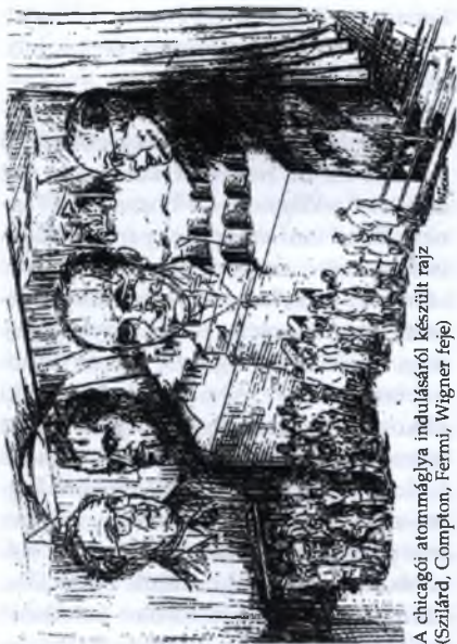
A chicagói atommáglya indulásáról készült rajz (Szárd, Compton, Fermi, Wigner feje)

A grafittéglákból és urántömbökből összerakott 2\text{ m} \times 2\text{ m} \times 4\text{ m} méretű atommáglya a Chicagói Egyetem sportstadionjának lelátója alatt épült. A máglya aljára egy mesterséges Ra+Be neutronforrást helyeztek, azután – amint a máglya magasodott – Fermi instrukciói szerint mérték a neutronok számát. Fermi 25 különböző urán-grafit-elrendezést próbált ki, a rajtuk elvégzett mérések alapján Wigner kezdetetett arra, hogy milyen lesz az a reaktor, amelyben a láncreakció már önmagát tartja fenn. Az első önfenn-tartó nukleáris láncreakció 1942. december 2-án valósult meg Chicagóban. Hallgassuk Wigner visszaemlékezését.