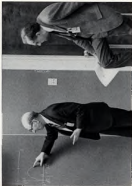
Wigner Jenő és Teller Ede a Livermore laboratóriumban (1970 táján)