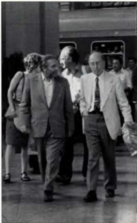
Wigner Jenő megérkezik Budapestre 1976 augusztusában