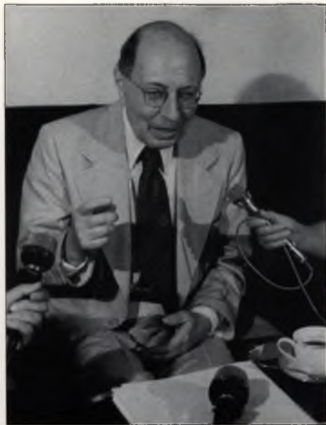
Sajtókonferencia Budapesten (1976)