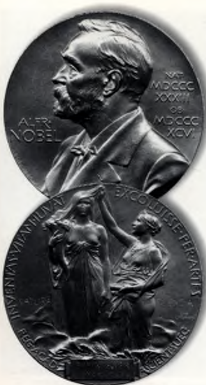
Wigner Jenő Nobel-érme