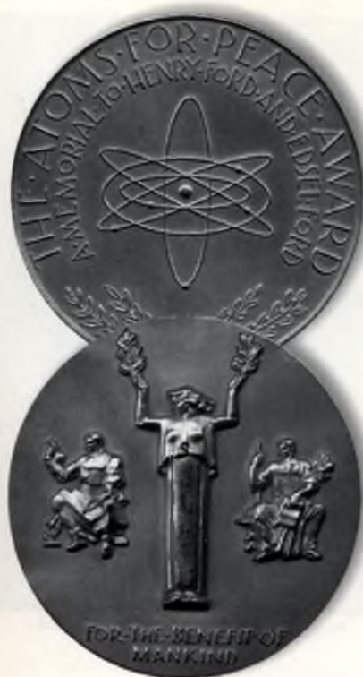
Atom a Békéért Díj (1960)