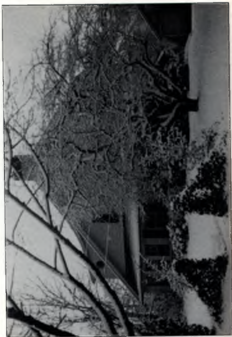
Wigner háza Princetonban, Ober Road 8