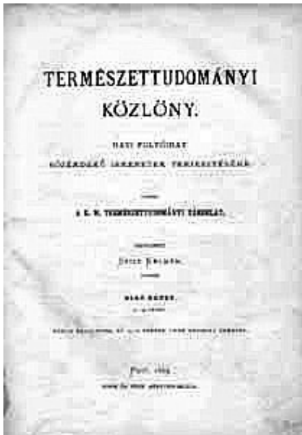
2. ábra Természettudományi Közlöny 1869. első száma

Tehát egyszerre két szinten indult el a Társulat munkája. Egyik maga a társulati tevékenység, amely magába foglalta a társasági élet szervezését, kiadói tevékenységeket. Megjelentették a Természettudományi Közlönyt bár csak 1869-től (1869–1944) 6 Szily Kálmán szerkesztésében, amely 1944-ig folyamatosan megjelent.