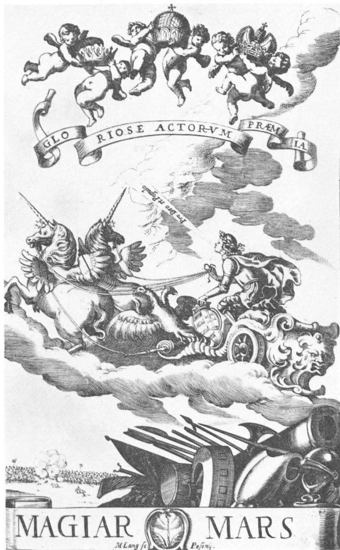
13. Listius László Magyar Mársának címlapja az OSzK példányából