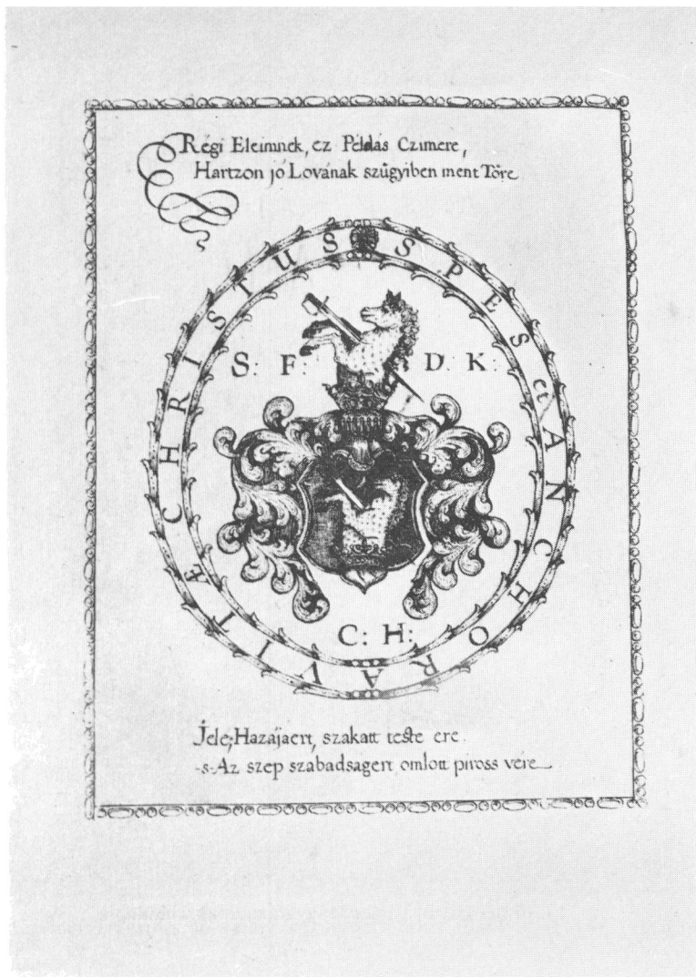
19. Fráter István Verses Magyarázata címlapjának a verzója