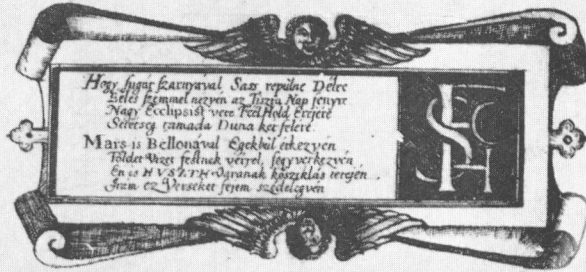
20. Fráter István Verses Magyarázatának befejező versei (152. és 153. sz.)

Vedd mint illik tülem s élyhasznodra vele. Ne fujjon ram erre merges nyelvéd szele. Zoilulsal se szólly rágalmat felöte. Fedezze hibait szereted jele.