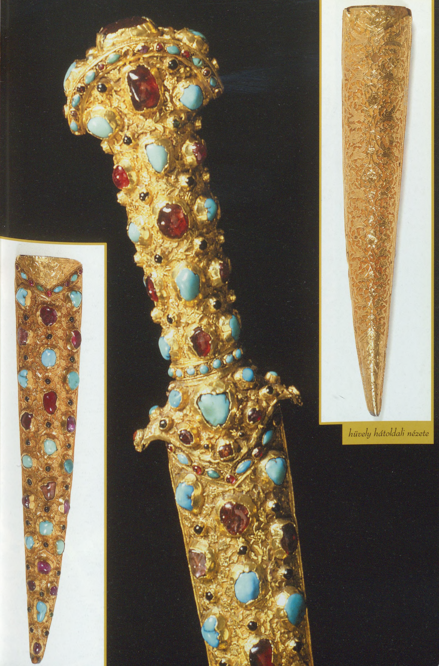
hüvely hátoldali nézete