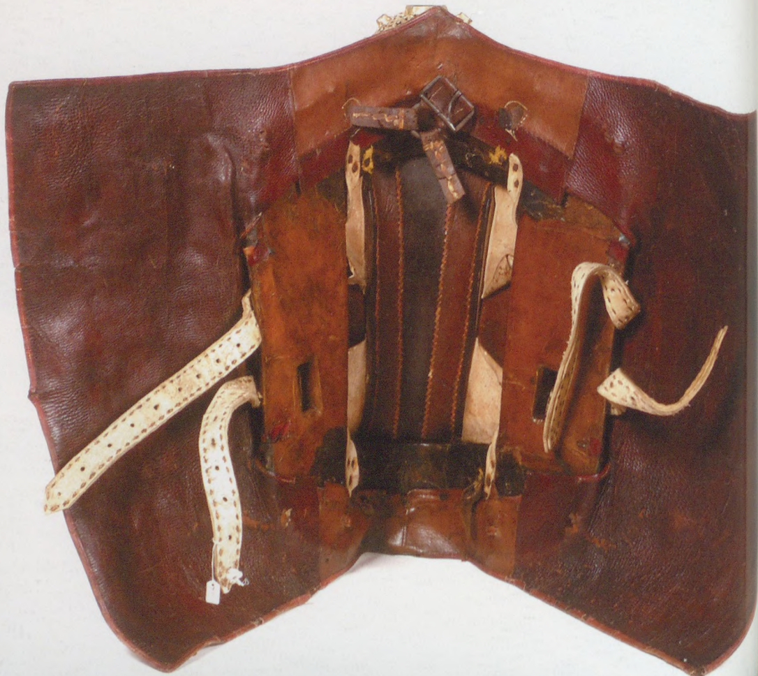
nyereg kiterített nézete