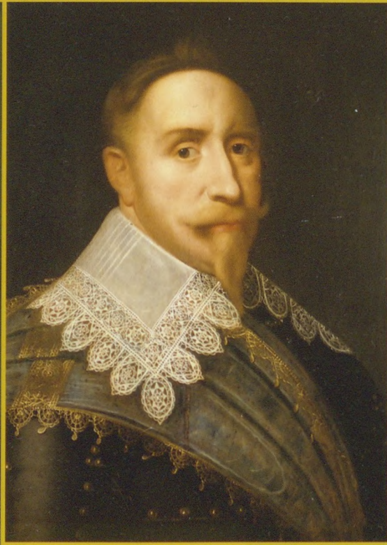
Gusztáv Adolf portréja