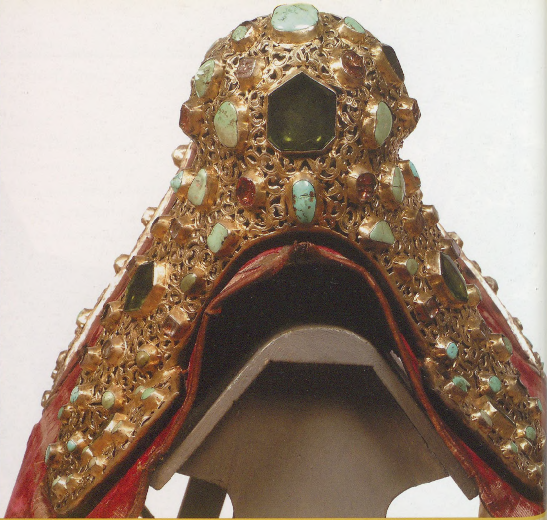
nyereg elülső nézete