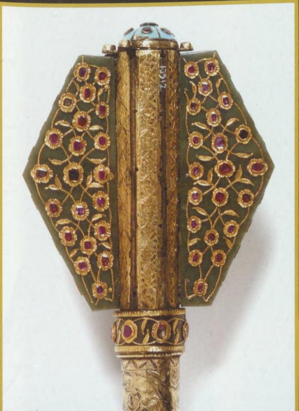
tollasbuzogány fej, inkrusztált és rubinfoglatatú nefritlapokkal