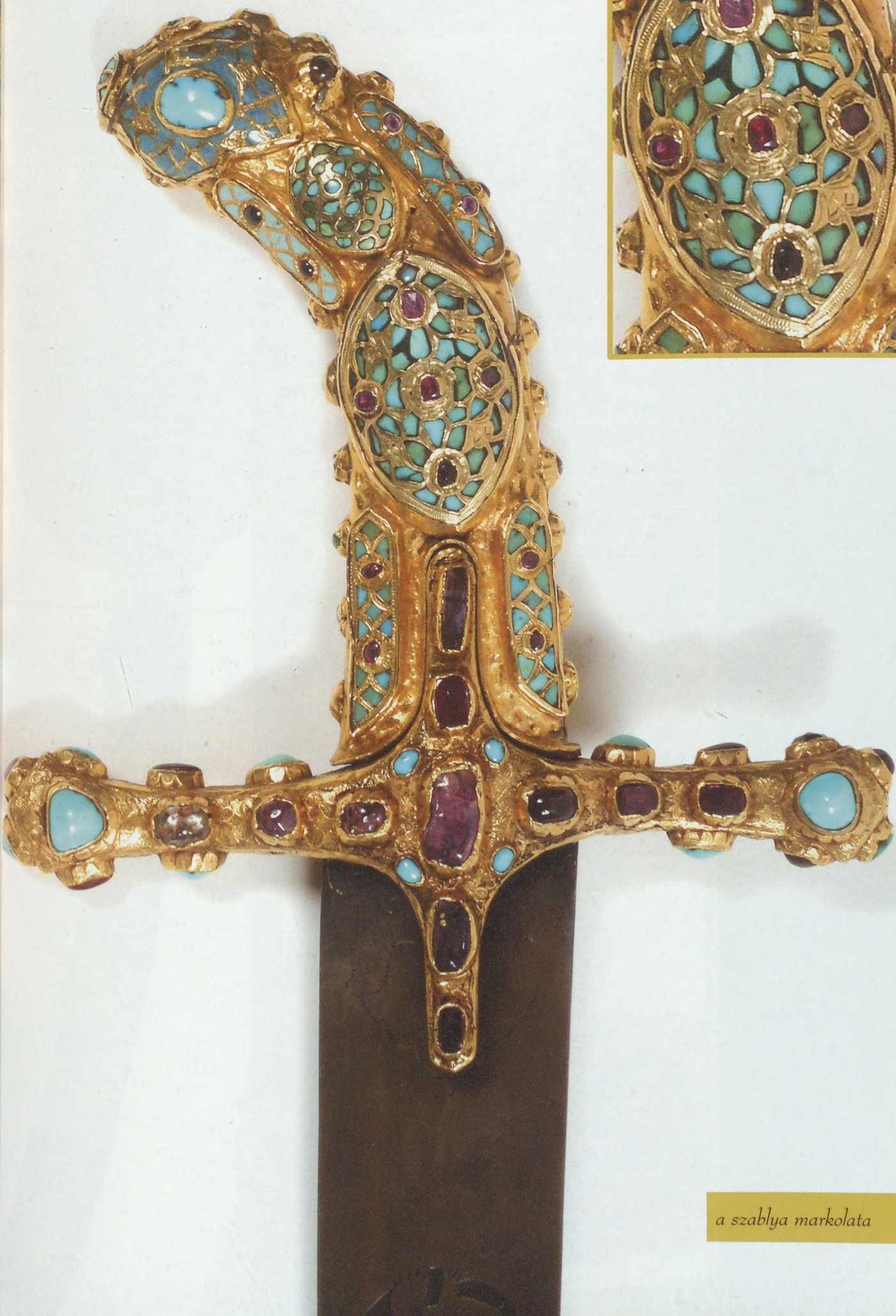
a szablya markolata