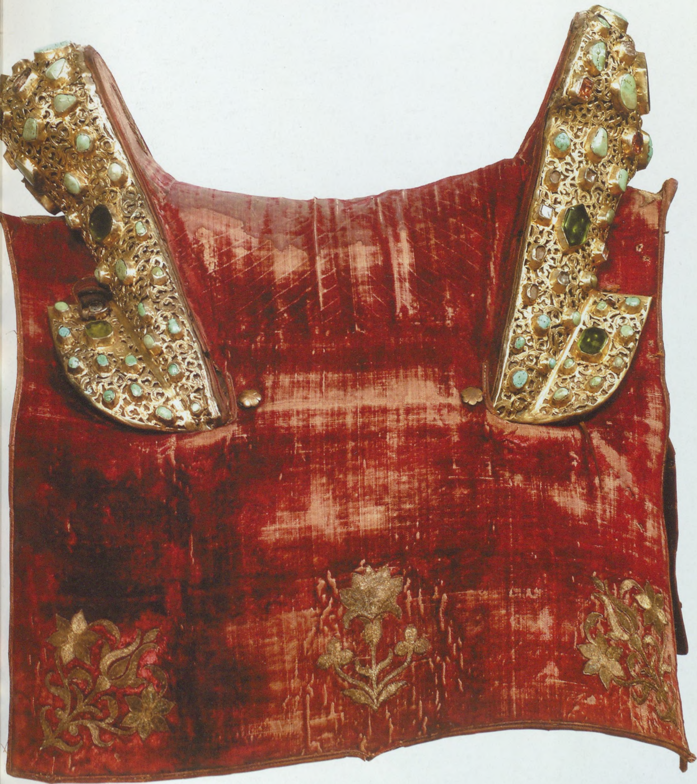
nyereg oldalsó nézete