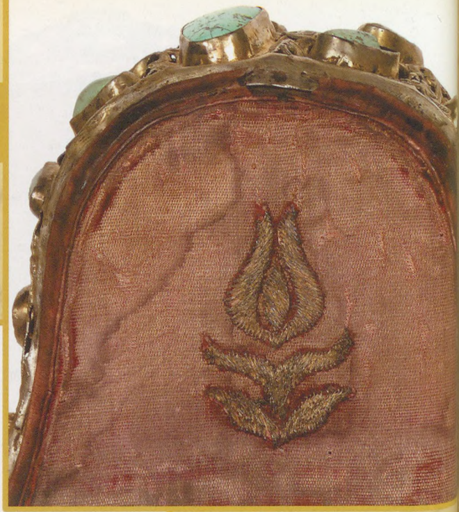
hátulsó nyeregkápa üléspárnázat díszítése