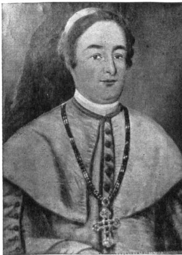
Gr. Zichy Domonkos veszprémi püspök korában

fordult. A szeretet magaslatán az embert nézte és mellétekintet nélkül megsegítette őket. Természetes, hogy jótettének áldásait elsősorban azok a szegények érezték, akik azokhoz a közelség miatt leginkább hozzájuthattak. Sehol feljegyzés, vagy emlékezet arról nincs, hogy nem látott volna mindenkít egyforma szeretettel. A kegyes főpap, egyben magyar főúr, nemes osztó mozdulata ez, az Üdvözítő utánpótlása, amikor ez a csodás kenyérszaporításkor oszt tíznek, száznak, ezernek, ötezernek.