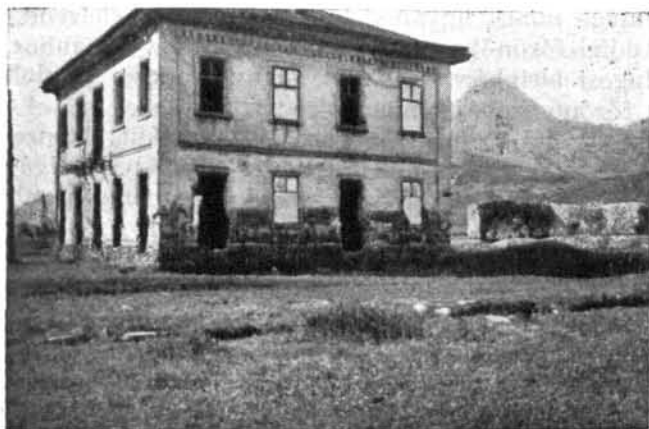
Zichy háza Majorban

Talajjavítás céljából megvételre jó trágyát kerestetett. Az ő rétje — mondotta — nagyon rossz és nem akarná, hogy az előző évi szénahiány megismétlődjék. Ezen csak trágyával lehet segíteni, mivel így a föld melegebb lesz, előbb hoz zsenge vetést. E műveletnek az őszi eső beállta előtt kell megtörténnie, mivel az a zsenge vetés egy részét évenként megrontja. Semmi úgy ki nem fizeti magát, — állította, — mint e rossz földeken való trágyázás. Elégedetten nézte, hogy a hideg az egyik évben jó jeget hozott, mivel így a trágya-kihordás könnyű lesz. A mély-szántásra vonatkozólag is maradt fenn intézkedése. Melegebb idő beálltával — rendelkezett — a burgonya-földet szántásuk fel vaskével, de igazán mélyen.