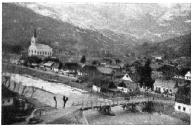
Major község a templommal

Építkezései, templomfelszerelései a püspököt a bőkezű patrónusok színvonalára emelték. Erdély több templommal lett gazdagabb az ő adakozása és műértő fáradozás révén. Az erkölcsi hatáson kívül, amely e templomokból kiárad, művészet, ízlés is sugárzik felénk ez alkotásokból, a magyar mágnás-püspök személyén keresztül érzékelhető szeretet átfogó erejével. A