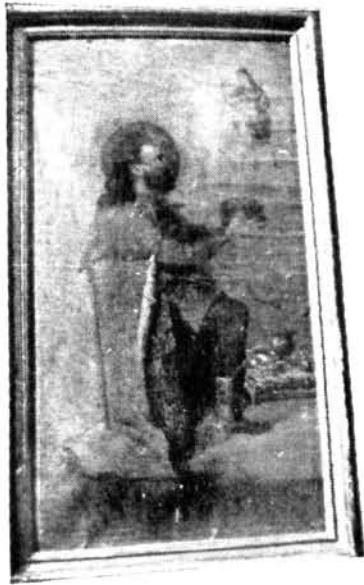
Szent István képe a majori gör. kat. templomban