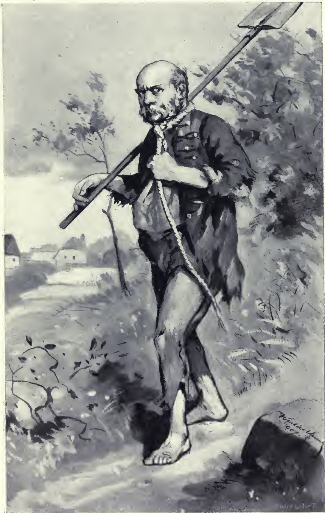
Nyakában a kötél, vállán az ásó . . .