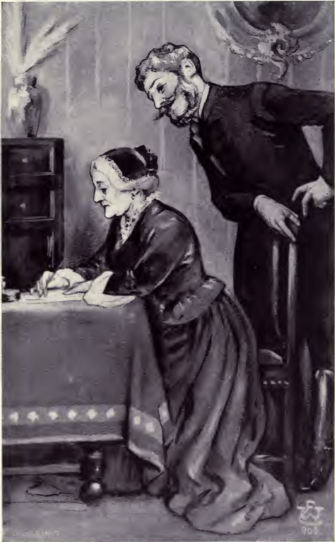
Az öreg asszony fogta a tollat . . .