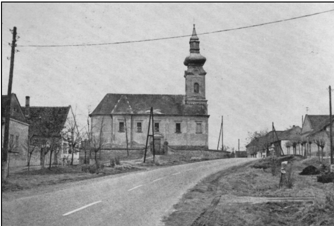
A szerb (görögkeleti) templom