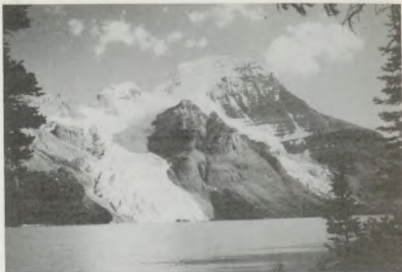
A KANADAI Mt.ROBSON ÉS A BERGLAKE ÉNY-ről (Barcsay Kálmán)