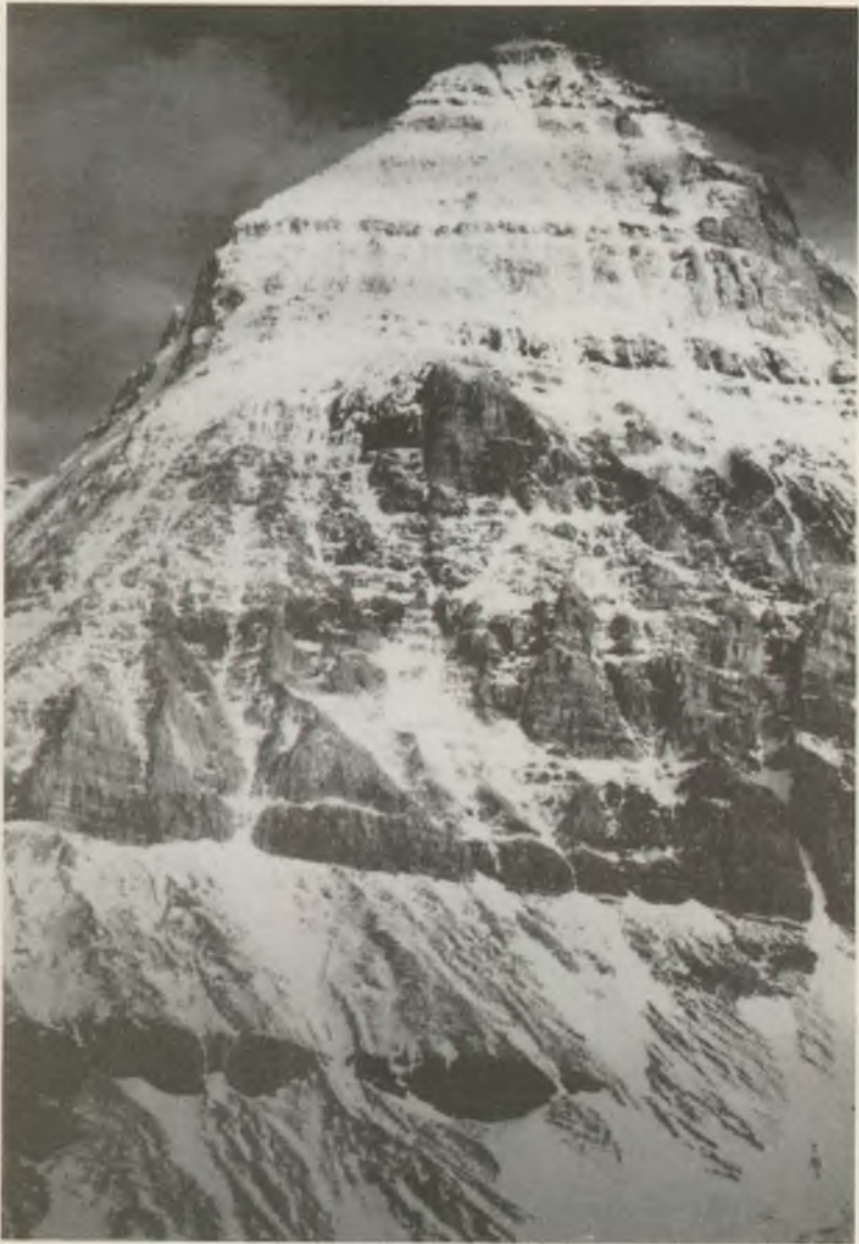
A KANADAI Mt. ASSINIBOINE ÉNY-ről