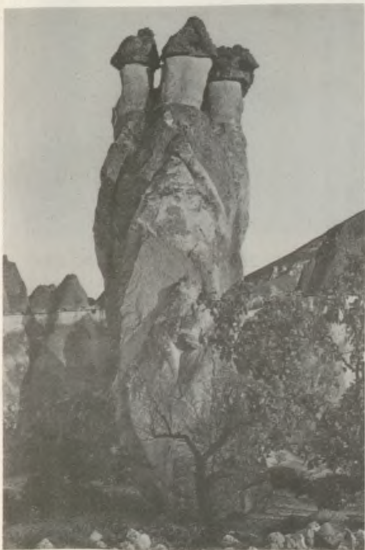
TÜNDÉR KÉMÉNY ANATÓLIÁBAN