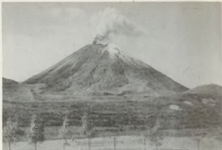
A NGAURUHOE MŰKÖDŐ VULKÁNJA (2289 m) ÚJ-ZÉLONDON