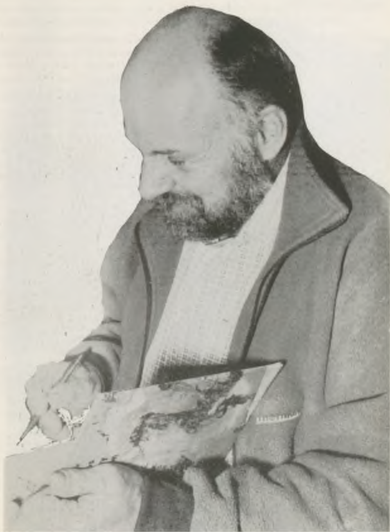
KURT DIEMBERGER BUDAPESTEN A GUTENBERG MŰV. KÖZP-ban