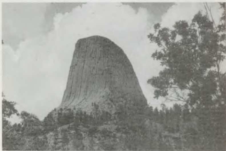
AZ USA-ban A DEVIL'S TOWER