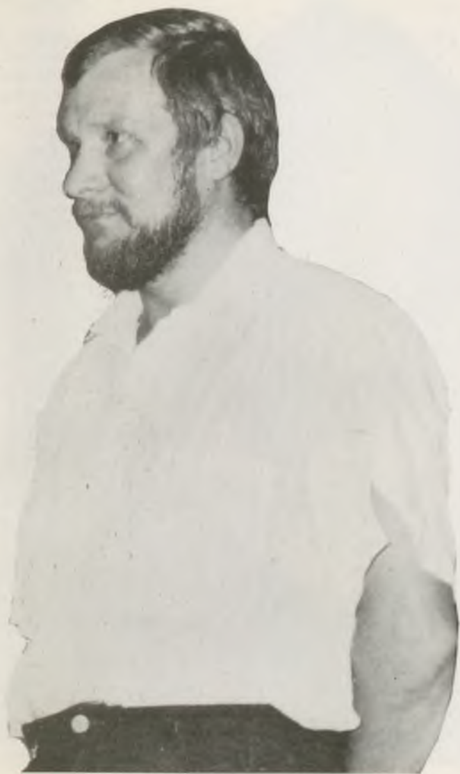
JERZY KUKUCZKA BUDAPESTEN AZ URÁNIÁBAN