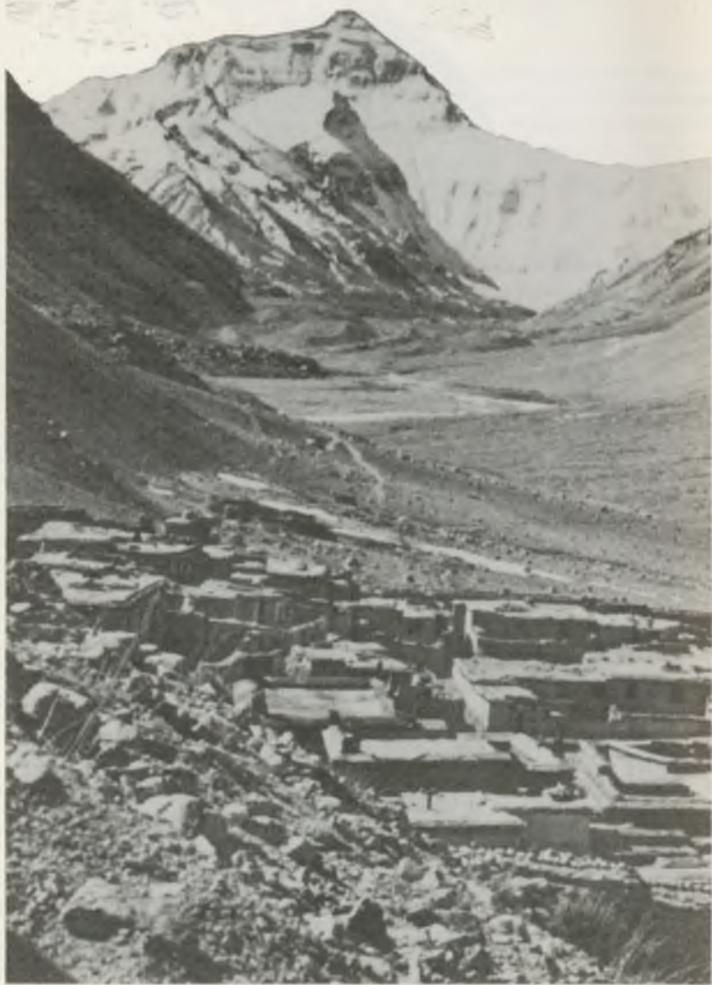
Mt. EVEREST A TIBETI OLDALRÓL A RONGBUK KOLOSTORRAL (5000 m)