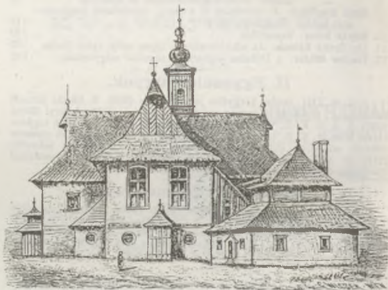
Késmárk. — Evangelikus fatemplom.