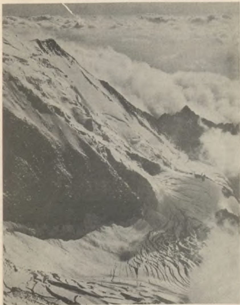
AIGUILLE de BIONASSAY ÉK-i fala