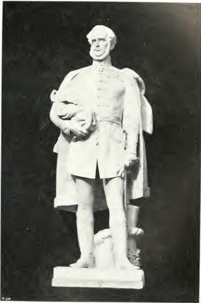
Statue of JAYAN with sash and sash Museum, Kuala Lumpur.