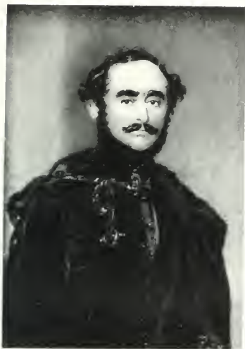
SZECHENYI ISTVÁN GRÓF