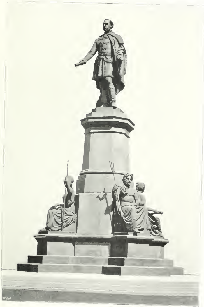
SZECHENYI budapesti szobra.