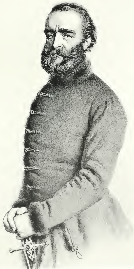
SZECHENYI ISTVÁN GYÖF. ARZKEPE (DÖBLING).