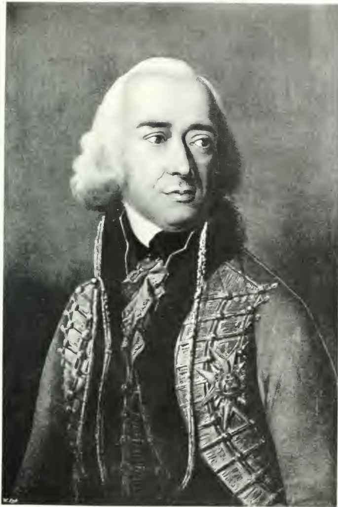
SZECHENYI FERENCZ GYÓF.