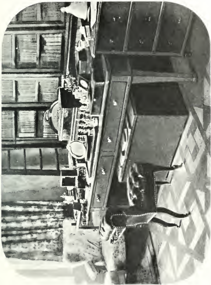
Szakmestri dolgozószobája (Dobling).