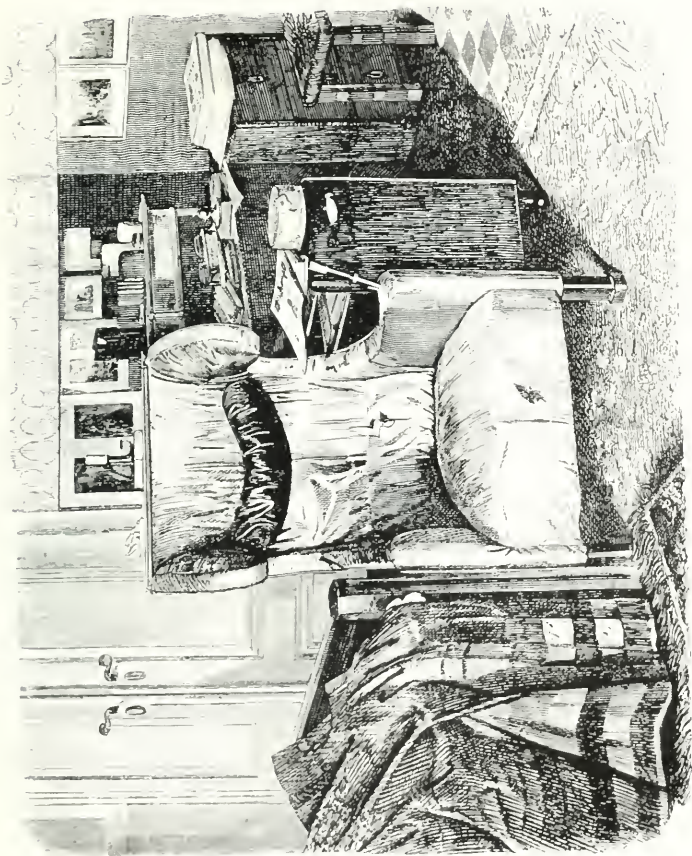
SZÉCHÉNYI karosszéke, melyben végzetes tettet elkövette