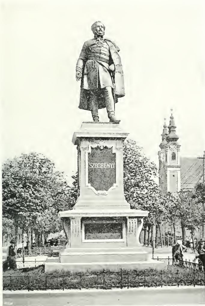
A Széchenyi-szobor Sopronban.