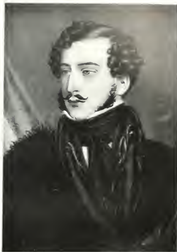
GRÓF KAROLYI GYÖRGY