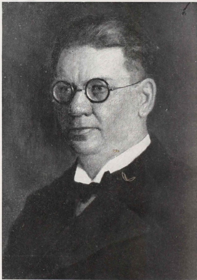
Pándy Lajos olajfestménye után.