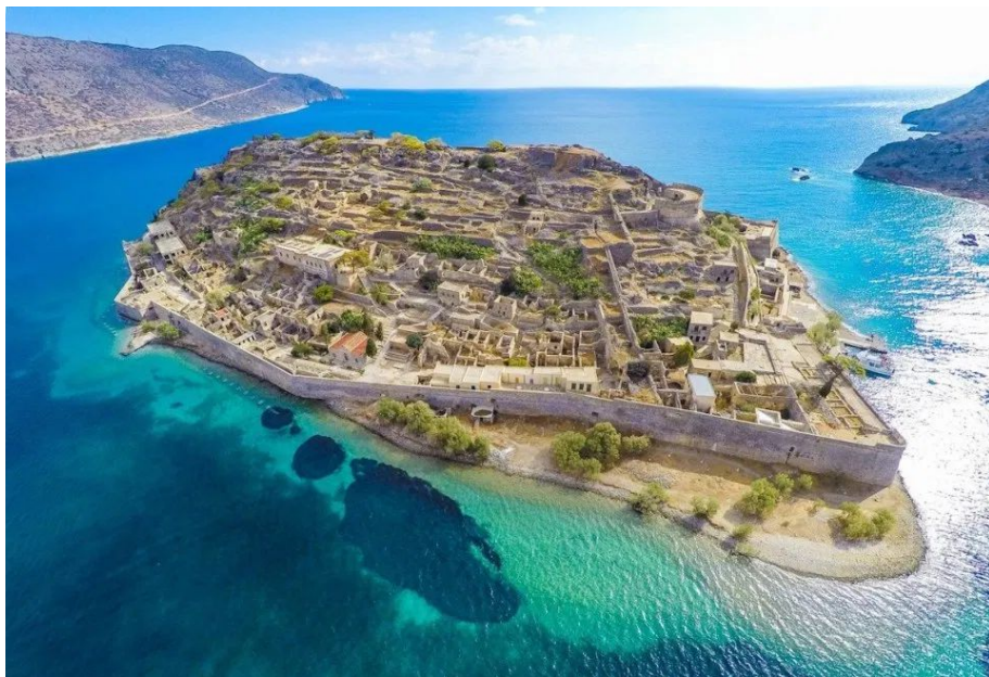
1. kép: Az ókori Spinalonga leprosorium romjai Kréta lakatlan szigetén

A rabszolga érték volt az ókorban; bármennyire lenézték, létéről, egészségéről gondoskodtak. Amíg tudott dolgozni, amíg hasznot hajtottak. Ha már nem, „utcára tették”, elkergették a háztól. Talán őket lehet az első, mai értelemben vett hajléktalanoknak tekinteni.