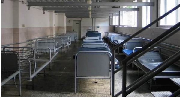
3. kép: Az Oltalom Karitatív Egyesület hajléktalanszállója takarítás után

Ők az úgynevezett regisztrált hajléktalanok, akik valamilyen hajléktalanok számára létrehozott szolgáltatást igénybe vettek. Számuk százezer. Ők azok, akik igénybe tudják, akarják venni a társadalmi szintű gondoskodást.