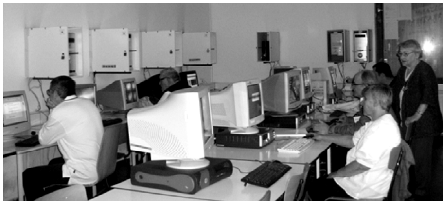
4. kép: Informatika-oktatás a Wesley János Lelkészképző Főiskolán hajléktalanok számára

És persze a háztartástan, a pénzügyi ismeretek. Hogy ne hitelek sokaságából éljenek, egyikkel a másikat fedezve az emberek, mert a bizonyítási kényszer, a fogyasztást forszírozó reklámok erre készítetik. Hogy ne banki kölcsönből vegyenek karácsonyi ajándékot, hanem a saját maga által szeretettel, odafigyeléssel készített ajándék jelezze, hogy ünnep van, és hogy fontos számára a megajándékozott. A Háztartástani ismeretek alapjait pedagógusok évfolyamokra, órákra kidolgozva nyújtották be az oktatás irányítóinak – mégsem került be a nemzeti alaptantervbe.