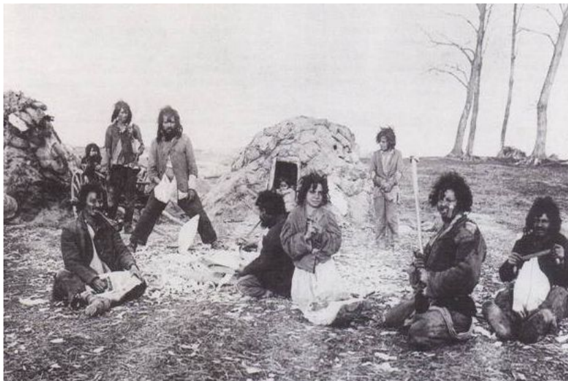
Cigányok a putri előtt (Keszthely, 1905.)

„...Czigányaink nagyobb társaságban laknak az erdők közvetlen közelében, de minden család külön gúnyhóban él; e lakhelyek félig a földbe ástott meglehetősen meleg viskók, melyek teteje favázzra hányt 50–70 cm vastag földréteg, s némelyik oly tiszta és takaros berendezésű, hogy bizony nem egy keleti szomszédnak példaképpül volna felmutatható... Minden kompánia, mely olykor 70–80 családból is áll, tart néhány pár lovat, hogy vásárra vihessék a nagyobb teknőt, vályút stb. Fehér, 1892.108.3 44