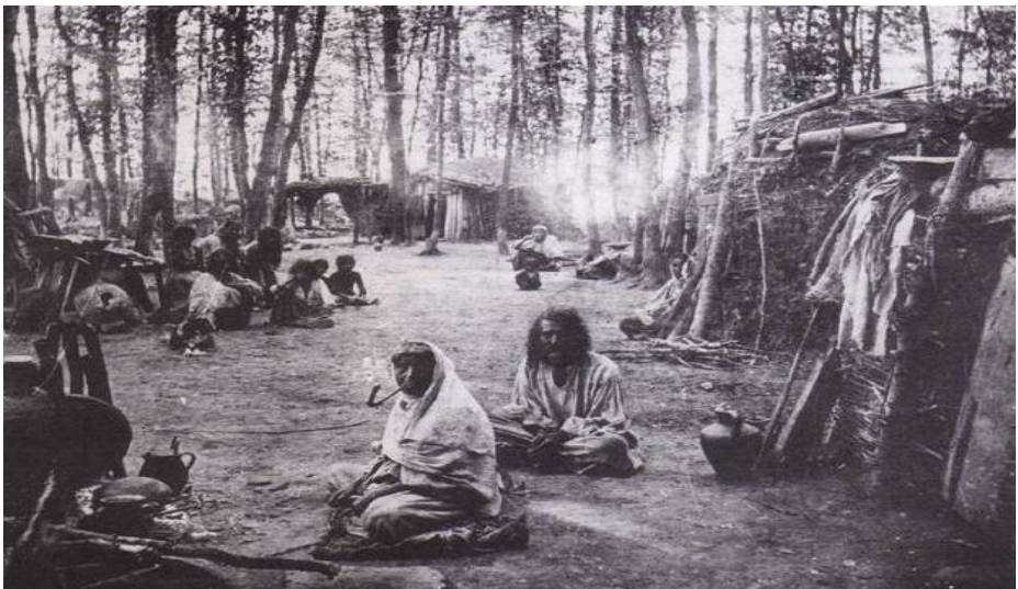
Oláh cigányok a selyei erdőben. Selye, 1894 előtt

A tradicionális roma családok a telepi léthez a mai lakhatási körülményekben hasonló miliőt teremtenek, az egy-térben élés gyakorlatát folytatják, bár legyen a lakás, amiben laknak esetleg 3 szobás is. A másik két szoba raktár.