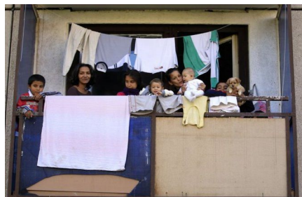
Szigetvár, Móra Ferenc lakótelep 2018. 01. 03. 40

Az 1960- ban készült fotókon a cigánytelepen váltakoznak a földbe vájt putrik a kis lakóház típusú építményekkel, amelyek szintén kis alapterületűnek néznek ki, és valóság közeli lehet a feltételezés, hogy ebben is az egy térben élés kultúrája volt jelen (Kiskunhalas, Pétervására). Magyarország 1960. 45,46