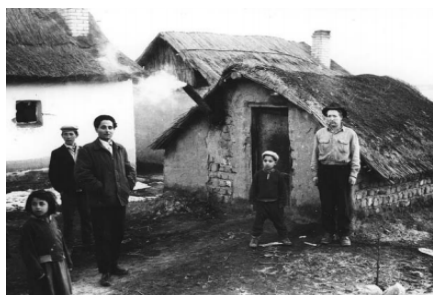
A kiskunlacházi cigánytelep (1960)

„...Czigányaink nagyobb társaságban laknak az erdők közvetlen közelében, de minden család külön gúnyhóban él; e lakhelyek félig a földbe ástott meglehetősen meleg viskók, melyek teteje favázzra hányt 50–70 cm vastag földréteg, s némelyik oly tiszta és takaros berendezésű, hogy bizony nem egy keleti szomszédnak példaképpül volna felmutatható... Minden kompánia, mely olykor 70–80 családból is áll, tart néhány pár lovat, hogy vásárra vihessék a nagyobb teknőt, vályút stb. Fehér, 1892.108.3 44