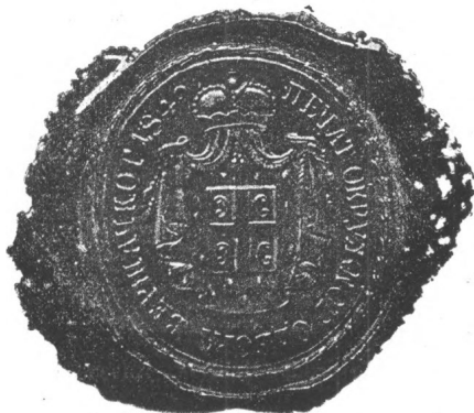
A verseczi „kerületi-odbor“ pecsétje.

Január 23-án Rajacsics patriárka is Verseczre jött. Első tette volt, hogy az őt fogadó Popovics Istvánt, a magyarok iránt tanúsított jó indulata miatt, méltóságától megfosztá és büntetésül a feneki zárdába küldé szerzetesnek; a hol cz, a szenvedett méltatlanság feletti bánatában, néhány holnap múlva meghalt 2) . Rajacsicot még az nap,