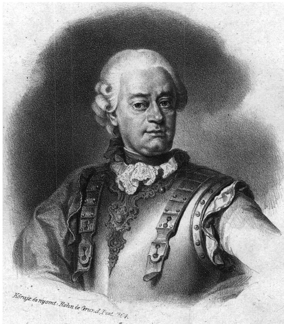
GRÓF MITTROWSZKY JÓ S. MAX. táborszernagy, Szabács-vár egyik hős vivője 1789 ben