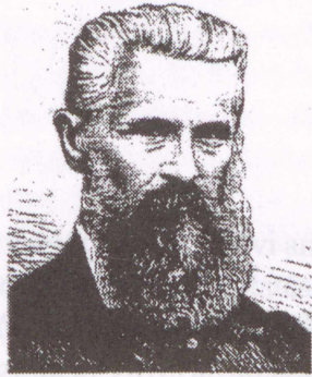
Csányi Dániel 1820–1867