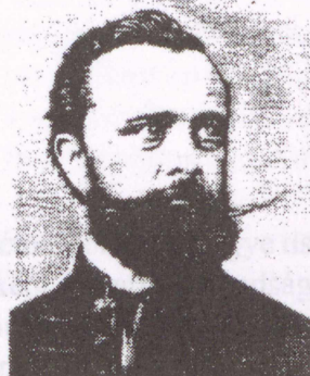
Hollán Ernő 1824–1900