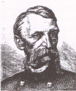
Aszóth Sándor 1811–1868