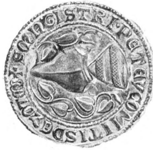
Pető mester szatmármegyei főispán pecsétje 1317-ből.

Eredetije a Magyar Nemzeti Múzeum Széchenyi orsz. könyvtárának kiállításában, XI. sz. szekrény, Nro 227.