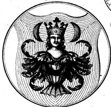
Sigismundus Franciscus 1525.