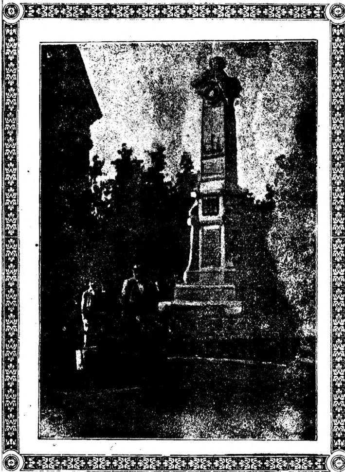
A Pozsonyi Vértörvényszék áldozatainak Emlékoszlopa Debreczenben.