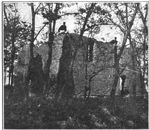
A GUTHI TEMLOM ROMJAI.

Guth. 1289. (Lásd Balkánynál.) A Guthkeled nemzetségbeli Omode Miklós magvaszakadása után 1359-ben rokonai: várkonyi Omode, Lothár, István és Miklós kapták. Papjától 3–4 garas pápai tizedet szedtek. A guthi telken a románkörinak látszó kisded templom falai mind máig dacolnak az időfogával.