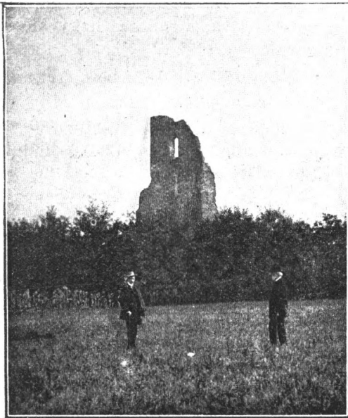
A ZELEMÉRI TEMPLOM ROMJAI.

Zelemér. Kandra szerint a váradi Regestrum Nechemer faluja (1214, 103,329. sz. eset) és Ztemur faluja