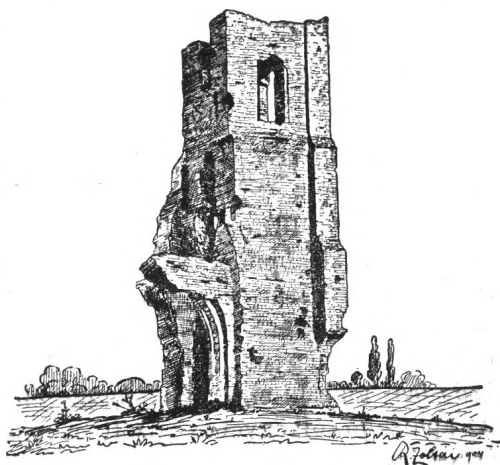
A HERPÁLYI ROM,

Herpály v. Érpály monostora. Egyházát és birtokát a váradi Regestrum emli. — A pápai tizedjegyzékben 1332—37. már csak Herpály falu papja szerepel 13—14 garas tizeddel. A monostor románkori templomának romjai még állanak B.-Ujfalutól északkeletre.