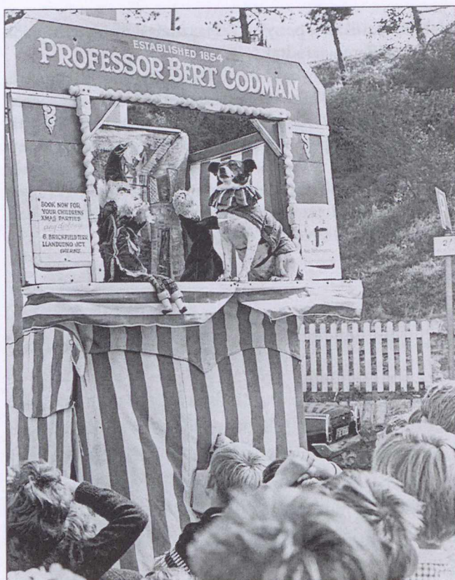
Csíkos mintázatú, „klasszikus” bohózatokhoz, vásári bábjátékokhoz használt, pamutponyvából készült mutatványos sátor. Anglia, 1857-től napjainkig.

A középkori vásárok és piacok elmaradhatatlan látványosságai voltak a vándormimesek és vándorszínészek, a „csepürágók”, akrobaták és artisták, akik városról városra, faluról falura jártak és előadásaikkal szórakoztatták a közönséget és kalapozták össze tiszteletdíjukat az előadások végén. Ekhós szekérrel jártak. Az ekhó egy szekér fölé emelt építmény volt: fa-, később fémvázra erős, nyers, néha színes ponyvát húztak, amely védte az utazókat és a szállítmányt is. Az 1712-ben készült Szepesbéla mintakönyv egyik szabásmintáján gazdagon díszített ekhós szekér építményének rajza látható. Ez tekinthető a 20.