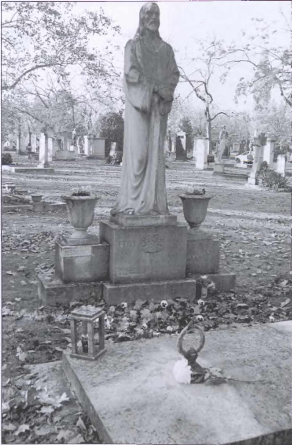
Az Edvi család síremléke a Kerepesi temetőben