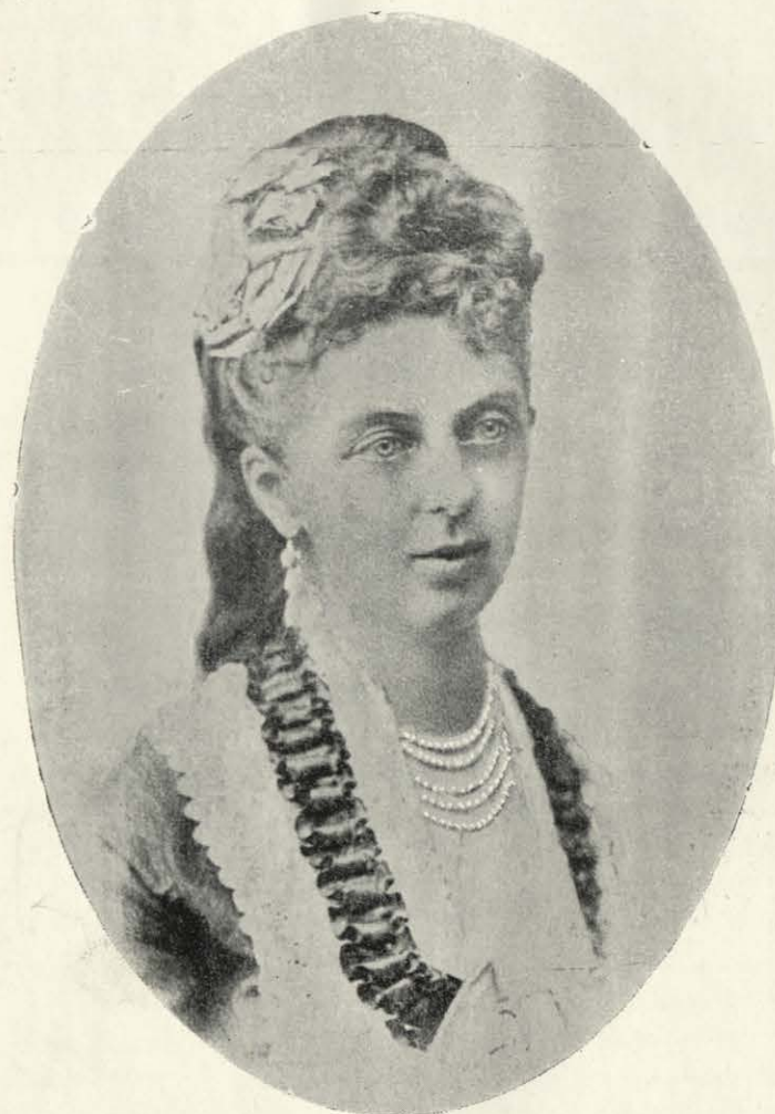
Özv. gr. Batthyány Geizáné szül. Batthyány Emmanuela grófnő, pártfogónője a Magyar Gazdasszonyok Országos Egyesületének az 1888-ik év óta.