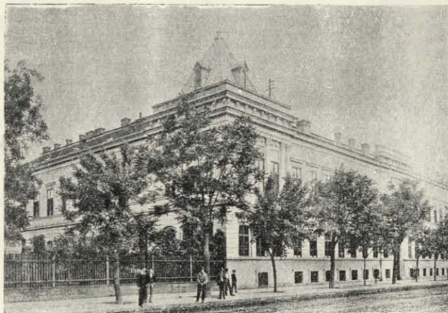
Az egyesület volt Damjanich-utcai árvaházának homloknézete.

Azonban az egylet pártfogónője: özvegy gróf Batthyány Geizáné , ki az egyesület ügyeit ma is szívének teljes melegségével a régi hazafias szellemben vezeti, nem engedte, hogy válságba jusson a Magyar Gazdasszonyok Országos Egyesülete, mely majdnem egy félszázadon keresztül teljesítette már az árvaügy s a közjótékonyosság terén nemes hivatását. Nagy energiával kereste tehát a kibontakozás útját s a nehéz helyzetet oly szerencsés kézzel tudta megoldani, mely csak az ő kiváló