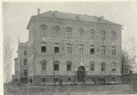
Az egyesület cinkotai árvaházának és nevelő-intézetének homlokzata.