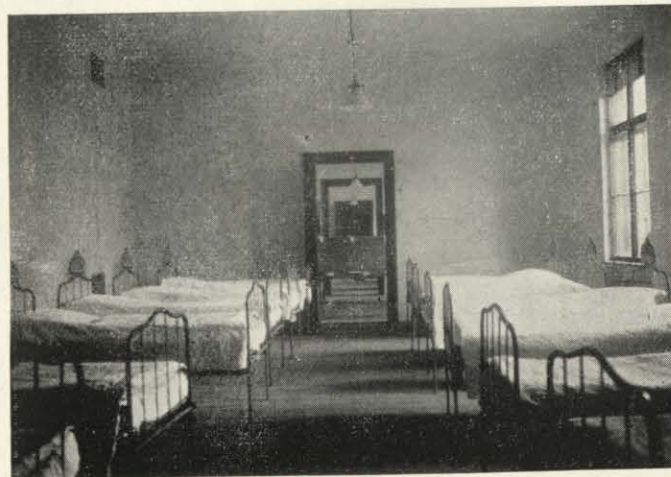
Az egyesület cinkotai árvaházának és nevelő-intézetének egyik hálóterme.