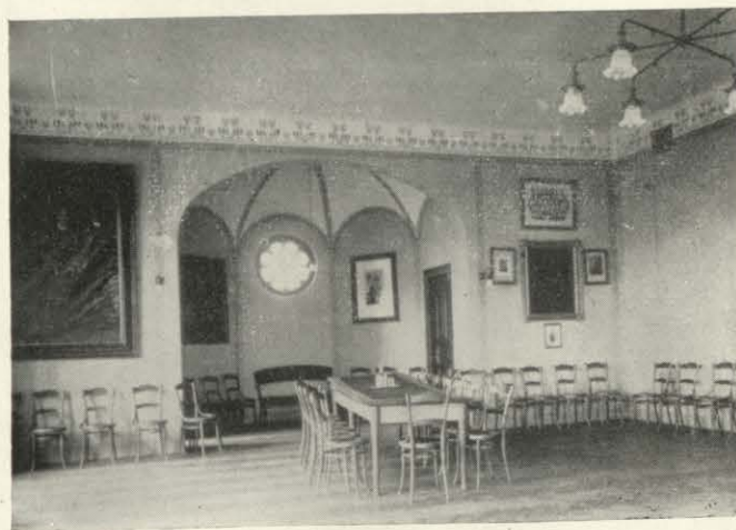
Az egyesület cinkotai árvaházának és nevelő-intézetének díszterme.