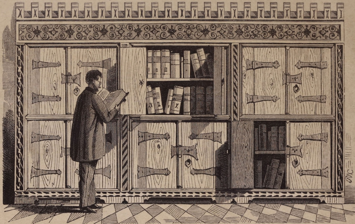
A bártfai templomi könyvtár szekrénye a XVI. század elejéről.