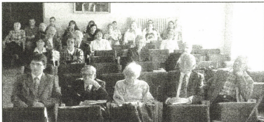
A 2004. novemberi felolvasóülés közönsége