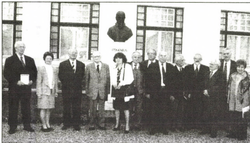
A Comenius Társaság 2004. évi közgyűlésén résztvevők egy csoportja a névadó szobra előtt