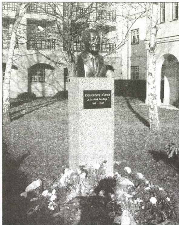
Ködöböcz József szobra