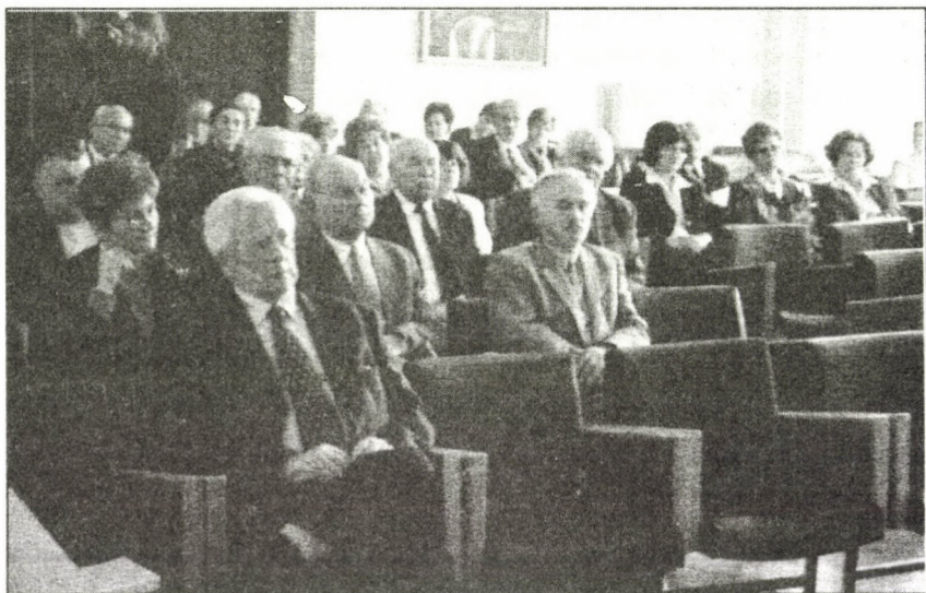
A 2004. novemberi felolvasó ülés közönsége