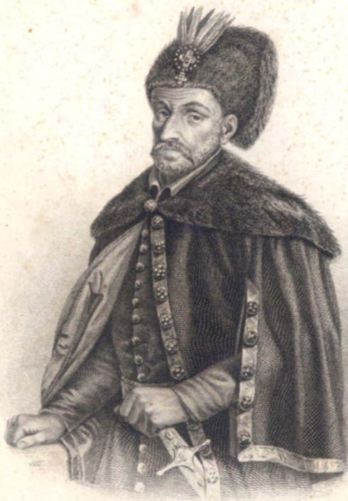
Báthory István a fejedelem.