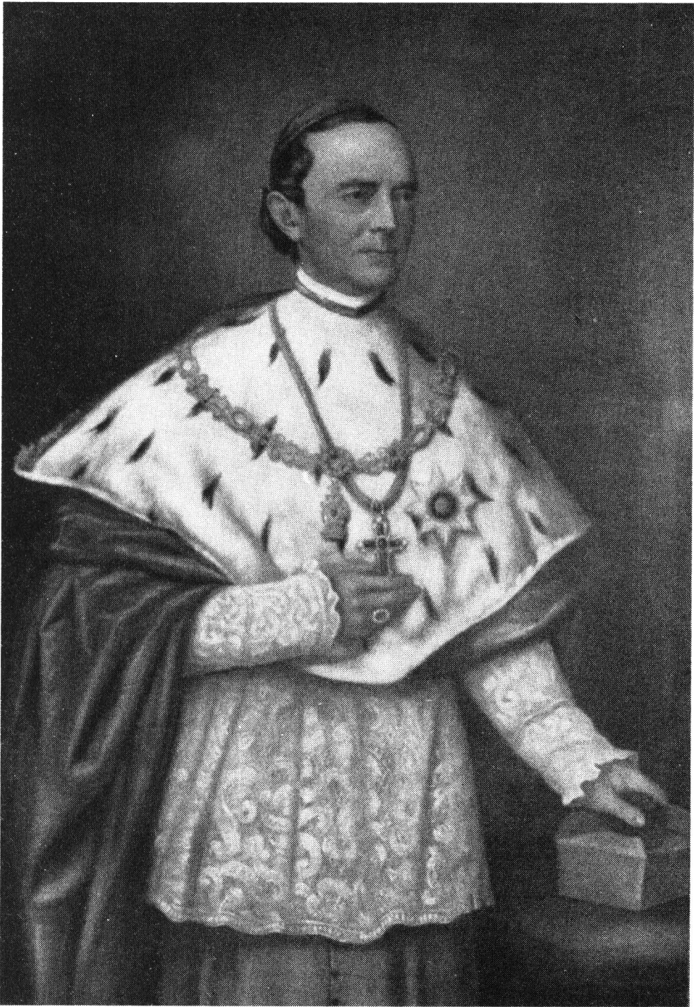
Ranolder János veszprémi püspök