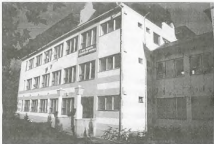
A Vay Miklós Szakképző Iskola

Mivel ma már egyre több szakma eredményes elsajátításához és végzéséhez középfokú végzettségre van szükség, az iskolában az erősen specializált szakképzésen túl megindult a szélesebb spektrumú, a későbbi pályakorrekcióhoz kedvezőbb alapot biztosító szakközépiskolai képzés az épületgépész technikus, a gépjárművezető és karbantartó szakmákban.