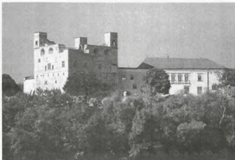
A Rákóczi Vár

S mindezt megerősíti s egyben a vár értékét, népünk életében betöltött jelentős szerepét mutatja az is, hogy a Nemzeti Örökség Bizottsága a “Sárospatak Várkastély” történeti épületet, építményt, együtttest 1990-ben a Nemzeti