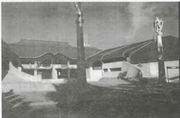
A Művelődés Háza

számon. Az épület művelődéstörténeti értékét, hatását fokozza a tervezőnek az a törekvése, hogy “ég és föld között építészeti kapcsolatot teremtsen, mely értelmezi és kifejezi az ember mozgását és helyét, mégis legyen, környezetére rejtett hatással legyen” s építészete az emberhez, a helyhez, a tájhoz, Európához, a Földhöz kötött épületet jelentsen.” 52 Szakmai sikerére jellemző, hogy az építőművész nagy nemzetközi sikerét az akkori – Kairóban megrendezett – építészvilágkongresszuson érte el s az építményt ma a világ 11 kiemelkedő művészi építménye között tartják számon. Szakmai és közönségsikerét az is jelzi, hogy az épületet, különösen az első években, számos szakember és sok ezer hazai és külföldi turista látogatta, ismerte és csodálta meg.