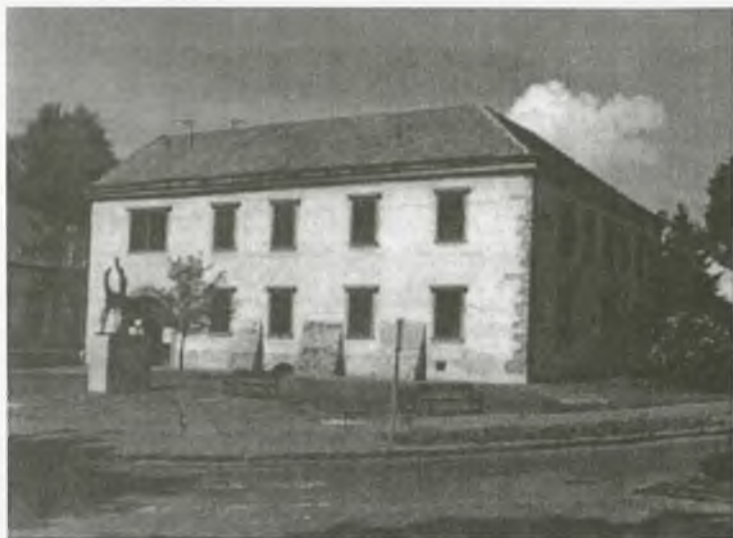
A Sárospataki Képtár

készített vázlatokat, továbbá az önálló festészeti, grafikai igényekkel készült lapokat. A plasztikai alkotások egy része állandó kiállításon látható a Szent Erzsébet út 14. sz. alatti épületben.