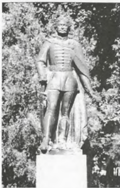
II Rákóczi Ferenc

ságdíjért kegyelmet eszközölt ki. A császári csapatok garázdálkodásától a várost 1683-ban Thököly Imrének csak két évre sikerült megszabadítania.