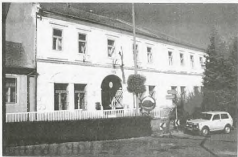
A polgármesteri hivatal