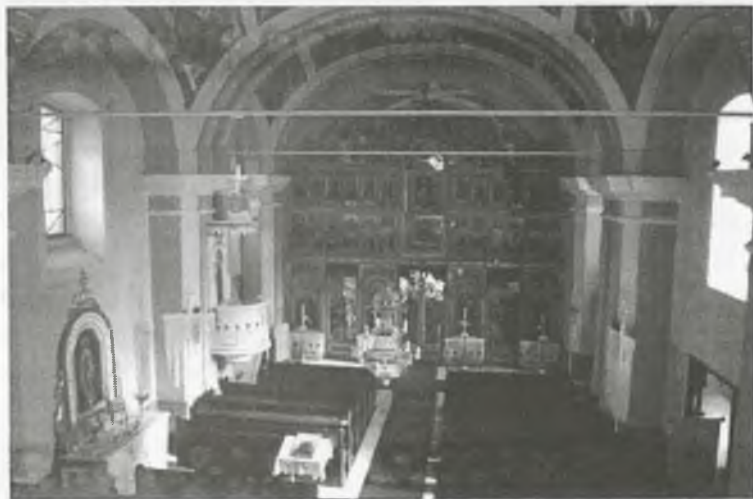
A görög katolikus templom

A templom a barokk építészet egyik érdekes emléke.