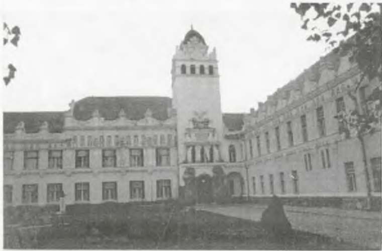
A Tanítóképző Főiskola

ország legszebb, építési szempontból legművészeibb tanítóképző intézete.” 51 Művelődéstörténeti értékét fokozza, hogy ez volt a magyar tanítóképzők első olyan épülete, amely eredetileg is a tanítóképzés céljaira, a tanítóképzés igényeit, követelményeit figyelembe véve terveződött és épült.