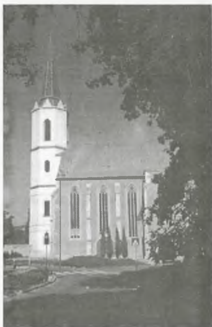
A római katolikus templom

Mivel a reformáció után a törvény kimondta, hogy "akié a föld, azé a vallás", ennek megfelelően amikor a vár kegyura református volt, a reformátusok, amikor pedig a kegyúr katolikus volt, a katolikusok tartottak a templomban istentiszteletet. Az 1670-es Wesselényi-féle szövetség után a várat megszálló császári zsoldos hadsereg a várba vezető kapukat befalaztatta, a templom északi és déli