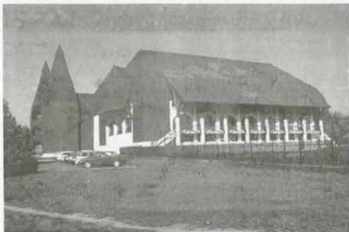
Az Árpád Vezér Gimnázium

Az iskola a tudatos képességfejlesztéssel eléri, hogy a diákok megismerik a tudományos kutatás módszerét, maguk végeznek ilyen munkát, kísérleteznek. Közben sokoldalúan fejlődnek képességeik, különböző kifejező képességük, gondolkodásmódjuk, erősödik önbizalmuk és felelősségérzetük. A tehetséges tanulókat iskolai alapítvány segíti képességeik kibontatoztatásában.