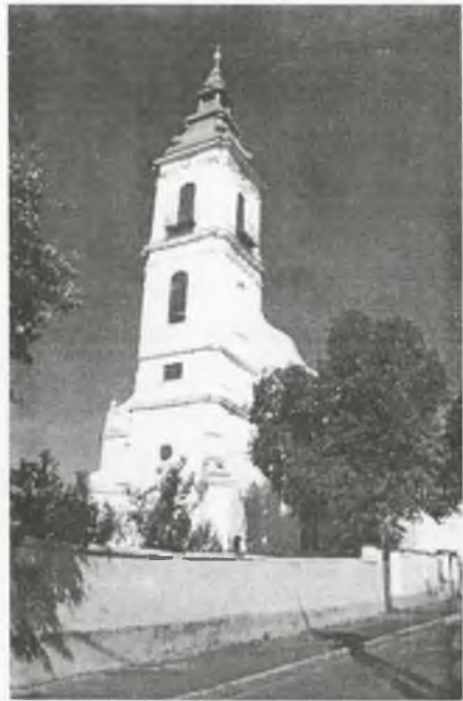
A református templom

Mivel a fa idővel korhadásnak indult, a gyülekezet elhatározta, hogy a református egyház tagjait és a kollégiumi diákokat is befogadó nagyságú kőtemplomot és hozzá 3 haranghoz való tornyot épít. A templom építéséhez királyi engedélyre volt szükség. A kérelmet 1770. május 20-án a Patakon járt II. Józsefnek adták át. Sokféle vizsgálódás, gáncsoskodás után 1775. december 12-én engedélyezték az építést. Az alapkövet 1776. március 27-én tették le, s az építés 5 esztendeig tartott. Mivel 1824-ben a szélvihar a zsindeletet