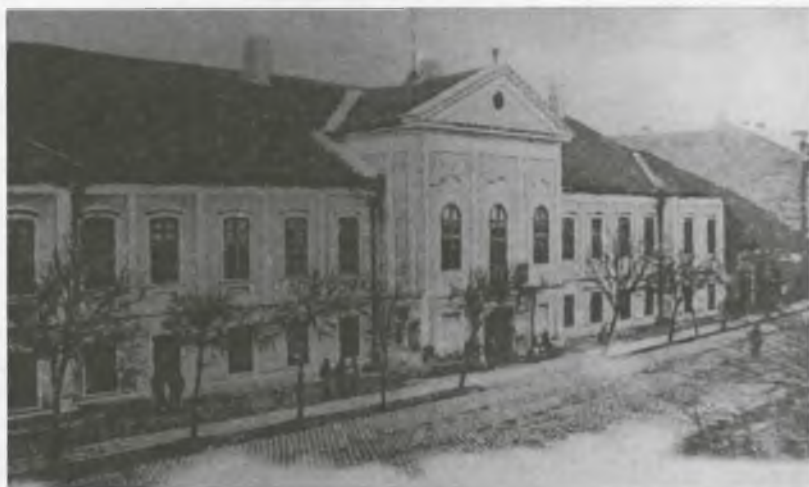
A zempléni megyeháza Sátoraljaújhelyen, a tanfelügyelőség székhelye

Nagy fejlődés mutatható ki a tanulók iskolába járását illetően is. Míg 1869-ben 52062 tanköteles gyermek közül 23894, azaz 45,8 % járt iskolába, 1878-ban a 45892 tanköteles közül 37334 gyermek, azaz 81,3 % látogatta rendszeresen az iskolát. Mindez azt mutatja, hogy Árvey határozott munkája, az iskolai mulasztások ellen folytatott erőteljes küzdelme eredményes volt, hiszen a mulasztások 35,5 %-kal csökkentek. A zempléni eredmény értékét fokozza az országos helyzettel való összehasonlítás is. A VKM országos jelentései szerint a tanköteles gyermekek közül iskolába járt 1869-ben 47,8 % s 1878-ban 77,9 %. Ennek megfelelően az iskolába járás országos helyzete magasabb szintről indult, s csak kisebb mérvű fejlődést, 30,1 %-ot ért el: 1869-ben a rendszeres iskolába járás Zemplénben 2 %-kal volt alacsonyabb az országos átlagnál, míg 1878-ban az országos átlag volt alacsonyabb 3,4 %-kal a megyeinél, azaz a zempléni fejlődés 5,4 %-kal volt magasabb az országos átlagnál.