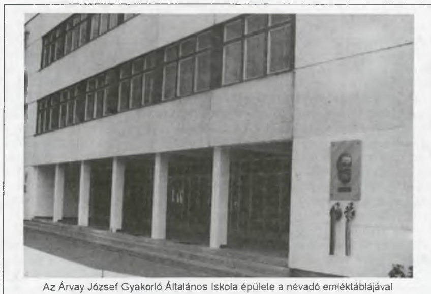
Az Árvay József Gyakorló Általános Iskola épülete a névadó emléktáblájával