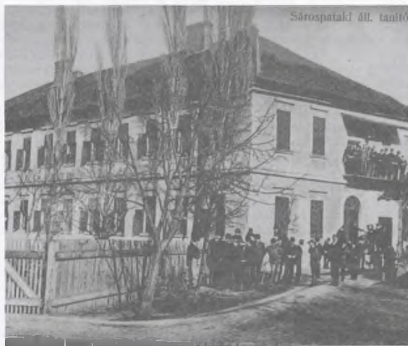
A sárospataki tanítóképző intézet első épülete

A pataki diák volt Egressy Béni (1814-1851) színműíró, zeneszerző, a Szózat ismert zenéjének szerzője, dalköltő; Kováts Mihály (1762-1851) természettudományi író, az első magyar nyelven megjelent önálló kémiai és törvényszéki orvostan szerzője; Pálczy László (1783-1861) politikus, a reformkori országgyűlések vezérszónoka, aki magyar nyelven kezdte meg a törvények szerkesztését, s aki 1849. április 14-én a debreceni nagytemplomban felolvasta a Függetlenségi nyilatkozatot; Balásházi János (1797-1857) történetíró, gazdasági szakíró, a magyar agrártudomány úttörője, a zempléni reformkori liberális nemesség vezérégyénisége; Péchy Tamás (1829-1897) író, újságíró, politikus, miniszter, akinek nagy érdeme van a magyar vasutak ügykezelésének magyarrá tételében; Chalupka János (1791-1871) egyházi író, „a szlovák vígjátékírási atyja” és így tovább.