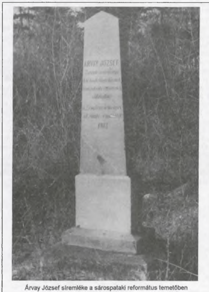
Árvay József síremléke a sárospataki református temetőben