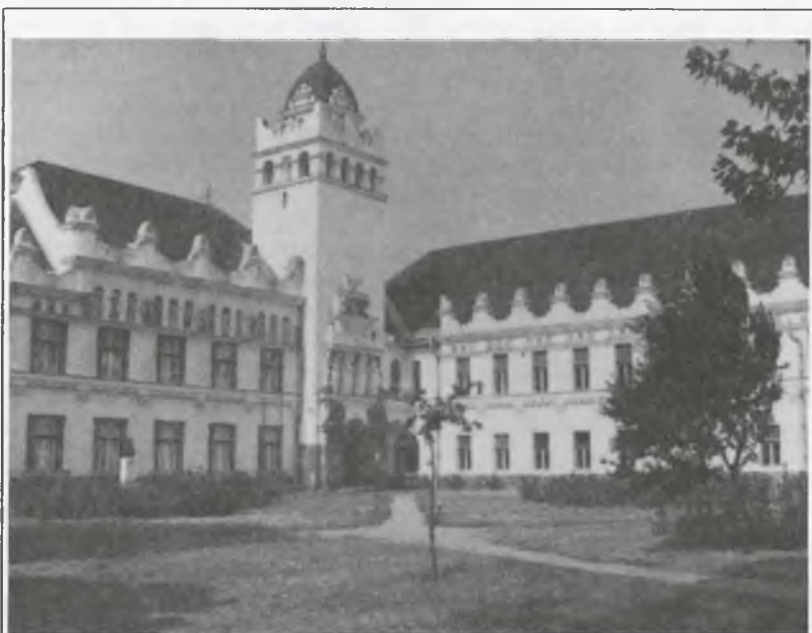
A sárospataki Comenius Tanítóképző Főiskola mai épülete