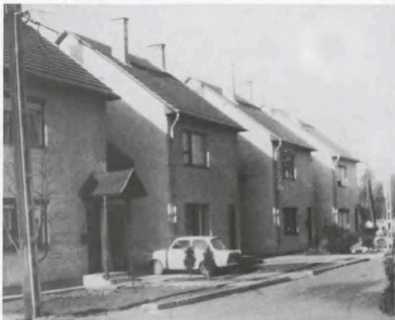
Az Árvay József utca Sárospatakon (részlet)