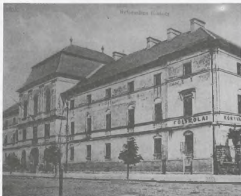
A sárospataki alma mater

Pataki diák s tanár volt Erdélyi János (1814-1869) költő, író, kritikus, filozófus, esztéta, magyar népköltés-gyűjtő, akinek a nevéhez kapcsolódnak részben vagy egészben az 1850-es, 60-as évek kollégiumi újításai, fejlesztései. Innen indult Fogarasi János (1801-1878) író, történetíró, jogtudós, nyelvész, a Magyar Tudományos Akadémia első értelmező szótárának társszerkesztője. Itt dolgozott Hegedűs László (1814-1884) egyházjogász, lelkész, történész, pedagógiai és tankönyvíró, politikus, aki az 1850-es, 60-as és 70-es években nagy szerepet játszott a kollégium fejlesztésében. Pataki gyökerű Kiss Áron (1845-1908) pedagógiai író, „a magyar neveléstörténet Liviusa”, tankönyvíró, újságíró, a Magyar gyermekjáték-gyűjtemény című mű (1891) szerzője, aki elsőként kutatta és dolgozta fel a magyar pedagógiai irodalom múltját; Almási Balogh Pál (1797-1867) történeti, filozófiai, orvosi író, természettudós, az aggteleki cseppkőbarlang első részletes magyar nyelvű leírásának készítője, az állatvédő egyesület és az iparegyesület megteremtője; Tóth Ede (1844-1876) költő, színműíró, A falu rossza című népszínmű szerzője.