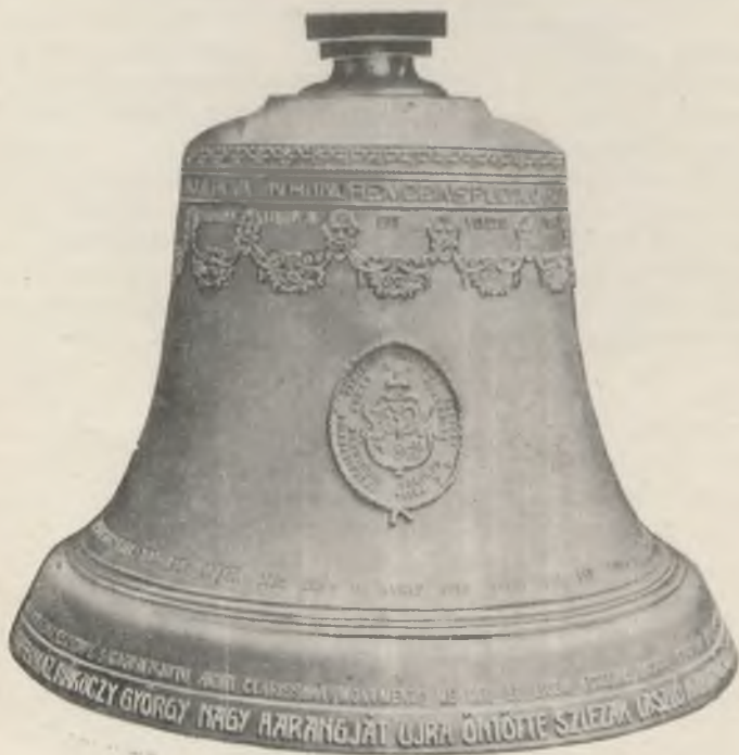
1923-ban Szlezák László által újraöntött Rákóczi-harang.

Az 1824—28 közt 22.000 forintba kerülő építkezés befejezésekor is bizonyára tartottak templomavatási