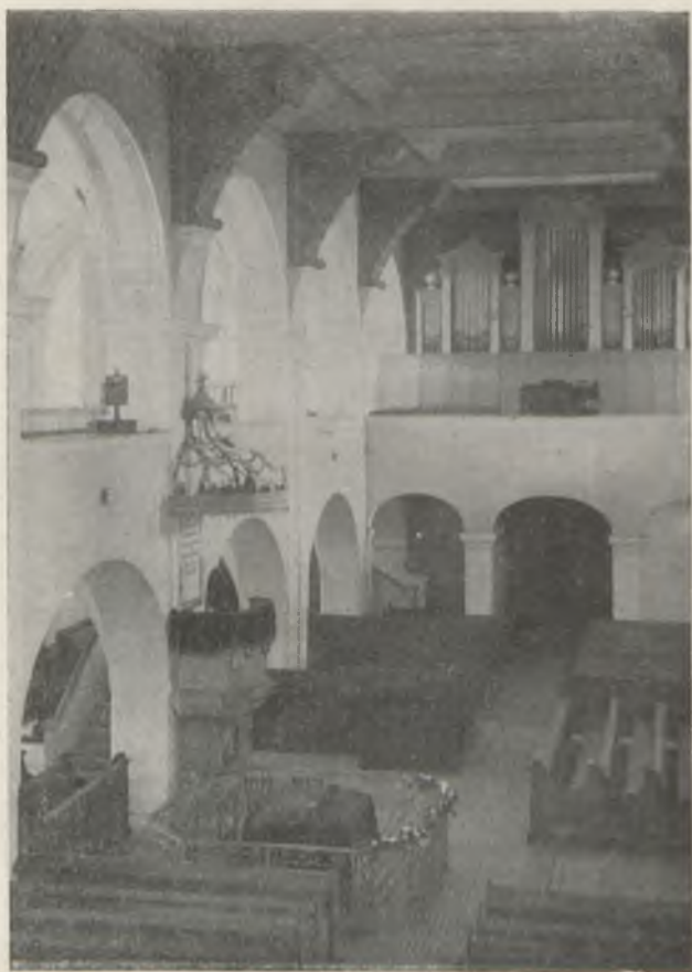
A templom belseje.