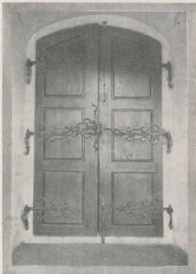
A templom egyik belső ajtaja.