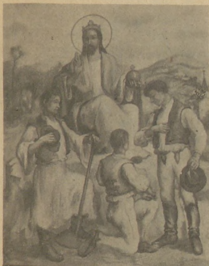
KALOT Népfőiskola kassai kápolna oltárképe 1942