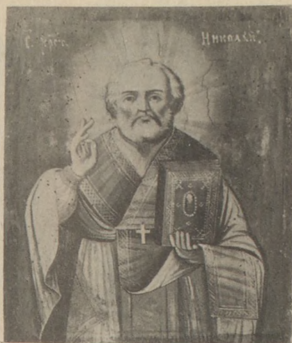
74-es sorszámmal ellátott ikon Szent Miklós