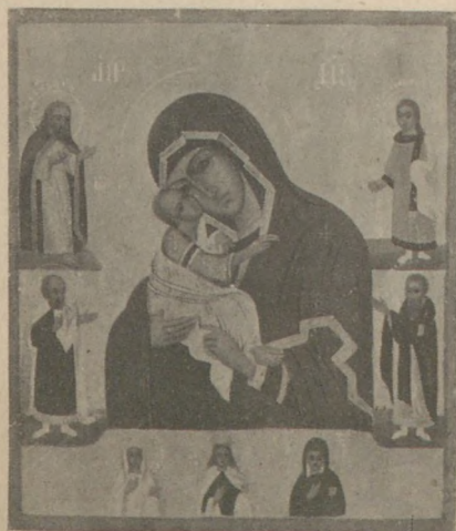
5-ös sorszámmal ellátott Isten szülő ikon