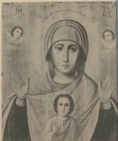
17-es sorszámmal ellátott Isten szülő ikon