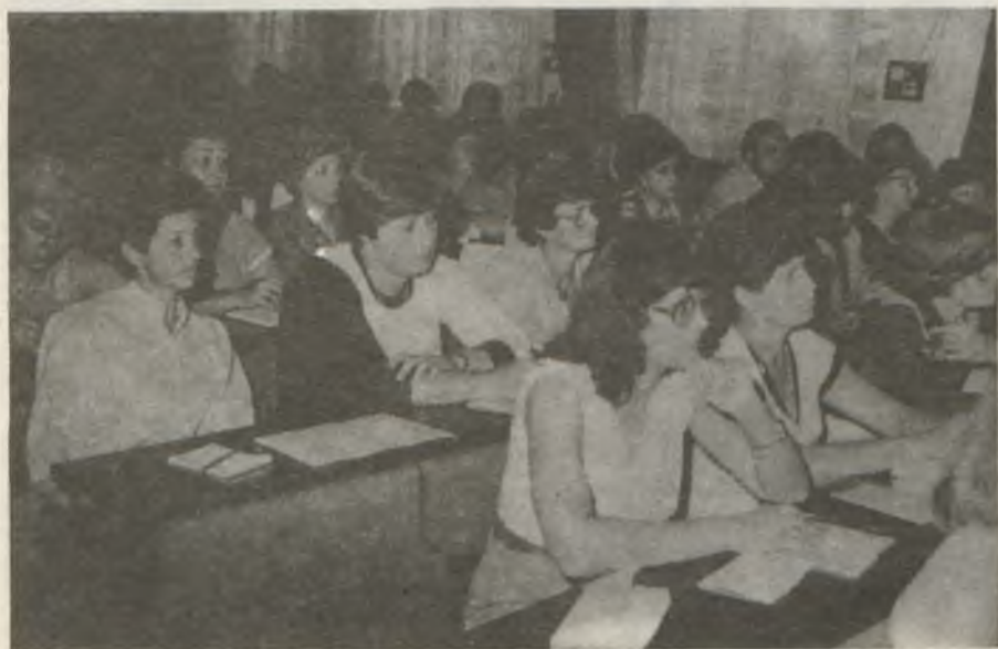
A Tanítók Országos Nyári Akadémiájának résztvevői