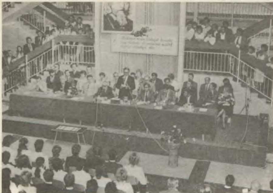
Nyilvános tanévnyitó főiskolai tanácsülés