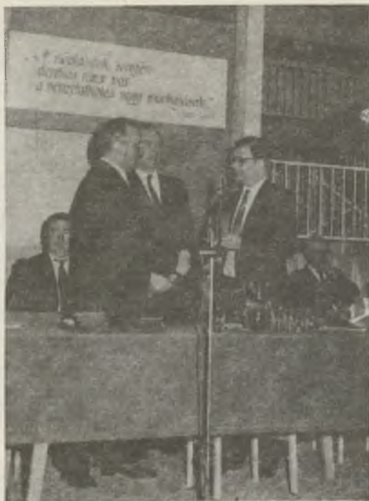
25 éves főiskolánk kapcsolata a bautzeni testvérintézménnyel