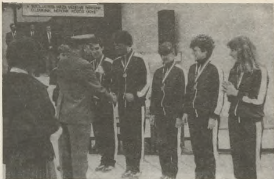
A XII. országos összetett honvédelmi versenyen I. díjat nyert női- és férfi párbajlövészeink