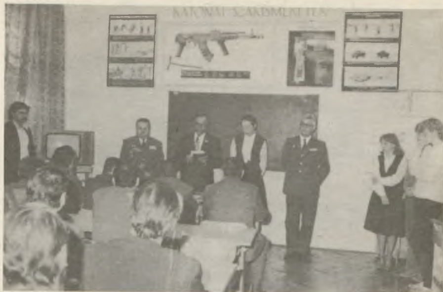
Honvédelmi szaktanterem átadása