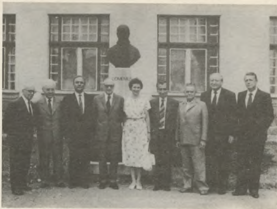
A Magyar Comenius Társaság elnöksége