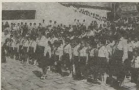
Gyakorlóiskolánk kisdobosainak és úttörőinek avatása