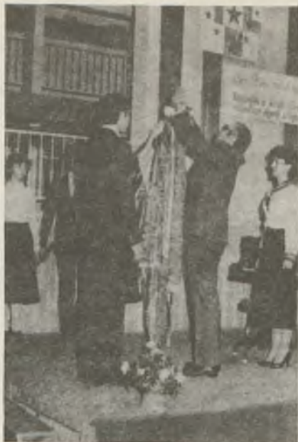
Kétszeres Kiváló Kollégium avatása