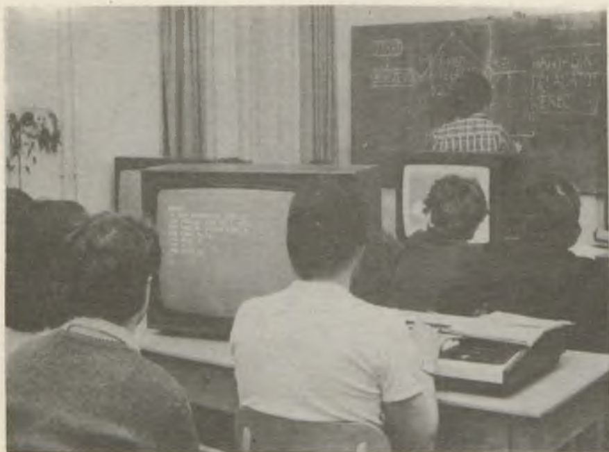
A számítástechnikai laboratóriumban