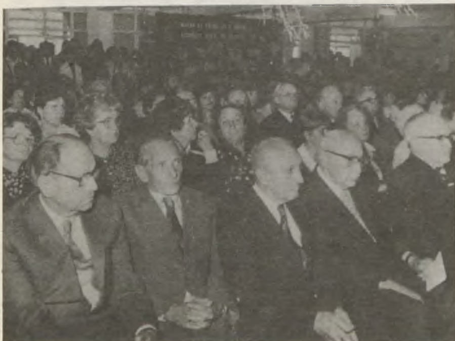
Diszokleveles nyugdíjas pedagógusok