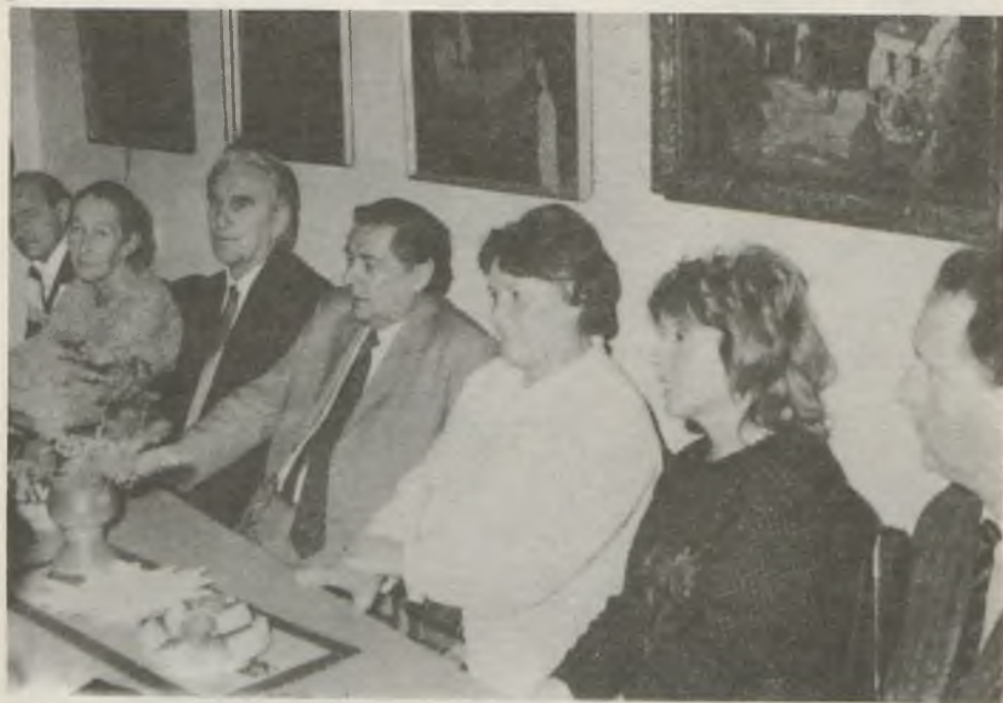
Magyar és csehszlovák pedagógus szakszervezeti vezetők