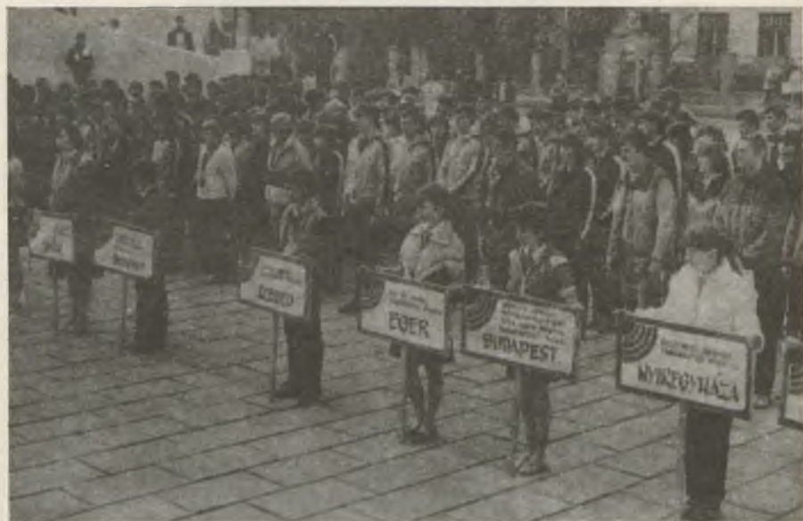
A XII. országos honvédelmi verseny résztvevői