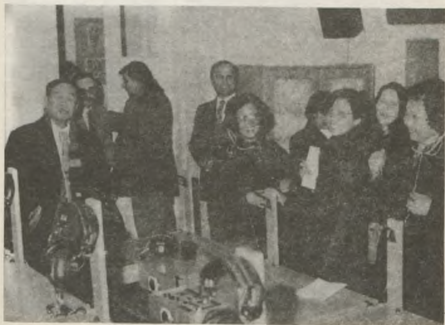
Kínai delegáció a nyelvi laboratóriumban