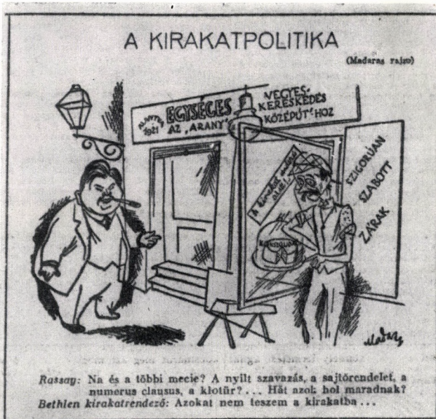
13. Ujság 1929. április 21. (Korabeli karikatúra)