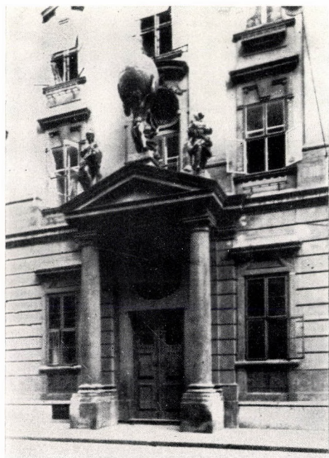
10. A Városháza épülete