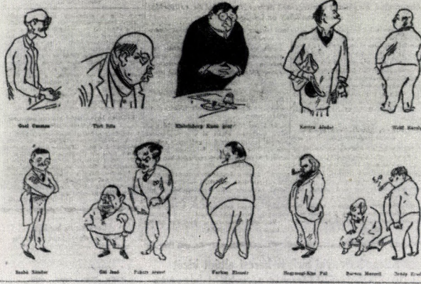
12. Ujság 1928. február 19. (Korabeli karikatúra)

(MÁDARAS MOST MEGJELENT KÁRIKATÚRA-KÖNYVEDŐL)