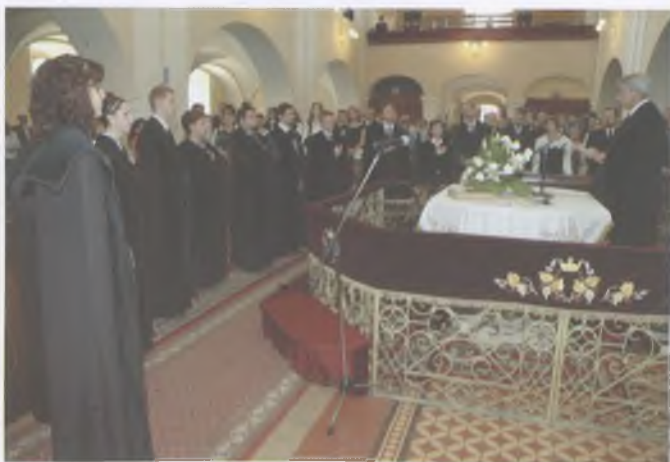
Segédlelké- szek eskütéte- le 2006-ban