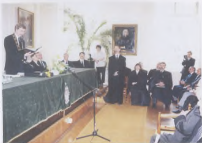
Doktoravatás Debrecenben, 1998