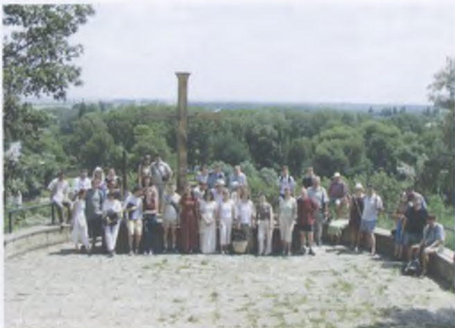
Teológusok kirándulása Tokajba 2004- ben