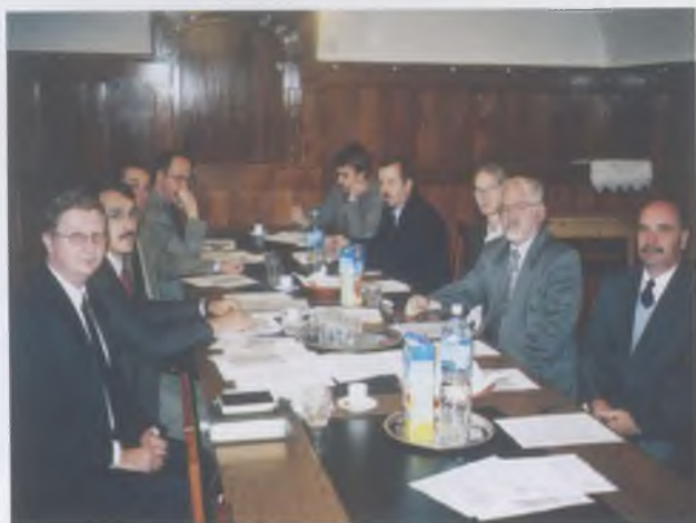
Debreceni és pataki teológiai tanárok megbeszélése a Tanácssteremben 2004-ben