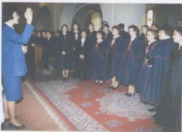
A teológus kórus énekel az évnytón, 1996 szeptember