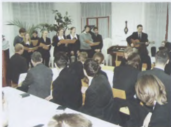
Teológus csendesnap a Lorántffy teremben (2004)