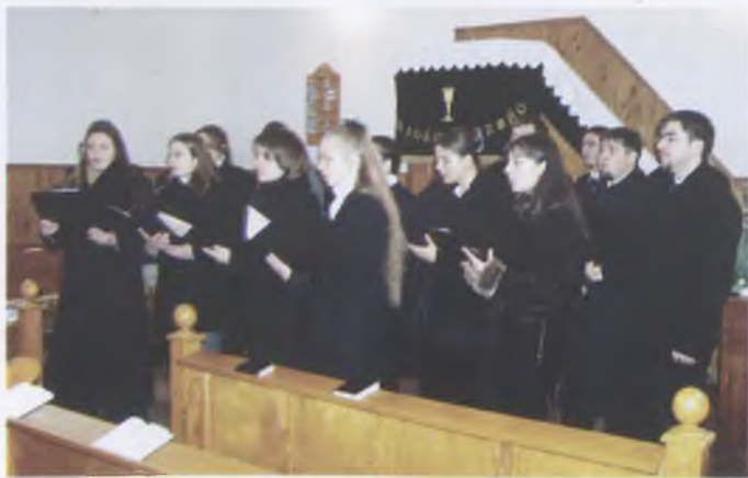
Teológus kiszállás, Kaposfő, 2004