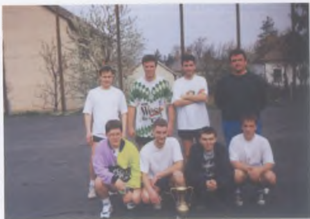
Harmadik évfolyam focicsapata, 1997