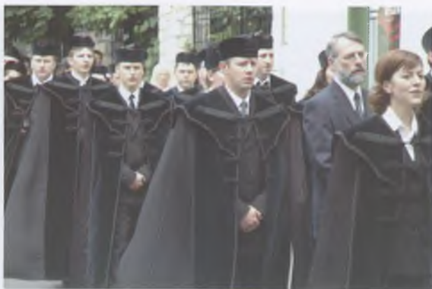
Útban a lelkész- szentelésre (2006)