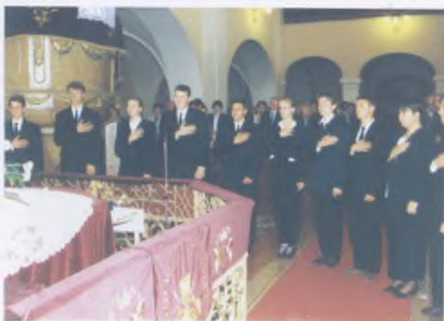
Évnyitó 1997- ben, minősítő vizsgát tett hallgatók fogadalomtétele