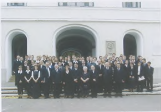
Az Akadémia hallgatói és tanárai a 2003. évi évnyitó előtt