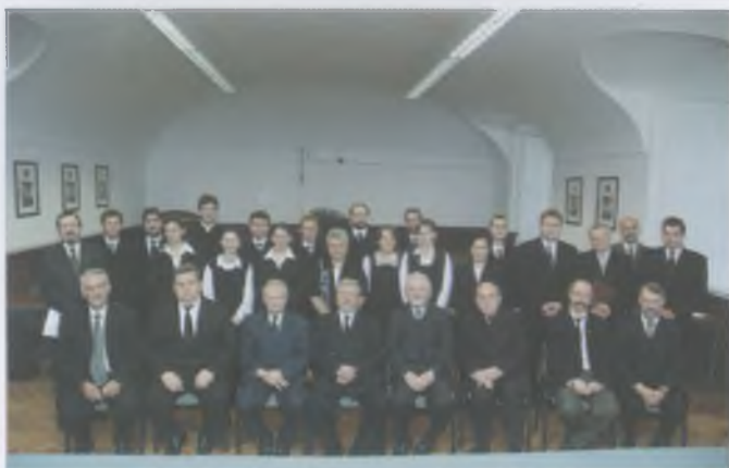
A lelkes- képesítő bizottság és a vizsgát tett lelkészek 2006-ban