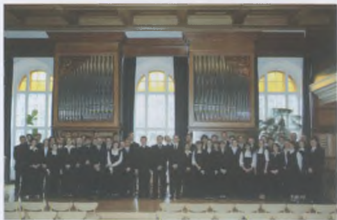
A teológus gyülekezet a 2006. évi pünkösdi legációk kibocsátó istentisztelet után a felújított Imateremben