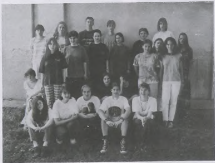
Az Évkönyv 1990-96 terjesztői, a II. E