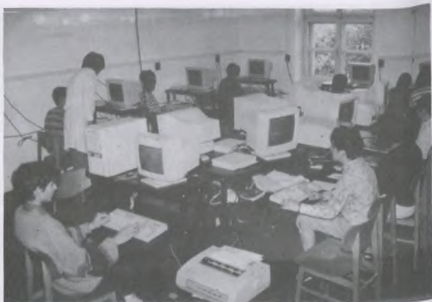
A gimnázium számítástechnika tanterme