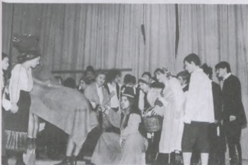
Az Obsidio Patakiana c.iskolatörténeti színdarab előadása, 1996