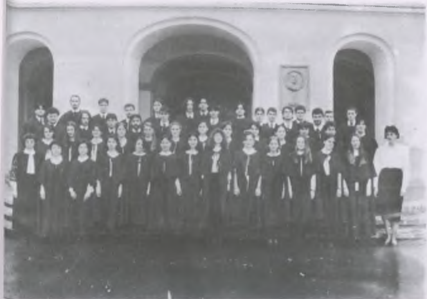
A gimnázium kórusa, 1996