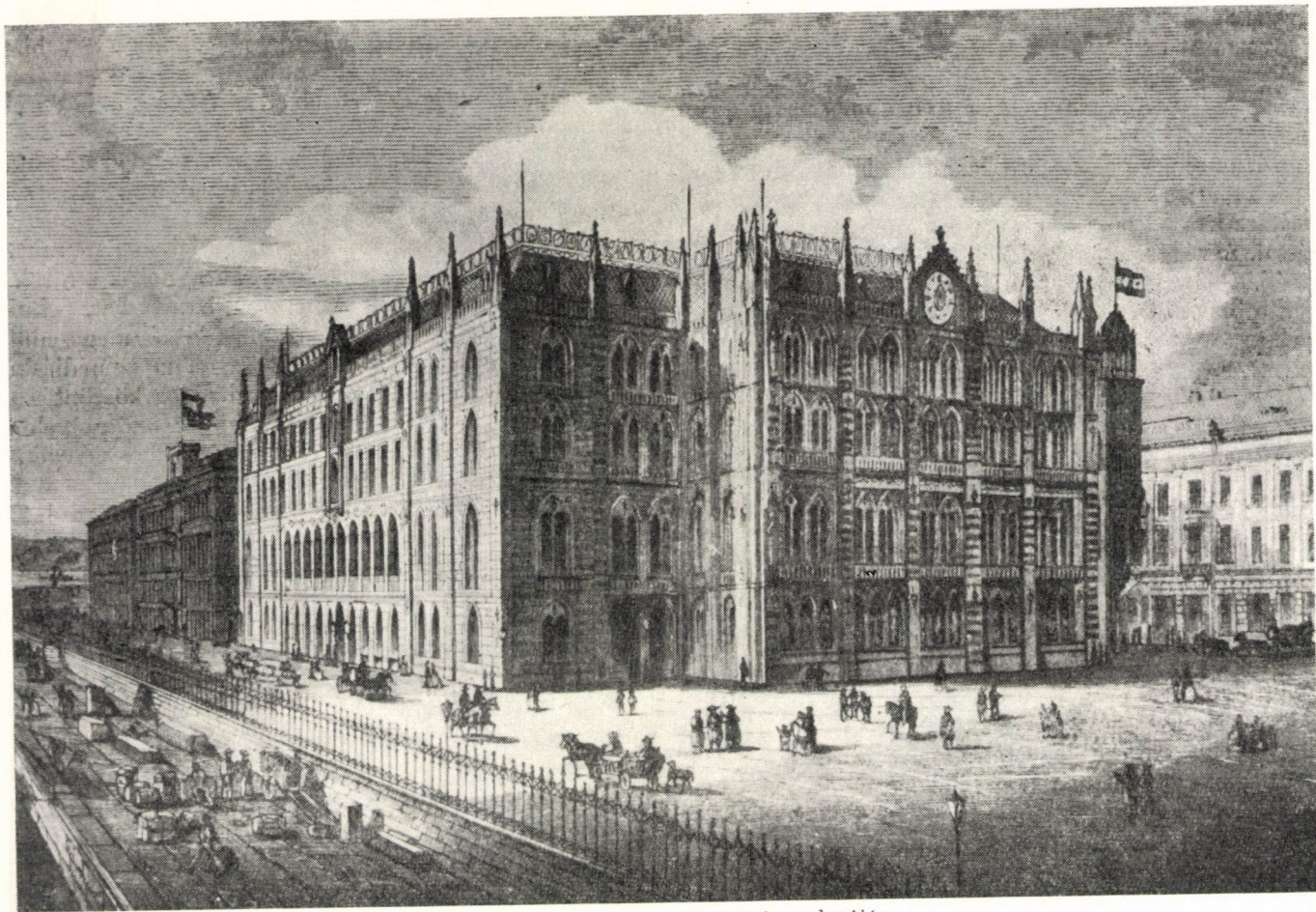
4. Henszlmann Imre terve az Akadémia palotájára