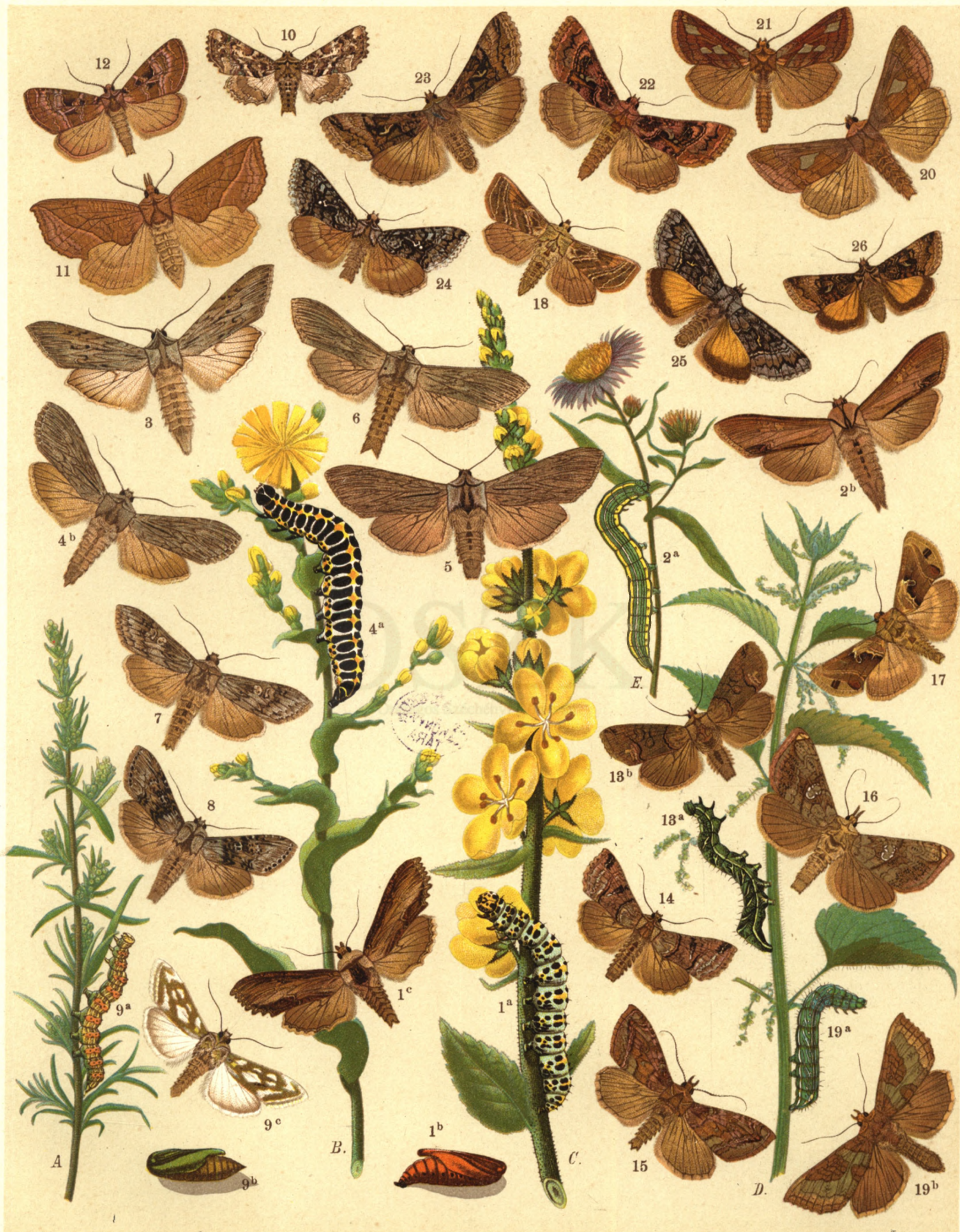
1a. b. c. Cucullia Verbasici . — 2a. b. C. Asteris . — 3. C. Umbratica . — 4a. b. C. Lactucae . — 5. C. Lucifuga . — 6. C. Chamomillae . — 7. C. Artemisiae . — 8. C. Absinthii . — 9a. b. c. C. Argentea . — 10. Eurhipia Adulatrix . — 11. Calpe Capucina . — 12. Telesilla Amethystina . — 13 a. b. Abrostola Triplasia . — 14. Abr. Tripartita . — 15. Plusia C. aureum . — 16. Pl. Moneta . — 17. Pl. Consona . — 18. Pl. Modesta . — 19 a. b. Pl. Chrysitis . — 20. Pl. Bractea . — 21. Pl. Festucae . — 22. Pl. Jota . — 23. Pl. Gamma . — 24. Pl. Interrogationis . — 25. Pl. Ain . — 26. Pl. Hochenwarthi .