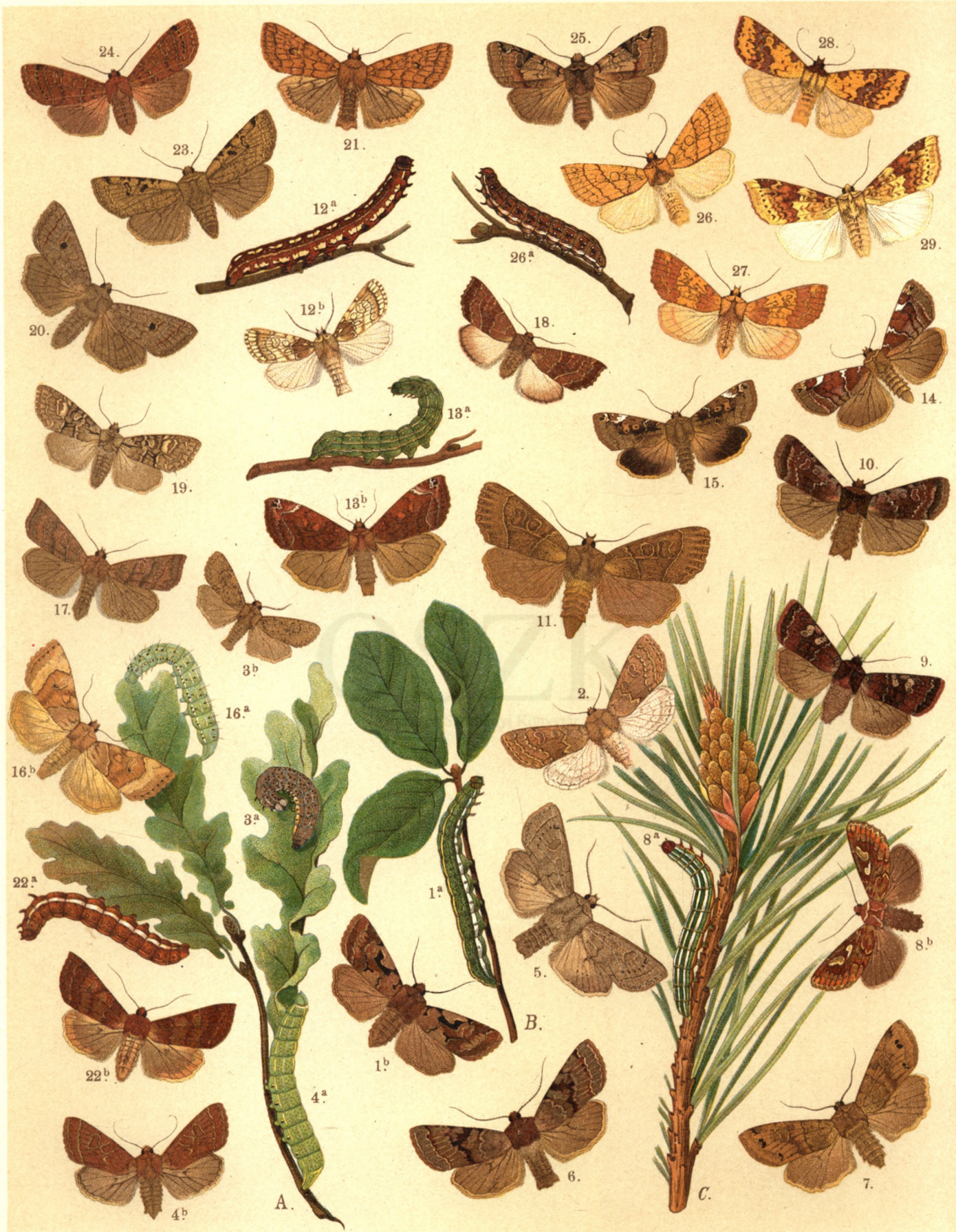
1 a. b. Taeniocampa Gothica . — 2. T. Miniosa . — 3 a. b. T. Pulverulenta . — 4 a. b. T. Stabilis . — 5. T. Gracilis . 6. T. Incerta . — 7. T. Munda . — 8 a. b. Panolis griseovariegata . — 9. Pachnobia Leucographa . — 10. Pachn. Rubricosa . 11. Mesogona Acetosellae . — 12 a. b. Dicycla Oo . — 13 a. b. Calymnia Pyralina . — 14. Cal. Diffinis . — 15. Cal. Affinis . — 16 a. b. Cal. Trapezina . — 17. Plastenis Retusa . — 18. Cirroedia Ambusta . — 19. Cleoceris Viminalis . 20. Orthosia Lota . — 21. O. Circellaris . — 22 a. b. O. Helvola . — 23. O. Pistacina . — 24. O. Nitida . — 25. O. Litura . 26 a. b. Xanthia Citrago . — 27. X. Aurago . — 28. X. Lutea . — 29. X. Fulvago .