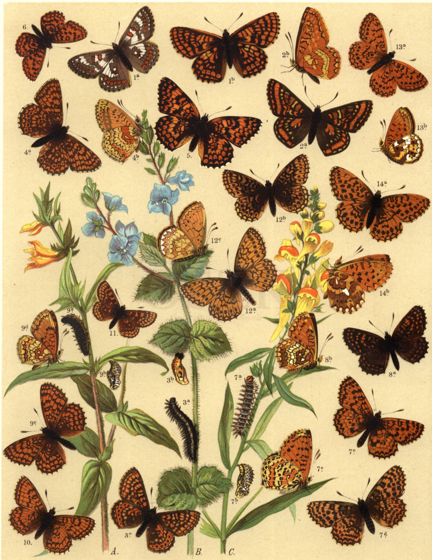
1 a. ♂ b. ♀ Melitaea Cynthia . — 2 a. b. M. Maturna . — 3 a. b. c. M. Aurinia . — 4 a. b. M. Cinxia . — 5. M. Phoebe . — 6. M. Trivia . — 7 a. b. c. e. ♂ d. ♀ M. Didyma . — 8 a. b. M. Dictynna . — 9 a. b. c. d. M. Athalia . — 10. M. Parthenie . — 11. M. Asteria . — 12 a. b. c. Argynnis Apherape . — 13 a. b. Arg. Semele . — 14 a. b. Arg. Euprosyne .