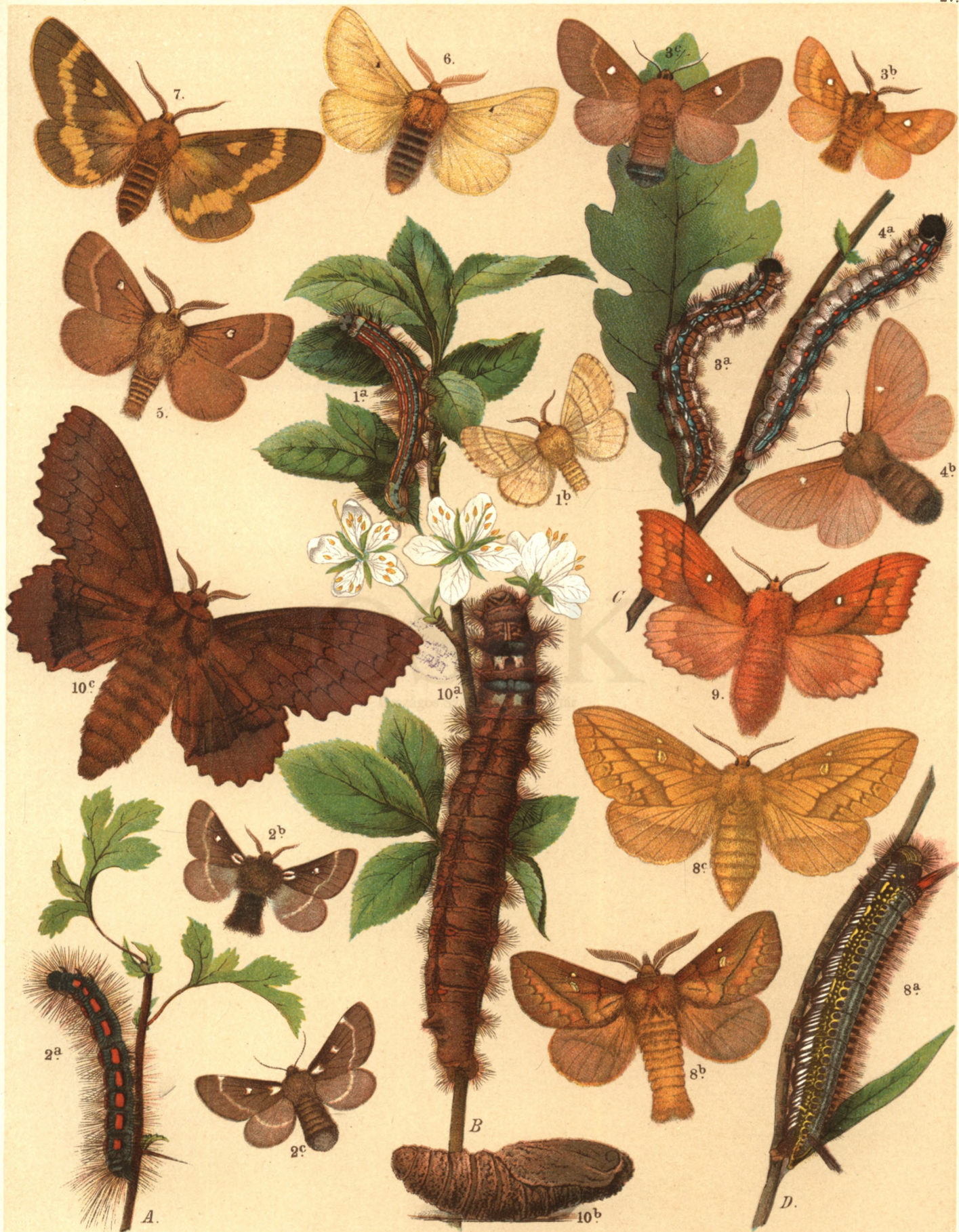
1 a. b. (♂) Malacosoma Neustria . — 2 a. b. ♂, c. ♀ Eriogaster Lanestris . — 3 a. b. ♂, c. ♀ Er. Catax . 4 a. b. (♀) Er. Rimicola . — 5. Bombyx Trifolii . — 6. Lemonia Taraxaci . — 7. Lem. Dumi . — 8 a. b. ♂, c. ♀ Cosmotriche Potatoria . — 9. Odonestis Pruni . — 10 a. b. c. Gastropacha Quercifolia .