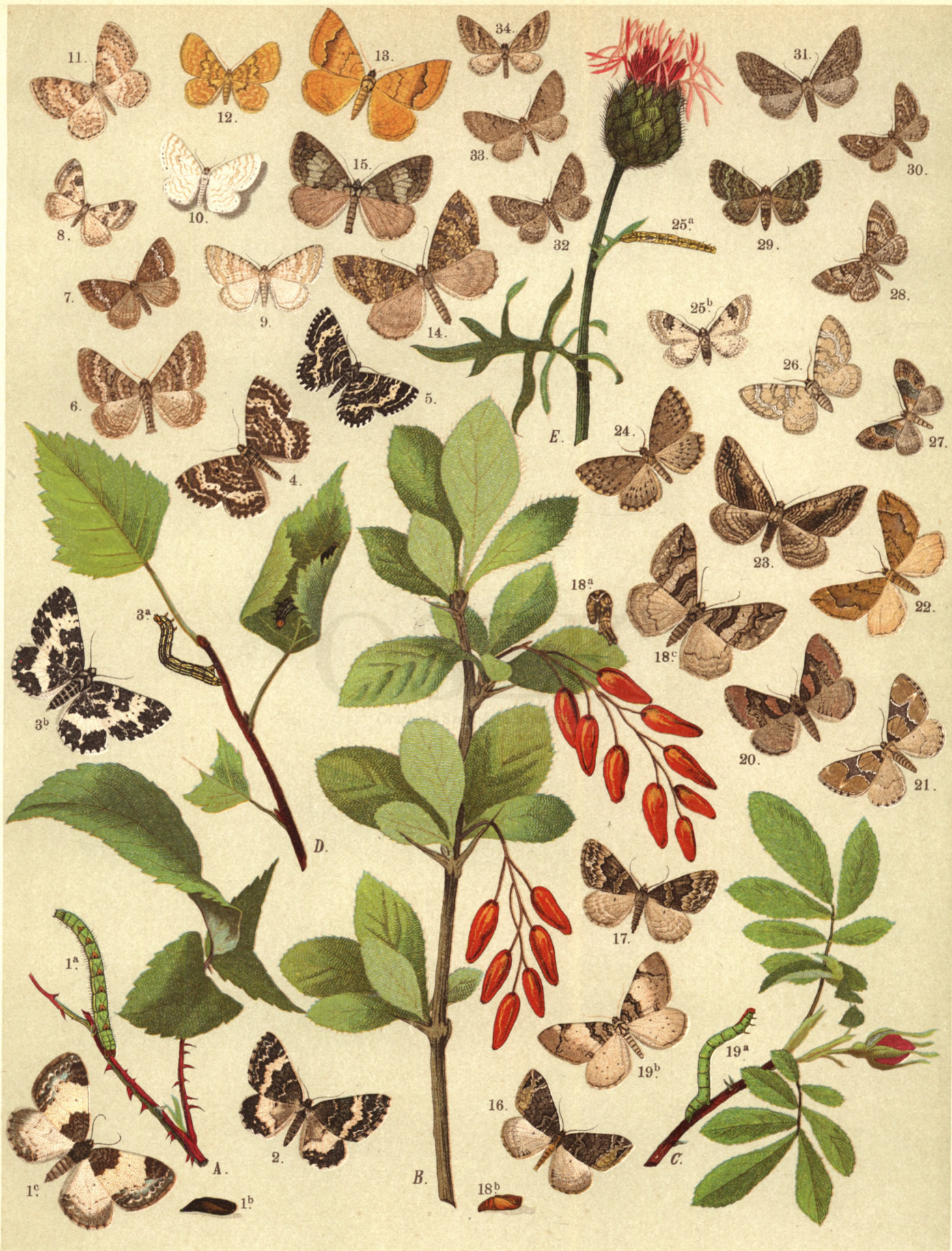
1 a. b. c. Larentia Albicillata . — 2. Lar. Lugubrata . — 3 a. b. Lar. Hastata . — 4. Lar. Tristata . — 5. Lar. Luctuata . — 6. Lar. Molluginata . — 7. Lar. Alchemillata . — 8. Lar. Adaequata . — 9. Lar. Albulata . — 10. Asthena Candidata . — 11. Larentia Testaceata . — 12. Lar. Luteata . — 13. Lar. Bilineata . — 14. Lar. Sordidata . — 15. Lar. Autumnalis . — 16. Lar. Capitata . — 17. Lar. Corylata . — 18 a. b. c. Lar. Berberata . — 19 a. b. Lar. Nigrofasciaria . — 20. Lar. Rubidata . — 21. Lar. Sagittata . — 22. Lar. Comitata . — 23. Phibalapteryx Vitalbata . — 24. Collix Sparsata . — 25 a. b. Tephroclystia Oblongata . — 26. Tephr. Venosata . — 27. Tephr. Linariata . — 28. Tephr. Abietaria . — 29. Chloroclystia Rectangulata . — 30. Tephroclystia Nanata . — 31. Tephr. Innotata . — 32. Tephr. Satyrata . — 33. Tephr. Absinthiata . — 34. Tephr. Lanceata .