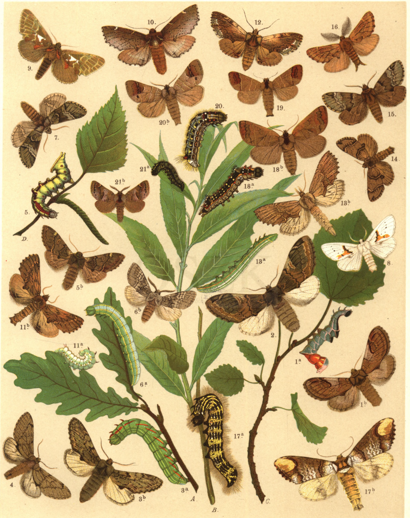
1 a. b. Notodonta Ziczac . — 2. Not. Phoebe . — 3 a. b. Not. Trepida . — 4. Not. Tritophus . — 5 a. b. Not. Dromedarius . 6 a. b. Drymonia Chaonia . — 7. Drym. Trimacula . — 8. Leucodonta Bicoloria . — 9. Spalattia Argentea . — 10. Odontosia Carmelita . — 11 a. b. Lophopteryx Camelina . — 12. Loph. Cuculla . — 13 a. b. Pterostoma Palpina . — 14. Ochrostigma Velitaris . — 15. Ochr. Melagona . — 16. Ptilophora Plumigera . — 17 a. b. Phalera Bucephala . — 18 a. b. Pygaera Anastomosis . — 19. Pyg. Curtula . — 20 a. b. Pyg. Anachoreta . — 21 a. b. Pyg. Pigra .