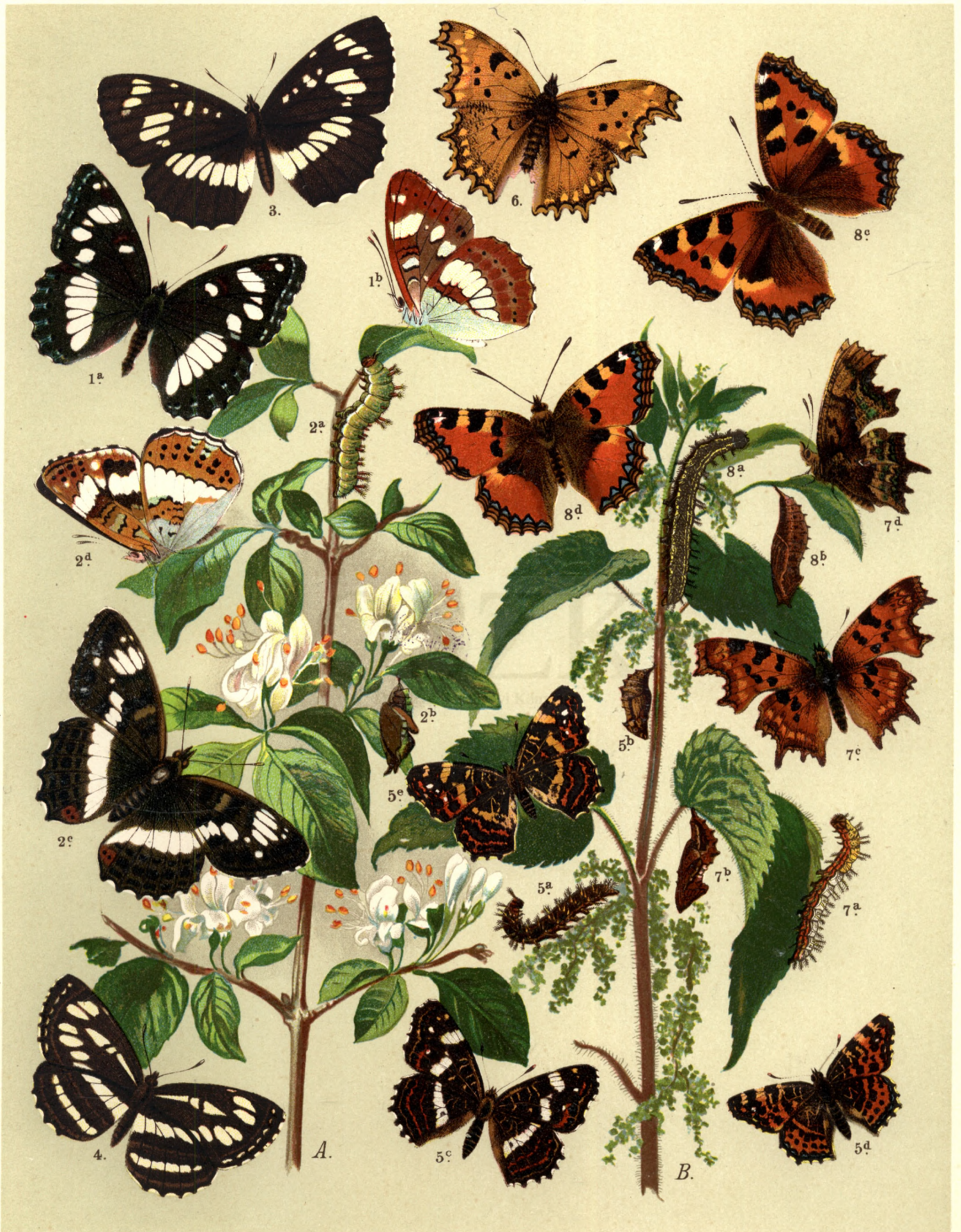
1 a. b. Limenitis Camilla . — 2 a. b. c. d. Lim. Sibylla . — 3. Neptis Lucilla . — 4. Neptis Aceris . — 5 a. b. c. Araschnia Levana . — 5 d. var. Prorsa , 5 e. var. Porima . — 6. Polygonia Egea . — 7 a. b. c. d. Polyg. C album . — 8 a. b. c. Vanessa Urticae , 8 d. var. Ichnusa .