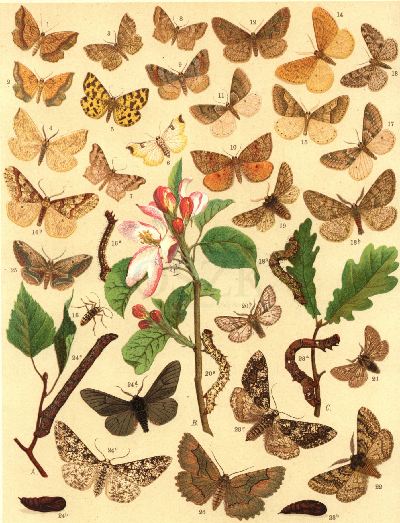
1. Epione Apiciaria . — 2. Ep. Paralellaria . — 3. Ep. Advenaria . — 4. Hypoplectis Adpersaria . — 5. Venilia Macularia . — 6. Ellicrinia Cordiaria . — 7. Semiothisa Alternaria . — 8. M. Signaria . — 9. M. Litorata . — 10. Epirranthis Pulverata . — 11. Hybernia Rupicapraia . — 12. Hyb. Bajaria . — 13. Hyb. Leucophaearia . — 14. Hyb. Aurantiaria . — 15. Hyb. Marginaria . — 16 a. b. c. Hyb. Defoliaria . — 17. Anisopteryx Aescularia . — 18 a. b. Phigalia Pedaria . — 19. Biston Hispidaria . — 20. B. Pomonaria . — 21. B. Zonaria . — 22. B. Hirtaria . — 23 a. b. c. B. Strataria . — 24 a. b. c. Amphidasis Betularia . — 24 d. var. Doubledayaria . — 25. Hemerophila Abruptaria . — 26. Nychiodes Lividaria .