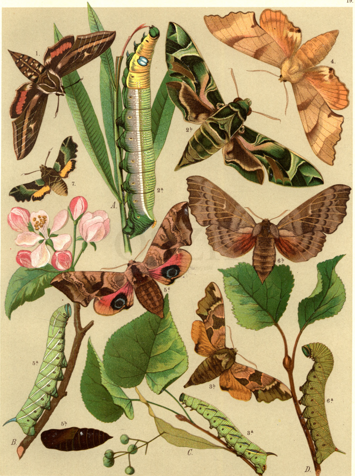
1. Deilephila Livornica . 2 a. b. Deil. Nerii . 3 a. b. Smerinthus Tiliae . 4. Smer. Quercus . 5 a. b. c. Smer. Ocellata . 6 a. b. Smer. Populi . 7. Pterogon Proserpina .