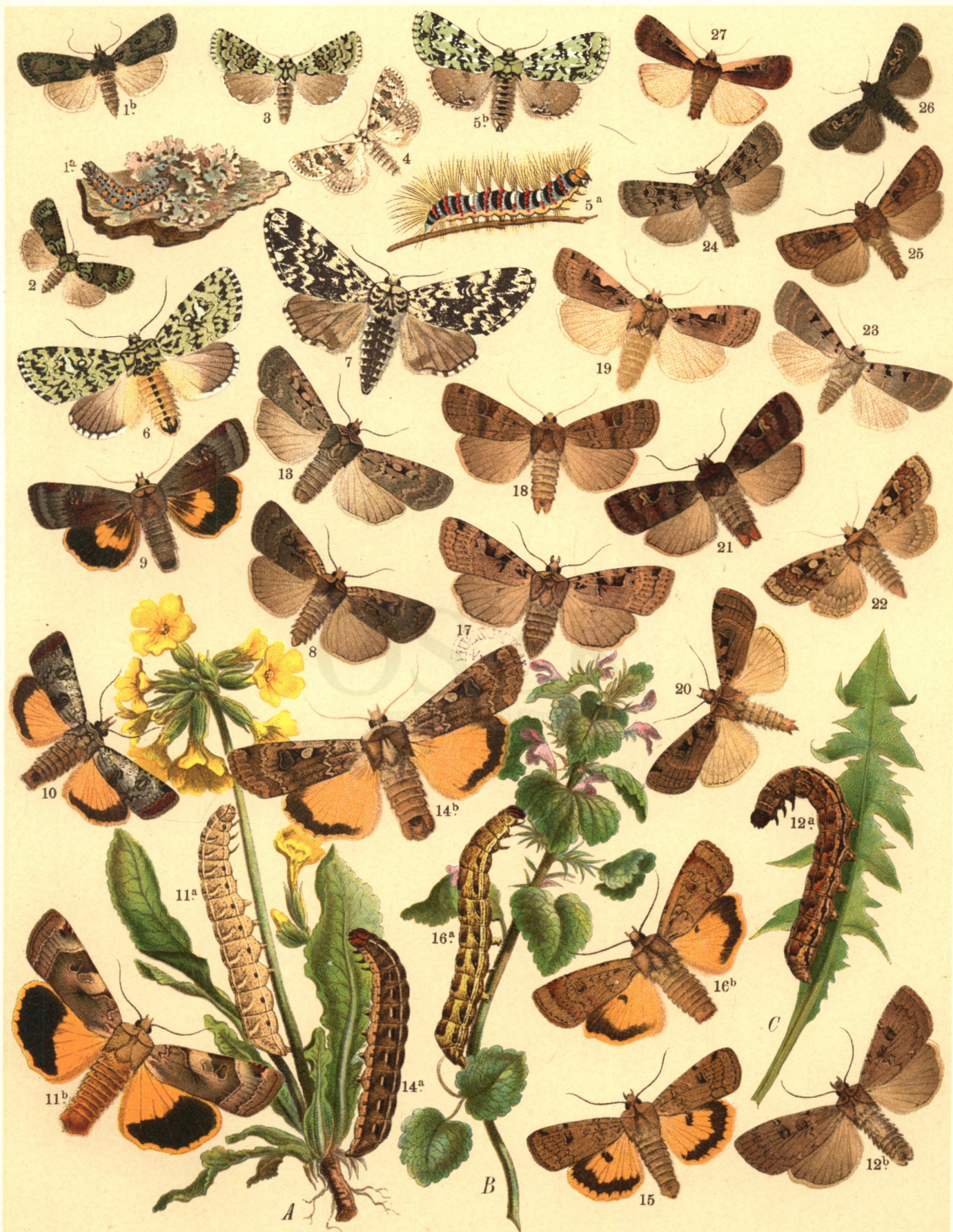
1 a. b. Bryophila Raptacula . — 2. Br. Algae . — 3. Br. Muralis . — 4. Br. Perla . — 5 a. b. Diptera Alpium . — 6. Trichosea Ludifica . — 7. Panthea Coenobita . — 8. Agrotis Signum . — 9. A. Janthina . — 10. A. Linogrisea . — 11 a. b. A. Fimbria . 12 a. b. A. Augur . — 13. A. Obscura . — 14 a. b. A. Pronuba . — 15. A. Orbona . — 16 a. b. A. Comes . — 17. A. Triangulum . — 18. A. Baja . — 19. A. Cnigrum . — 20. A. Ditrapezium . — 21. A. Brunnea . — 22. A. Primulae . 23. A. Glareosa . — 24. A. Multangula . — 25. A. Cuprea . — 26. A. Ocellina . — 27. A. Plecta .