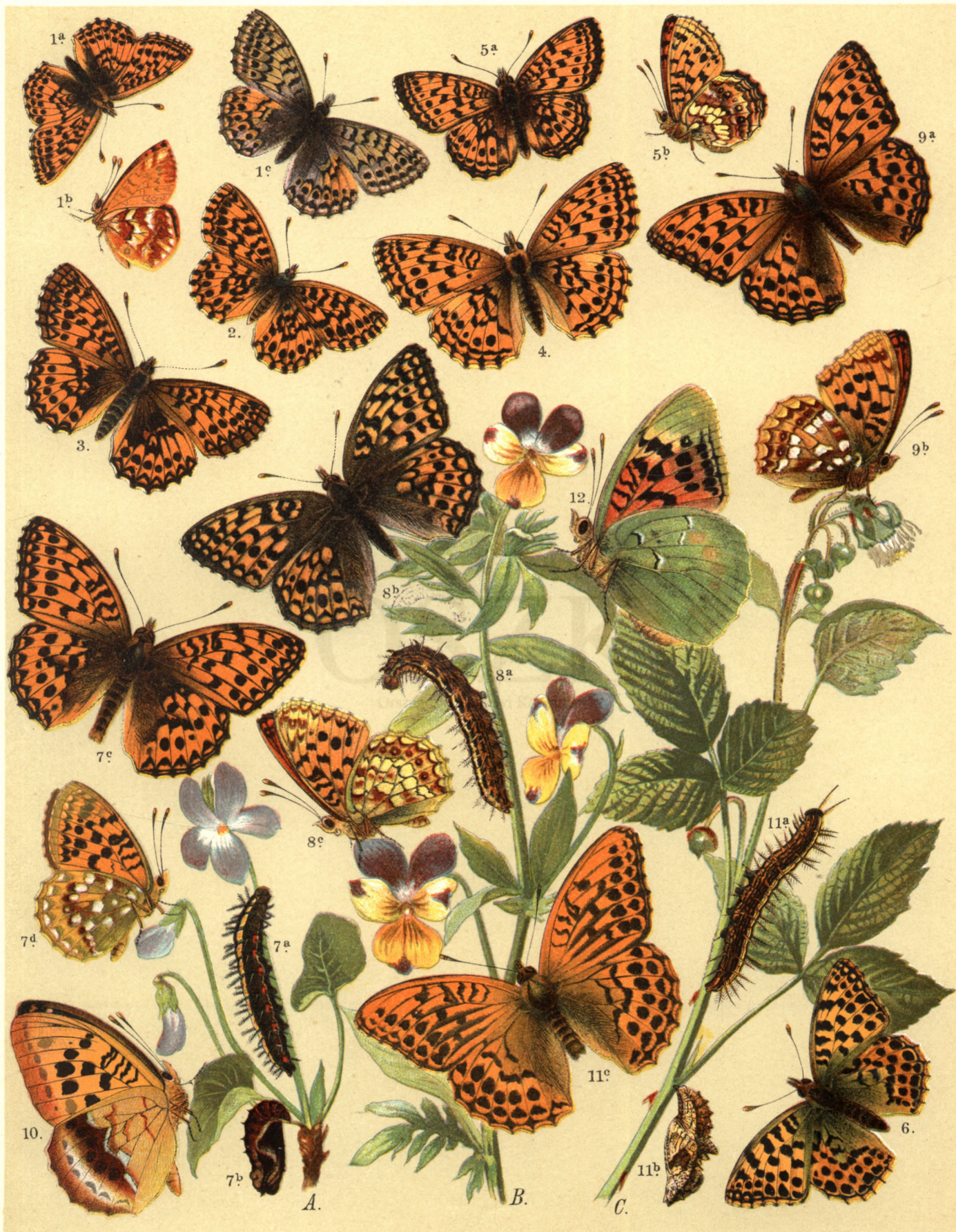
1 a. b. Argynnis Pales , 1 c. var. Napaea . — 2. Arg. Dia . — 3. Arg. Amathusia . — 4. Arg. Daphne . — 5 a. b. Arg. Ino . 6. Arg. Latonia . — 7 a. b. c. d. Arg. Aglaia . — 8 a. b. ♀ c. ♂ Arg. Niobe . — 9 a. b. Arg. Adippe . — 10. Arg. Laodice . 11 a. b. c. ♂ Arg. Paphia . — 12. Arg. Pandora .