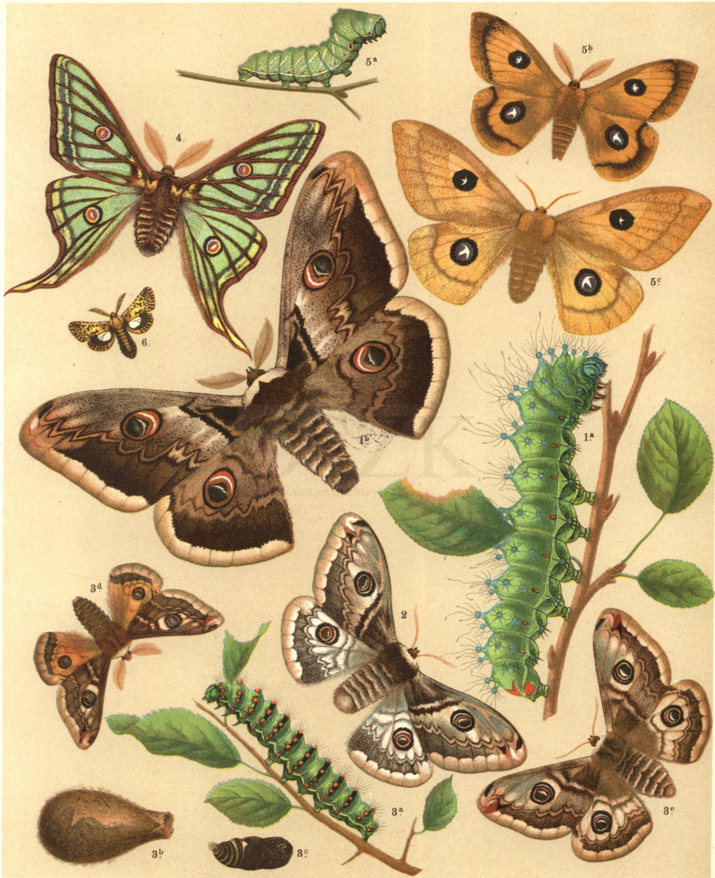
1 a. b. Saturnia Pyri . — 2. Sat. Spini . — 3 a. b. c. d. ♂, e. ♀ Sat. Pavonia . — 4. Graellsia Isabellae . 5 a. b. ♂, c. ♀ Aglia Tau . — 6. Stygia Australis .