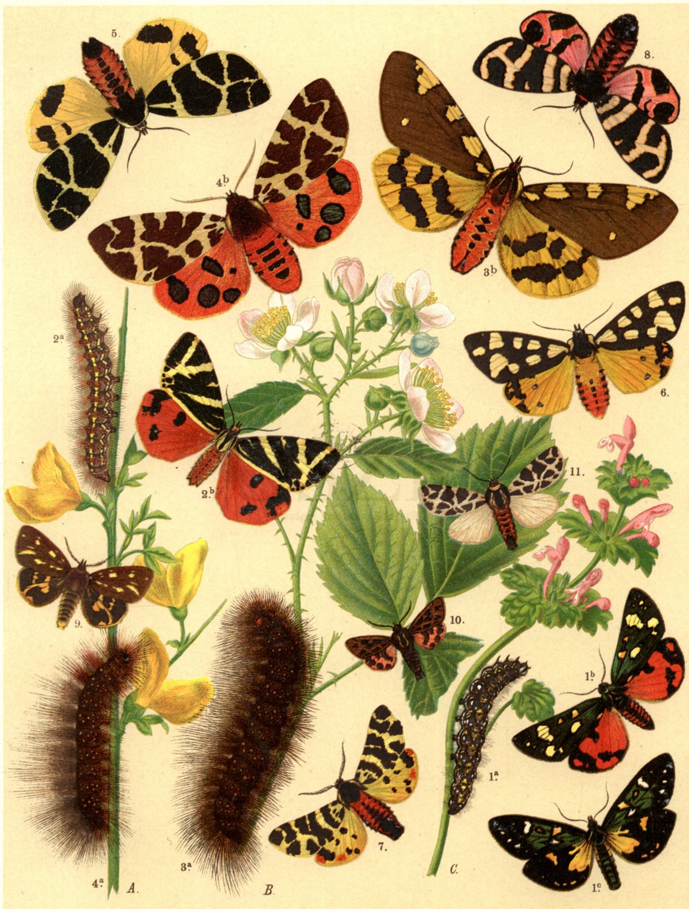
1 a. b. Callimorpha Dominula , 1 c. var. Persona . — 2 a. b. Callim. Quadripunctaria . — 3 a. b. Pericallia Matronula . 4 a. b. Arctia Caja . — 5. Arctia Flavia . — 6. Arctia Villica . — 7. Arctia Fasciata . — 8. Arctia Hebe . — 9. Arctia Aulica . — 10. Arctia Maculosa . — 11. Euprepia Pudica .