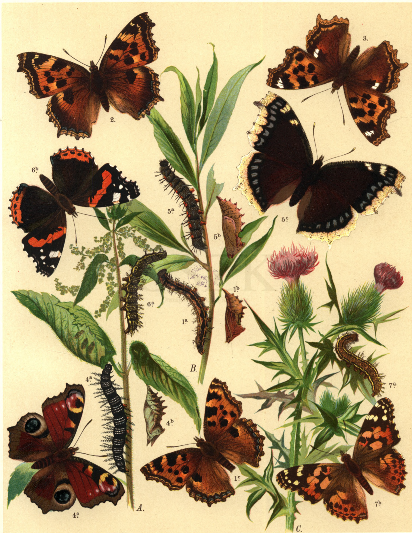
1 a. b. c. Vanessa Polychloros . — 2. Van. Xanthomelas . — 3. Polygonia L album . — 4 a. b. c. Vanessa Jo. 5 a. b. c. Van. Antiope . — 6 a. b. Pyrameis Atalanta . — 7 a. b. Pyr. Cardui .