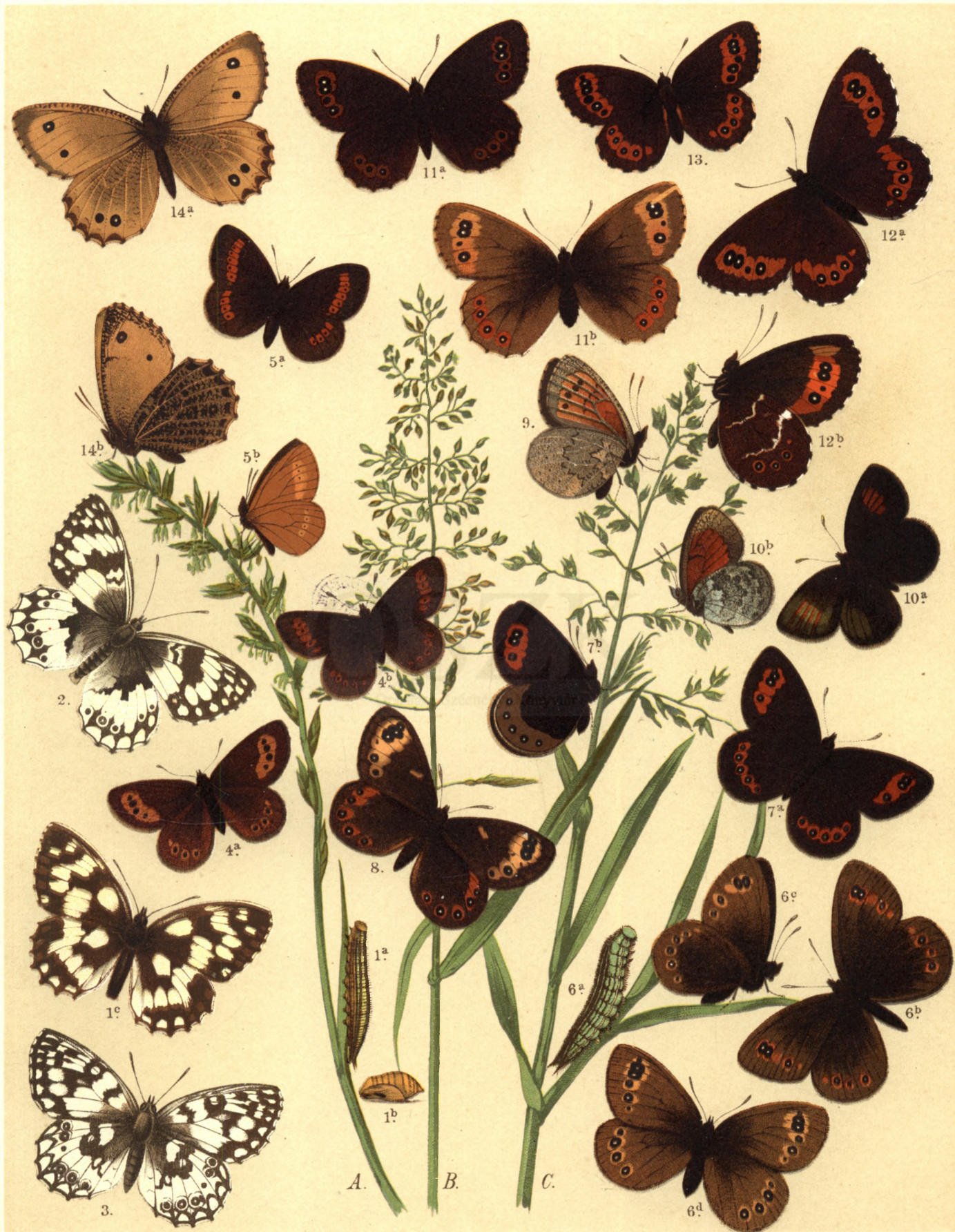
1 a. b. c. Melanargia Galatea . 2. Mel. Larissa . 3. Mel. Japygia . 4 a. Erebia Epiphron , b. var. Cassiope . 5 a. b. Er. Melampus . 6 a. b. c. ♂ d. ♀ Er. Medusa . 7 a. b. Er. Stygne . 8. Er. Epistygne . 9. Er. Lappona . 10 a. b. Er. Tyndarus . 11 a. ♂ b. ♀ Er. Aethiops . 12 a. b. Er. Ligea . 13. Er. Euryale . 14 a. b. Oeneis Aello .