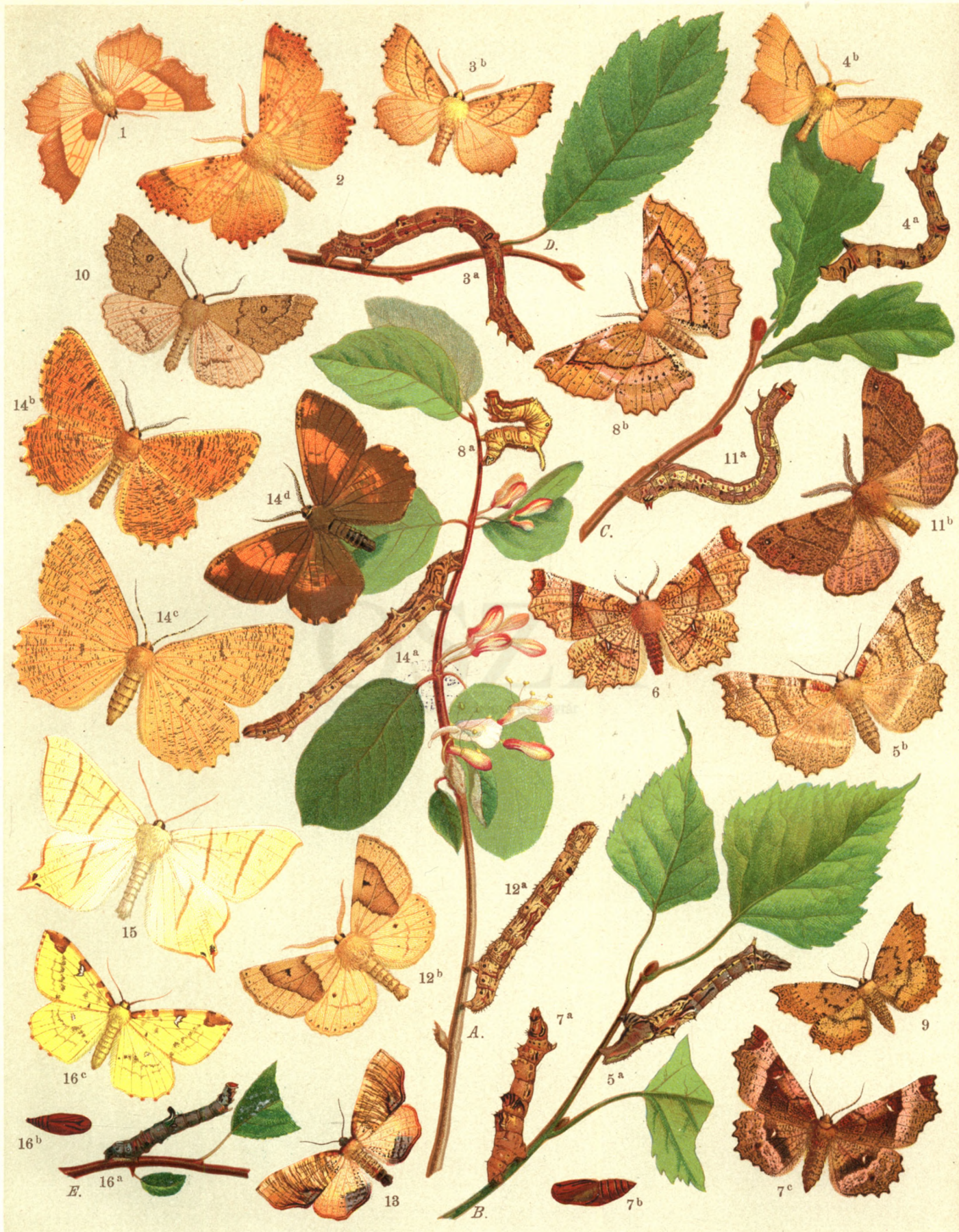
1, Ennomos Querinaria . — 2, Eug. Autumnaria . — 3 a. b, Eug. Alniaria . — 4 a. b, Eug. Erosaria . — 5 a. b, Selenia Bilunaria . — 6, Sel. Lunaria . — 7 a. b. c, Sel. Tetralunaria . — 8 a. b, Hygrochroa Syringaria . — 9, Therapis Evonymaria . — 10, Gonodontia Bidentata . — 11 a. b, Himera Pennaria . — 12 a. b, Crocallis Elinguaria . — 13, Eurymene Dolabraria . — 14 a. b. c, Angerona Prunaria . — 14 d, var. Sordida . — 15, Urapteryx Sambucaria . — 16 a. b. c, Opisthograptis Luteolata .