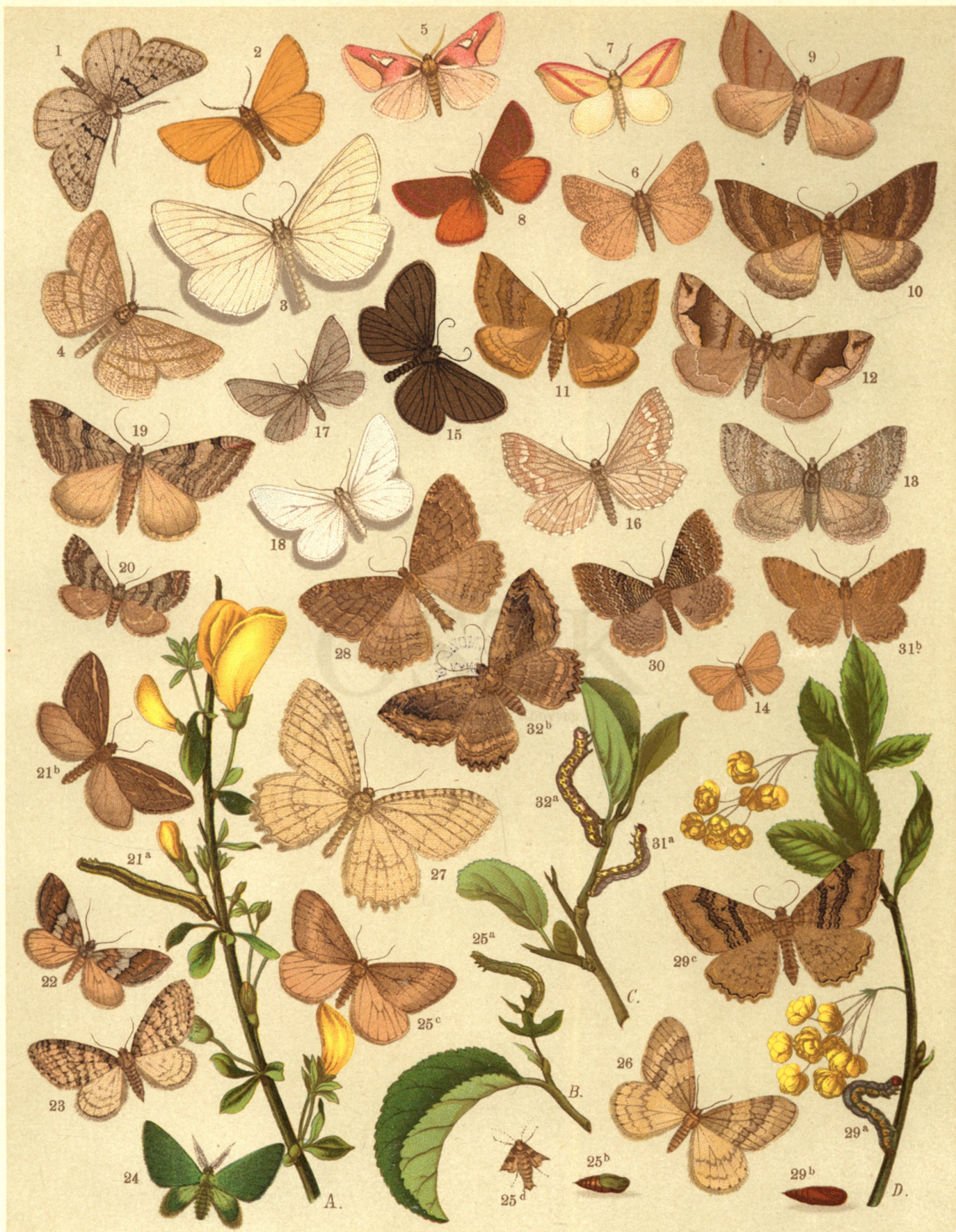
1. Scodiona Fagaria . — 2. Cleogene Lutearia . — 3. Scoria Lineata . — 4. Aspilates Strigillaria . — 5. Cimelia Margarita . — 6. Aplasta Ononaria . — 7. Stierha Sacraria . — 8. Lythria Purpuraria . — 9. Ortholitha Plumbaria . — 10. O. Cervinata . — 11. O. Limitata . — 12. O. Moeniata . — 13. O. Bipunctaria . — 14. Minoa Murinata . — 15. Odezia Atrata . — 16. Siona Decussata . — 17. Lithostege Griseata . — 18. L. Farinata . — 19. Anaitis Plagiata . — 20. A. Paludata . — 21 a. b. Chesias Spartiata . — 22. Ch. Rufata . — 23. Lobophora Carpinata . — 24. Sparta Paradoxaria . — 25 a. b. c. d. Cheimatobia Brumata . — 26. Ch. Boreata . — 27. Triphosa Sabaudia . — 28. Tr. Dubitata . — 29 a. b. c. Eucosmia Certata . — 30. Euc. Undulata . — 31 a. b. Scotosia Vetulata . — 32 a. b. c. Sc. Rhamnata .