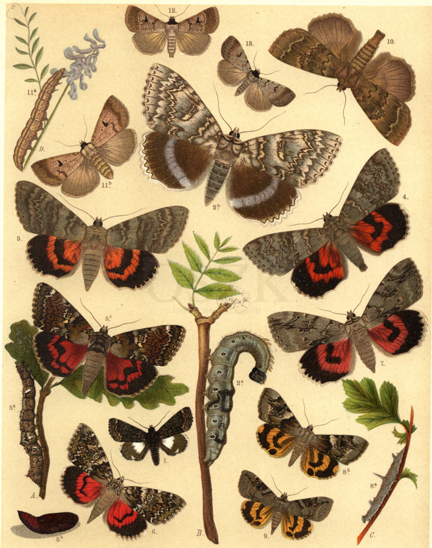
1. Catephia Alchymista . — 2 a. b. Catocala Fraxini . — 3. Cat. Elocata . — 4. Cat. Nupta . — 5 a. b. c. Cat. Sponsa . — 6. Cat. Promissa . — 7. Cat. Electa . — 8 a. b. Cat. Fulminea . — 9. Cat. Hymenaea . — 10. Apopestes Spectrum . — 11 a. b. Toxocampa Lusoria . — 12. Tox. Pastinum . — 13. Tox. Cracca .