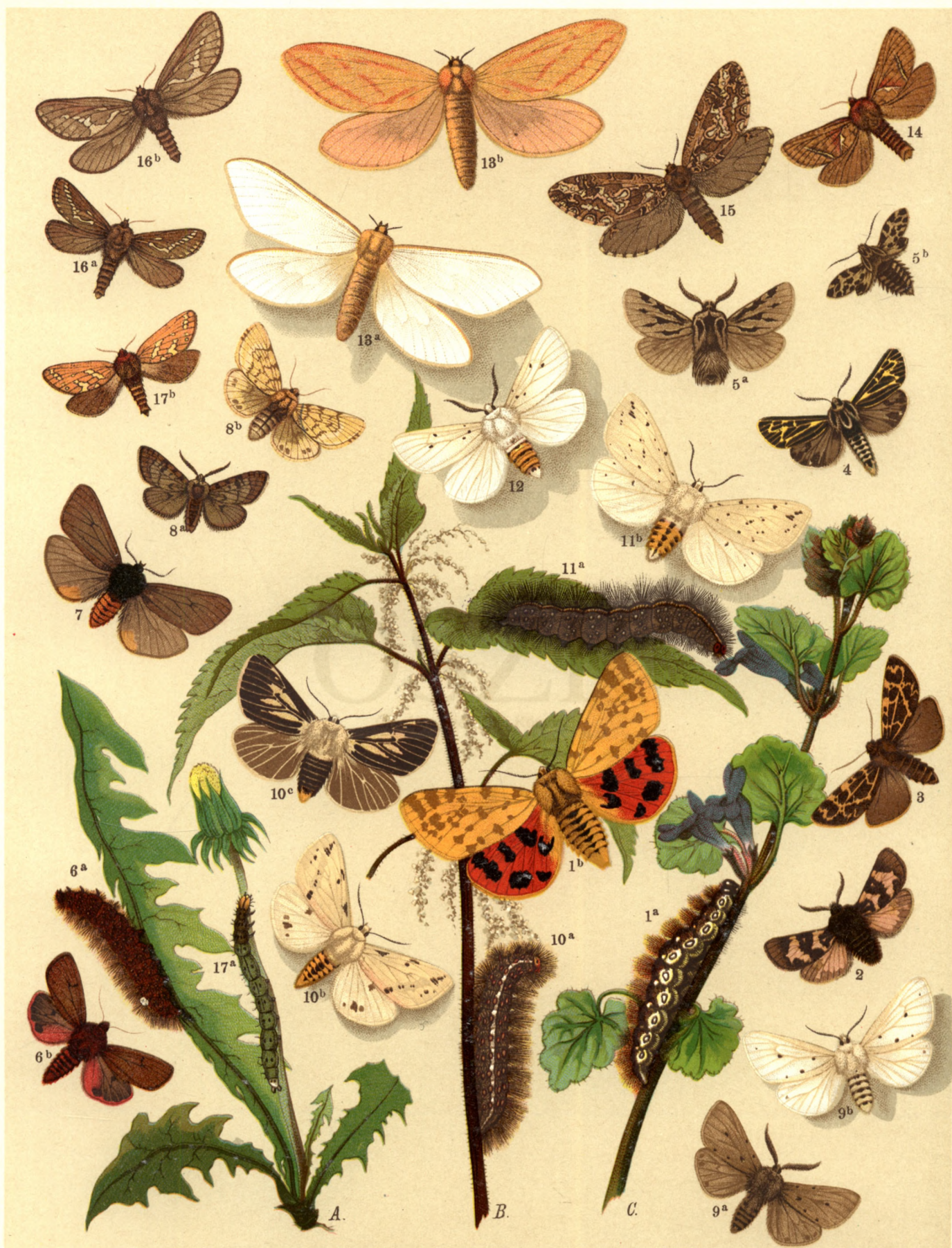
1 a. b. Arctia Purpurata . — 2. Arctia Casta . — 3. Arctia Cervina . — 4. Arctia Quenselii . — 5 a. b. Ocnogyna Parasita . 6 a. b. Spilosoma Fuliginosa . — 7. Spil. Luctifera . — 8 a. ♂, b. ♀ Spil. Sordida . — 9 a. ♂, b. ♀ Spil. Mendica . 10 a. b. Spil. Lubricipeda , c. var. Zatima . — 11 a. b. Spil. Menthastri . — 12. Spil. Urticae . — 13 a. ♂, b. ♀ Hepialus Humuli . — 14. Hep. Sylvina . — 15. Hep. fusconebulosa . — 16 a. ♂, b. ♀ Hep. Lupulina . 17 a. b. Hep. Hecta .