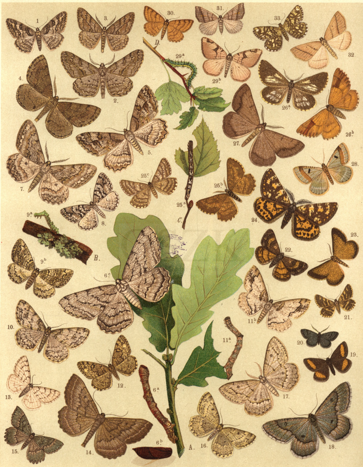
1. Boarmia Cinctaria . — 2. B. Gemmaria . — 3. B. Secundaria . — 4. B. Ribeata . — 5. B. Repandata . — 6a. b. c. B. Roboraria . — 7. B. Consortaria . — 8. B. Angularia . — 9a. b. B. Lichenaria . — 10. B. Crepuscularia . — 11a. b. B. Consonaria . — 12. B. Luridata . — 13. B. Punctularia . — 14. Gnophos Furvata . — 15. Gn. Obscuraria . — 16. Gn. Glaucinaria . — 17. Gn. Dilucidaria . — 18. Gn. Myrtilata . — 19. Psodos Quadrifaria . — 20. Pygmaena fusca . — 21. Fidonia Fasciolaria . — 22. F. Famula . — 23. F. Roraria . — 24. Eurranthis Plumistaria . — 25a. b. c. Ematurga Atomaria . — 26a. b. Bupalus Piniarius . — 27. Selidosema Ericetaria . — 28. Thamnonoma Vincularia . — 29a. b. Th. Wauaria . — 30. Th. Brunneata . — 31. Diastictis Artesiaria . — 32. Phasiane Petraria . — 33. Ph. Clathrata .