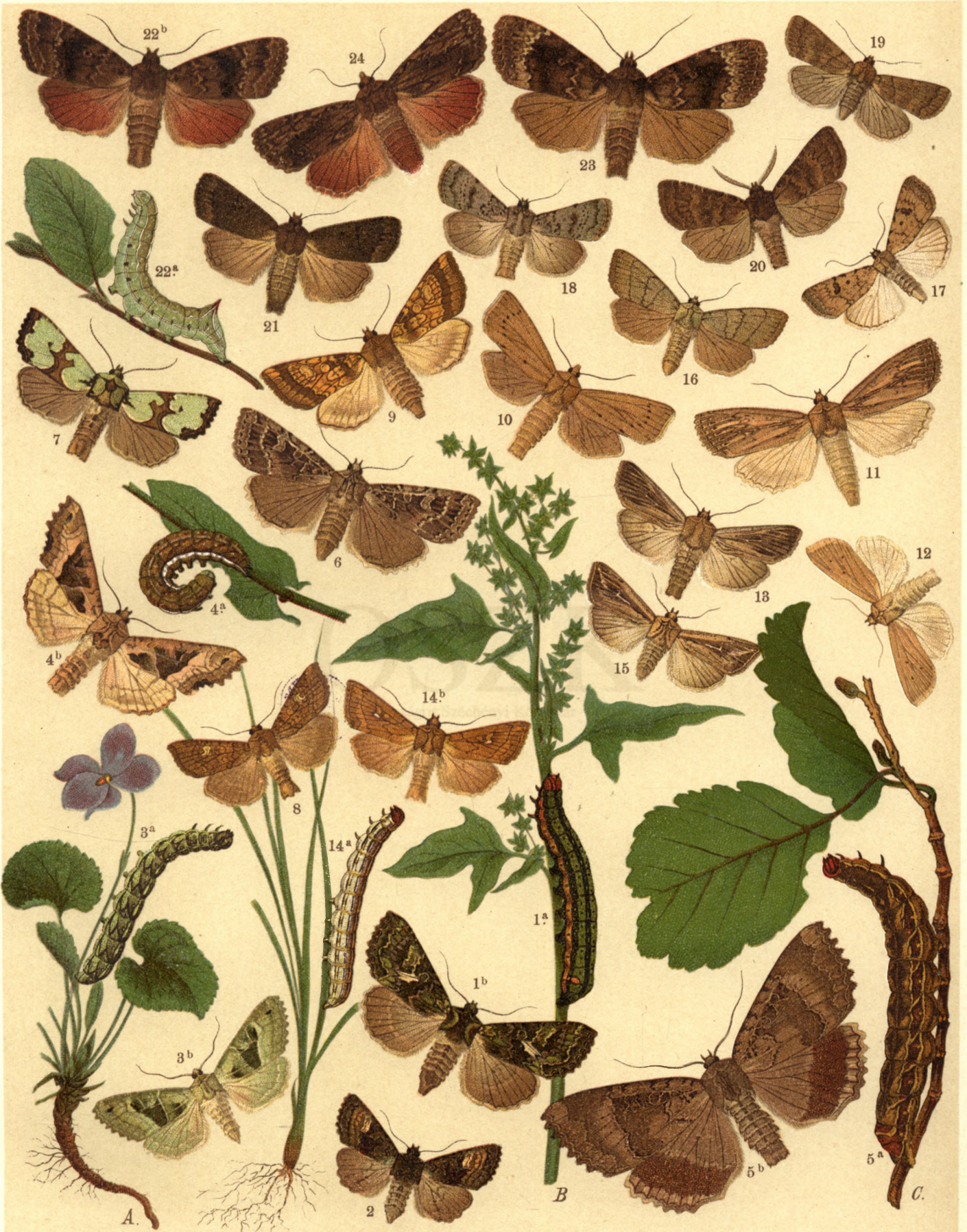
1 a. b. Trachea Atriplicis . — 2. Euplexia Lucipara . — 3 a. b. Phlogophora Scita . — 4 a. b. Brotolomia Meticulosa . 5 a. b. Mania Maura . — 6. Naenia Typica . — 7. Jaspidea Celsia . — 8. Hydroecia Nictitans . — 9. Gortyna Ochracea . 10. Nonagra Cannae . — 11. Non. Typhae . — 12. Leucania Pallens . — 13. Leuc. Comma . — 14 a. b. Leuc. conigera . 15. Leuc. Lalbum . — 16. Grammesia Trigrammica . — 17. Caradrina Quadripunctata . — 18. Car. Respersa . — 19. Car. Alsines . — 20. Rusina umbratica . — 21. Amphipyra Tragopoginis . — 22 a. b. A. Pyramidea . — 23. A. Perflua . 24. A. Cinnamomea .