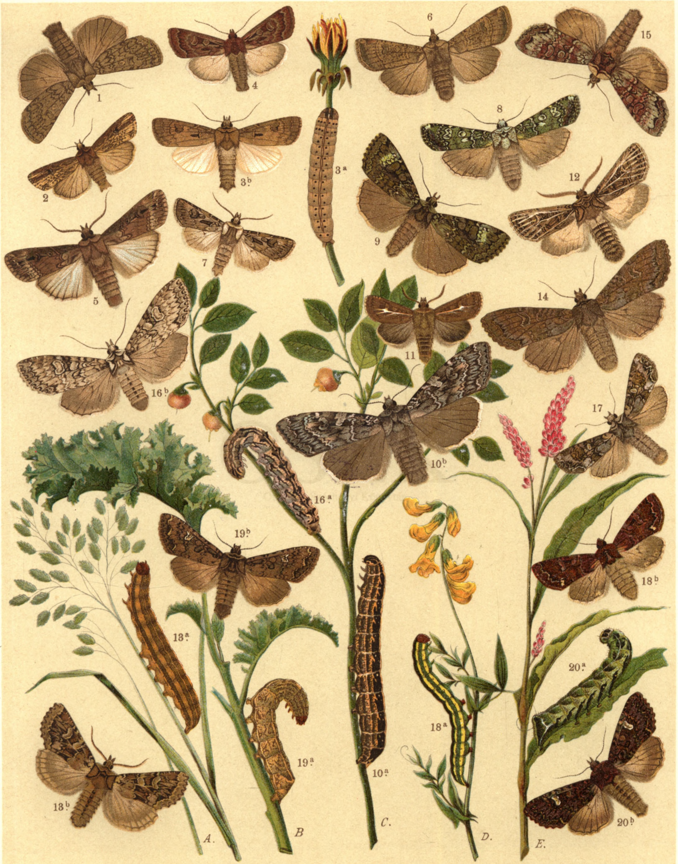
1. Agrotis Simulans . — 2. A. Putris . — 3 a. b. A. Exclamationis . — 4. A. Tritici . — 5. A. Ypsilon . — 6. A. Segetum . 7. A. Vestigialis . — 8. A. Praecox . — 9. A. Prasina . — 10 a. b. A. Occulta . — 11. Charaeas Graminis . — 12. Epineuronia Popularis . — 13 a. b. Mamestra Leucophaea . — 14. M. Advena . — 15. M. Tincta . — 16 a. b. M. Nebulosa . 17. M. Contigua . — 18 a. b. M. Pisi . — 19 a. b. M. Brassicae . — 20 a. b. M. Persicariae .