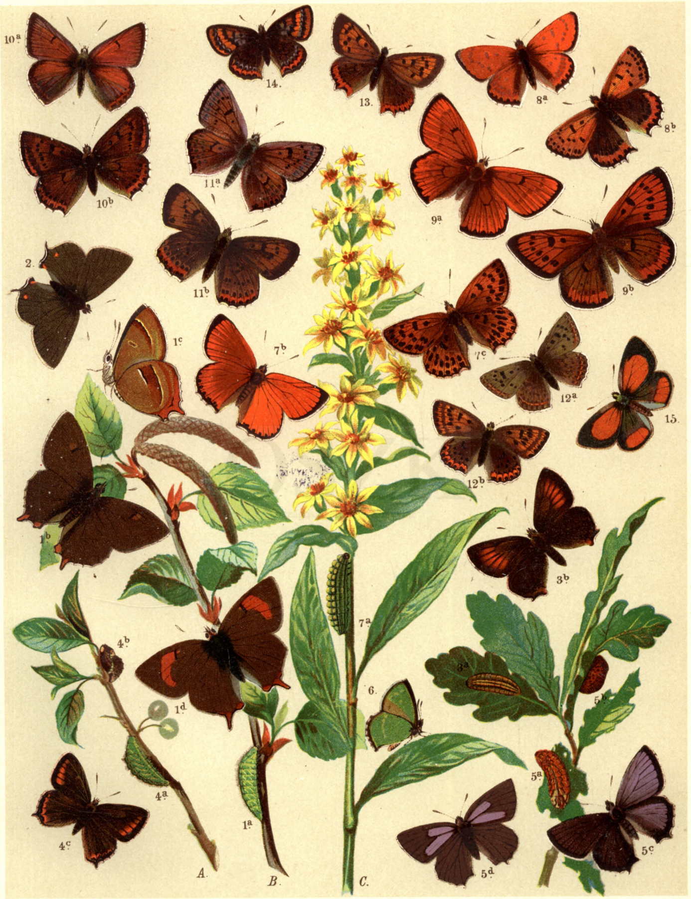
1 a. b. c. ♂ d. ♀ Zephyrus Betulae. — 2. Thecla Spini. — 3 a. b. Th. Ilicis. — 4 a. b. c. Th. Pruni. — 5 a. b. c. ♂ d. ♀ Zephyrus Quercus. — 6. Callophrys Rubi. — 7 a. b. ♂ c. ♀ Chrysophanus Virgaureae. — 8 a. ♂ b. ♀ Chrys. Thersamon. — 9 a. ♂ b. ♀ Chrys. Dispar. — 10 a. ♂ b. ♀ Chrys. Hippothoë — 11 a. ♂ b. ♀ Chrys. Alciphron. — 12 a. ♂ b. ♀ Chrys. Dorilis. — 13. Chrys. Phlaeas. — 14. Chrys. Amphidamas. — 15. Thestor Ballus.