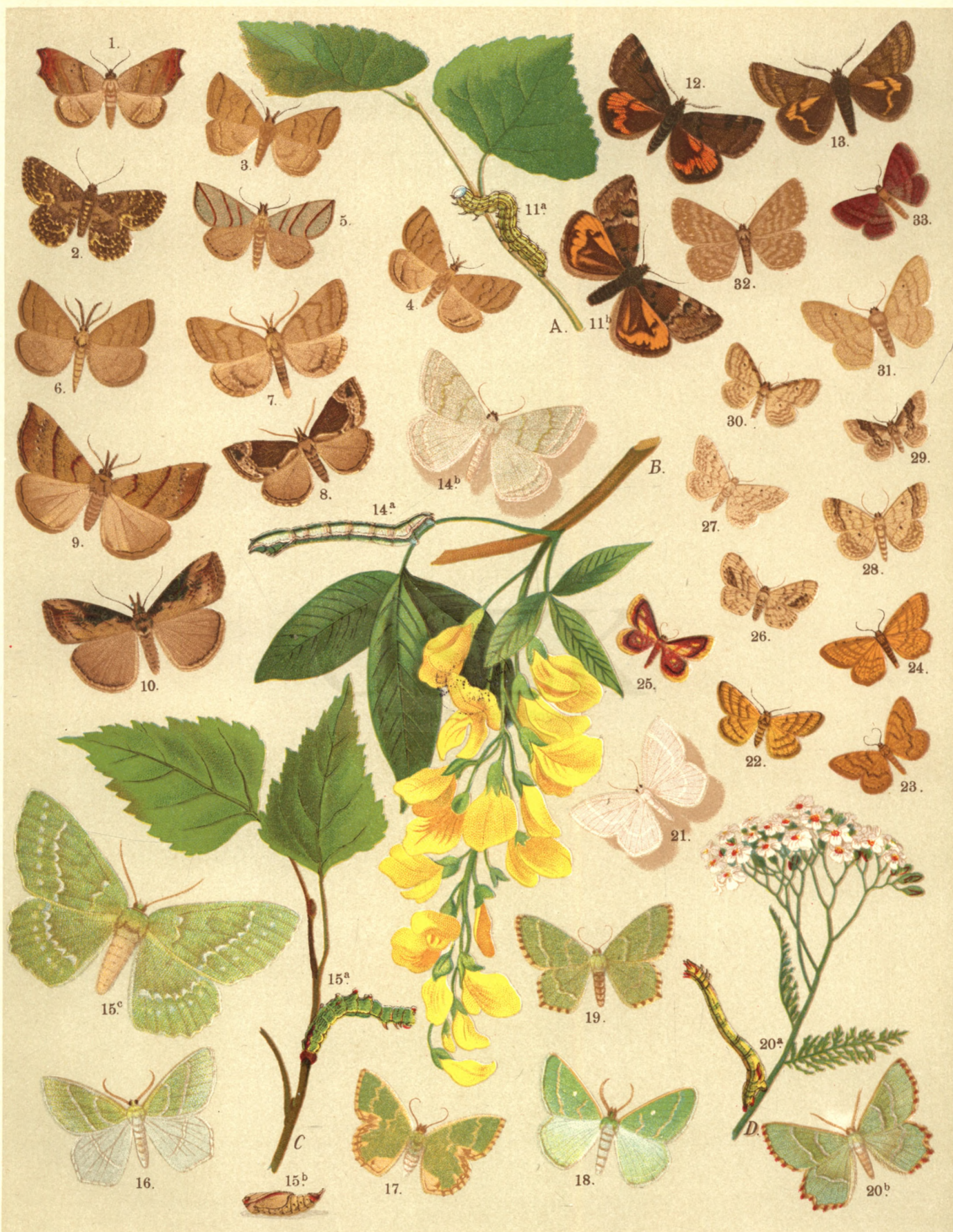
1. Laspeyria Flexula . — 2. Parascotia Fuliginaria . — 3. Zanclognata Grisealis . — 4. Z. Tarsicrinalis . — 5. Madopa Saicalis . — 6. Herminia Tentacularia . — 7. Pechipogon Barbalis . — 8. Bomolocha Fontis . — 9. Hypena Proboscidalis . — 10. Hyp. Obesalis . — 11 a. b. Brephos Parthenias . — 12. Br. Nothum . — 13. Br. Puella . — 14 a. b. Pseudoterpna Pruinata . — 15 a. b. c. Geometra Papilionaria . — 16. G. Vernaria . — 17. Euchloris Pustulata . — 18. Euchl. Smaragdaria . — 19. Hemithea Strigata . — 20 a. b. Thalera Fimbriatis . — 21. Th. Lactearia . — 22. Acidalia Trilineata . — 23. Ac. Similata . — 24. Ac. Ochrata . — 25. Ac. Muricata . — 26. Ac. Dimidiata . — 27. Ac. Virgularia . — 28. Ac. Bisetata . — 29. Ac. Rusticata . — 30. Ac. Humiliata . — 31. Ac. Aversata . — 32. Ac. Immerata . — 33. Ac. Rubiginata .