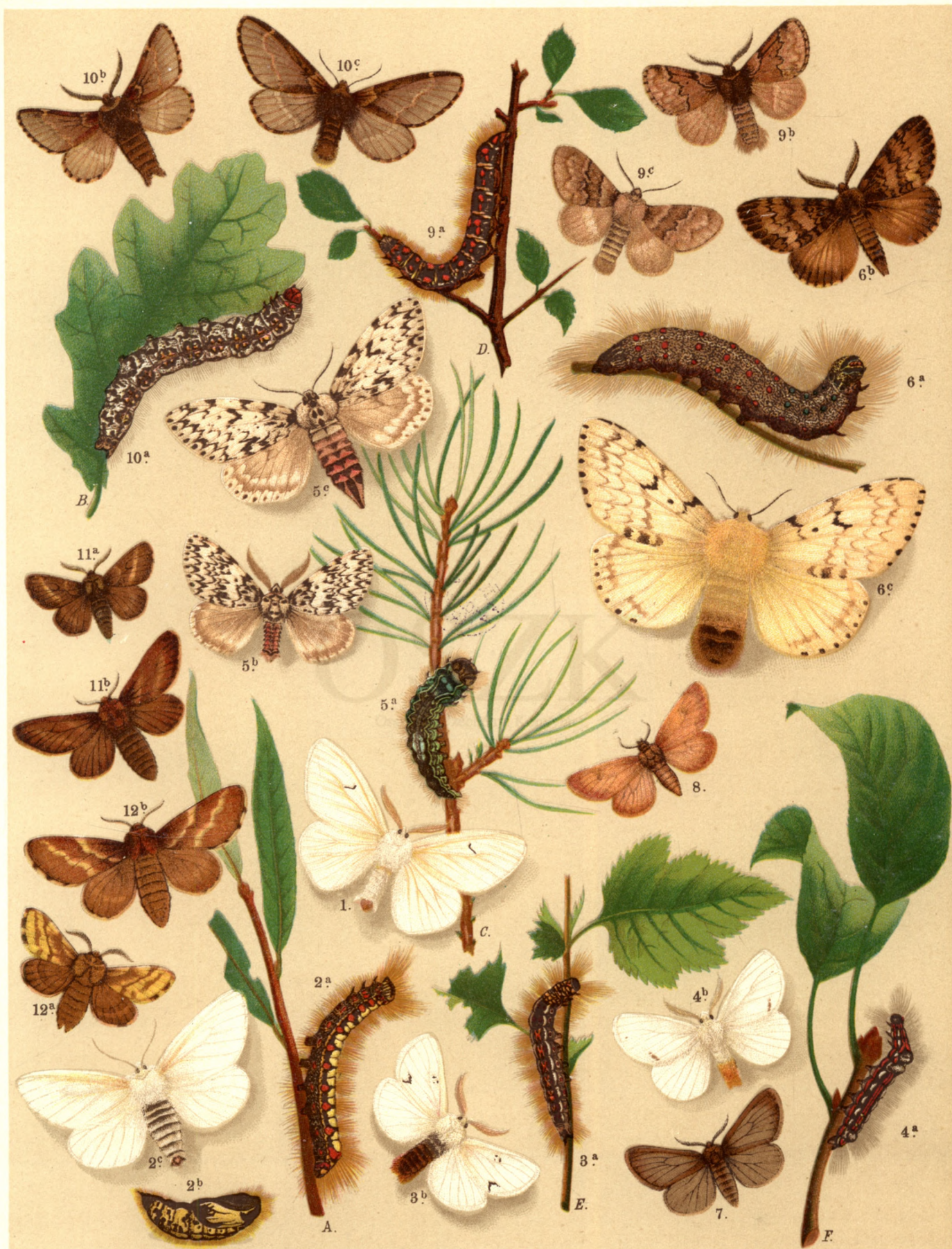
1. Arctornis L. nigrum . — 2 a. b. c. Stilpnotia Salicis . — 3 a. b. Porthesia Chrysorrhoea . — 4 a. b. Porth. Similis . 5 a. b. ♂, c. ♀ Lymantria Monacha . — 6 a. b. ♂, c. ♀ Lym. Dispar . — 7. Ocneria Detrita . — 8. Ocneria Rubea . 9 a. b. ♂, c. ♀ Trichiura Crataegi . — 10. a. b. ♂, c. ♀ Poecilocampa Populi . — 11 a. ♂, b. ♀ Malcosoma Franconica . 12 a. ♂, b. ♀ Mal. Castrensis .