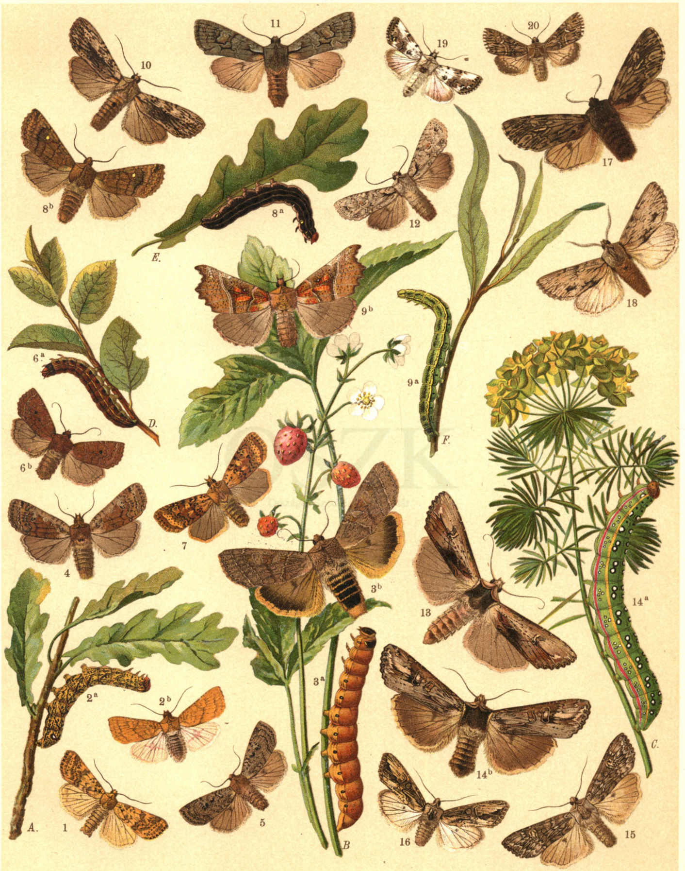
1. Xanthia Gilvago . — 2 a. b. Hoplorina Croceago . — 3 a. b. Orrhodia Fragariae . — 4. O. Erythrocephala . — 5. O. Vau punctatum . — 6 a. b. O. Vaccinii . — 7. O. Rubiginea . — 8 a. b. Scopelosoma Satellitia . — 9 a. b. Scoliopteryx Libatrix . — 10. Xylina Socia . — 11. X. Furcifera . — 12. X. Ornithopus . — 13. Calocampa Vetusta . — 14 a. b. Cal. Exoleta . — 15. Cal. Solidaginis . — 16. Xylomyges Conspicillaris . — 17. Brachionycha Nubeculosus . — 18. Brach. Sphinx . — 19. Calophasia Casta . — 20. Caloph. Lunula .