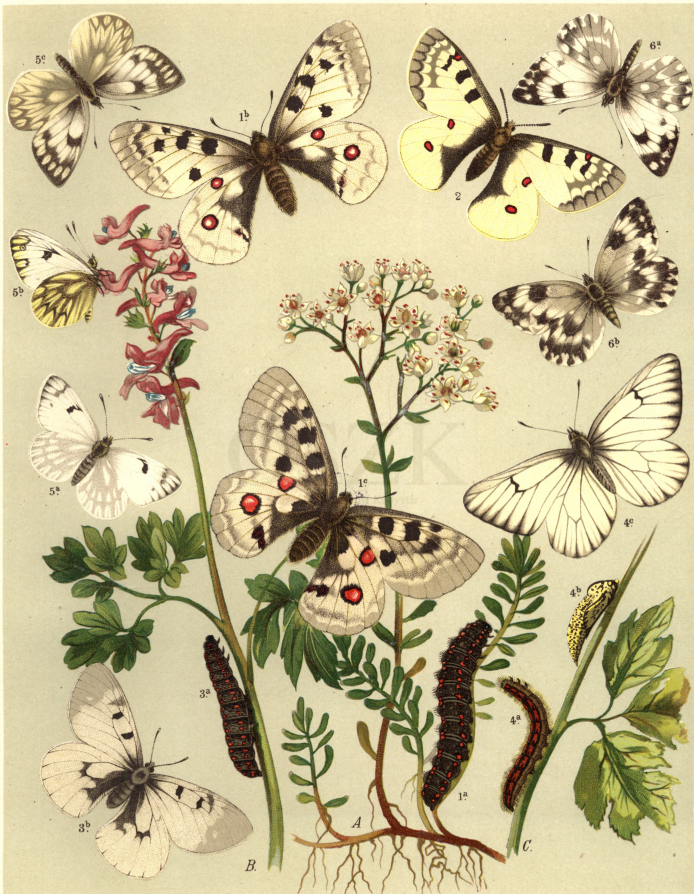
1 a. b. ♂ c. ♀ Parnassius Apollo . — 2. Parn. Delius . — 3 a. b. Parn. Mnemosyne . — 4 a. b. c. Aporia Crataegi . 5 a. b. ♂ c. ♀ Pieris Callidice . — 6 a. ♂ b. ♀ Pier. Daphidice .