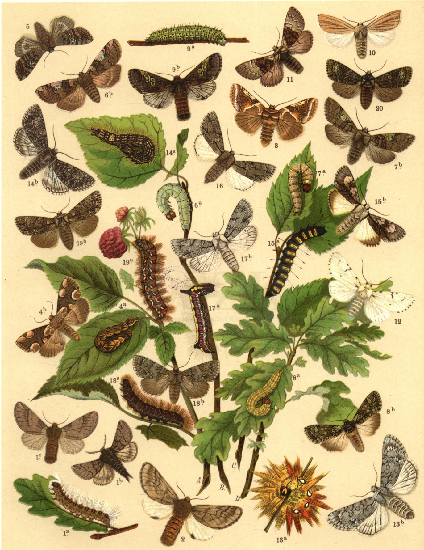
1 a. b. c. Thaumetopoea Processionea . — 2. Thaum. Pityocampa . — 3. Habrosyne Derasa . — 4 a. b. Thyatira Batis . 5. Cymatophora octogesima . — 6 a. b. Cym. Or. — 7 a. b. Polyphoca Flavicornis . — 8 a. b. Polypl. Ridens . 9 a. b. Diloba caeruleocephala . — 10. Arsilonche Albovenosa . — 11. Demas Coryli . — 12. Acronycta Leporina . 13 a. b. Acr. Aceris . — 14 a. b. Acr. Megacephala . — 15 a. b. Acr. Alni . — 16. Acr. Tridens . 17 a. b. Acr. Psi . — 18 a. b. Acr. Auricoma . — 19 a. b. Acr. Rumicis . — 20. Acr. Ligustri .