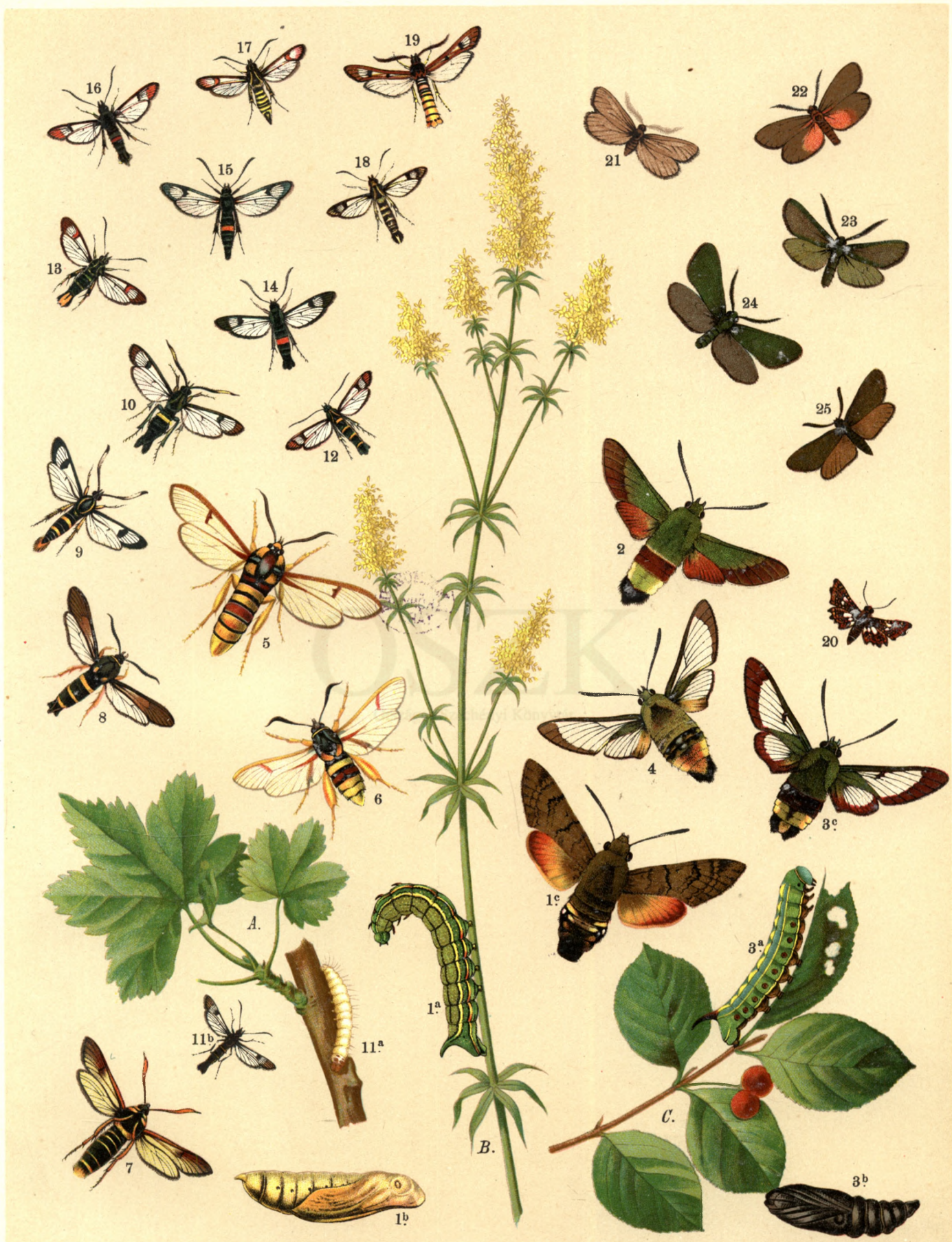
1 a. b. c. Macroglossa Stellatarum . 2. Macr. Croatica . 3 a. b. c. Hemaris Bombyliformis . 4. Hem. Scabiosae . 5. Trochilium Apiforme . 6. Troch. Crabroniforme . 7. Troch. Melanocephalum . 8. Sciapteron Tabaniforme . 9. Sesia Scoliiformis . 10. S. Spheciformis . 11 a. b. S. Tipuliformis . 12. S. Conopiformis . 13. S. vespiformis . 14. S. Myopiformis . 15. S. Culiiformis . 16. S. Formiciformis . 17. S. Ichneumoniformis . 18. S. Empiformis . 19. Bembecia Hylaeiformis . 20. Thyris Fenestrella . 21. Heterogynis Penella . 22. Aglaope Infausta . 23. Ino Pruni . 24. Ino Globulariae . 25. Ino Statices .