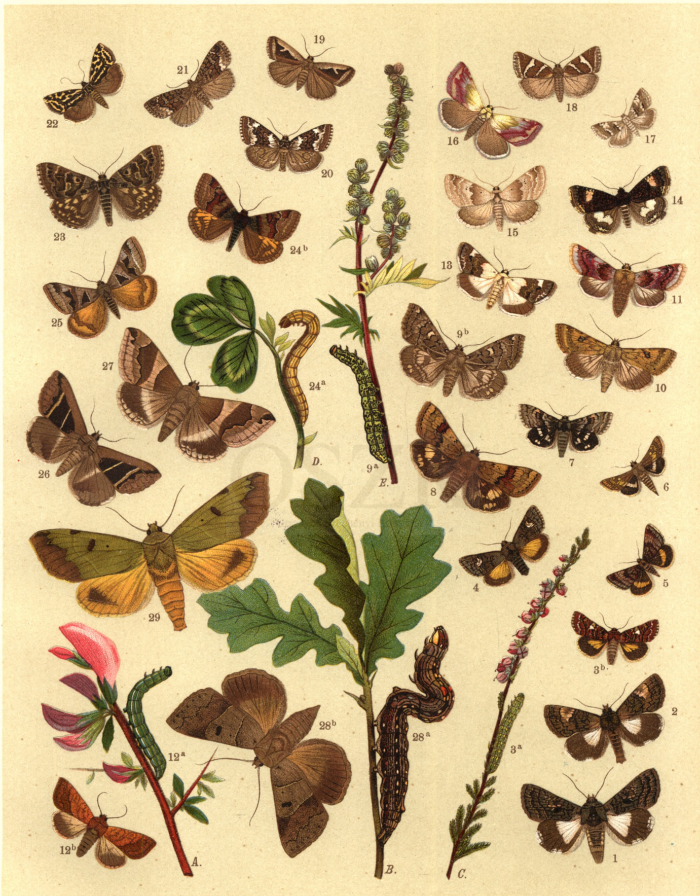
1. Anoplia Leucomelas . — 2. Aedia Funesta . — 3 a. b. Anarta Myrtilli . — 4. A. Cordigera . — 5. Heliaca Tenebrata . — 6. Heliopsis Cardui . — 7. H. Ononidis . — 8. H. Dipsacea . — 9 a. b. H. Scutosa . — 10. H. Peltigera . — 11. Chariclea Delphinii . — 12 a. b. Pyrrhia Umbra . — 13. Acontia Lucida . — 14. Ac. Luctuosa . — 15. Thalpocharis Respersa . — 16. Th. Purpurina . — 17. Th. Paula . — 18. Erastria Argentula . — 19. E. Uncula . — 20. E. Deceptoria . — 21. E. Fasciana . — 22. Emmelia Trabealis . — 23. Euclidia Mi. — 24 a. b. Eucl. Glyphica . — 25. Eucl. Triquetra . — 26. Grammodes Bifasciata . — 27. Gr. geometrica . — 28 a. b. Pseudophia Lunaris . — 29. Ps. Tirrhaea .