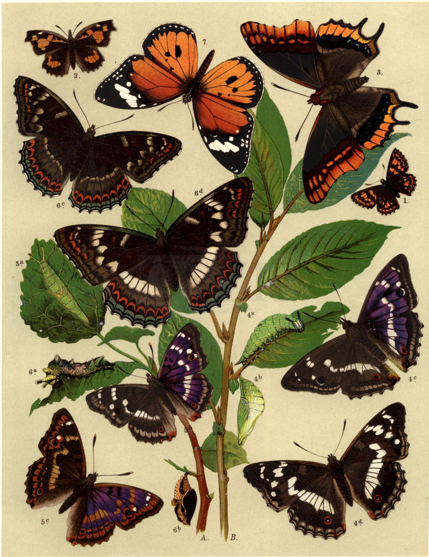
1. Nemeobius Lucina. — 2. Libythea Celtis. — 3. Charaxes Jasius. — 4 a. b. c. ♂ d. ♀ Apatura Iris. 5 a. b. ♂ Apat. Ilia. — 5 c. Apat. Ilia, var. Clytie. — 6 a. b. c. ♂ d. ♀ Limnitis Populi. — 7. Danais Chrysippus.