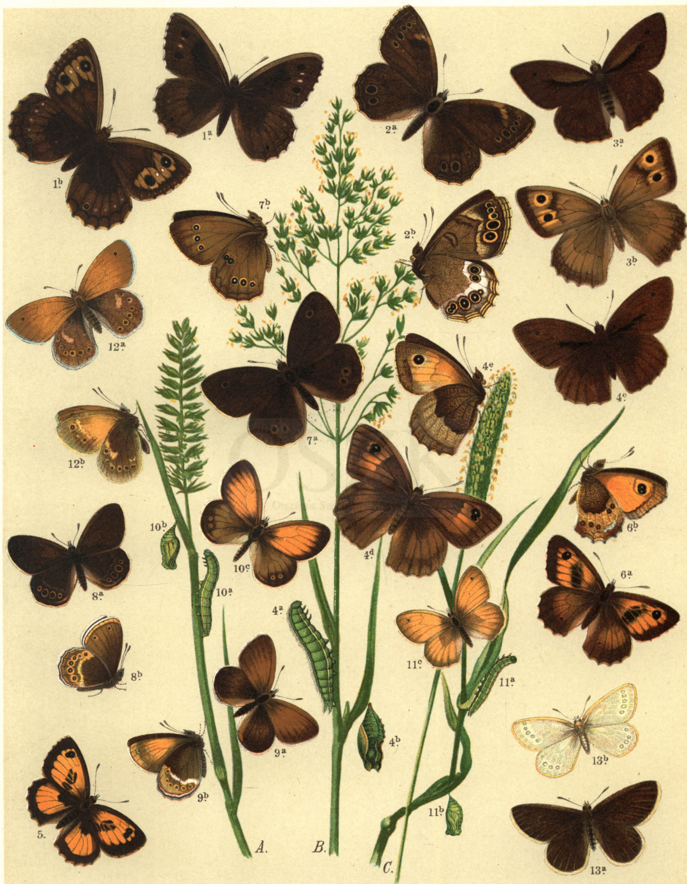
1 a. ♂ b. ♀ Satyrus Stalinius . 2 a. b. Pararge Achine . 3 a. ♂ b. ♀ Epinephele Lycaon . 4 a. b. c. ♂ d. e. ♀ Epin. Jurtina . 5. Epin. Ida . 6 a. b. Epin. Tithonus . 7 a. b. Aphantopus Hyperanthus . 8 a. b. Coenonympha Hero . 9 a. b. Coenon. Iphis . 10 a. b. c. Coen. Arcania . 11 a. b. c. Coen. Pamphilus . 12 a. b. Coen. Tiphon . 13 a. ♂ b. ♀ Triphysa Phryne .