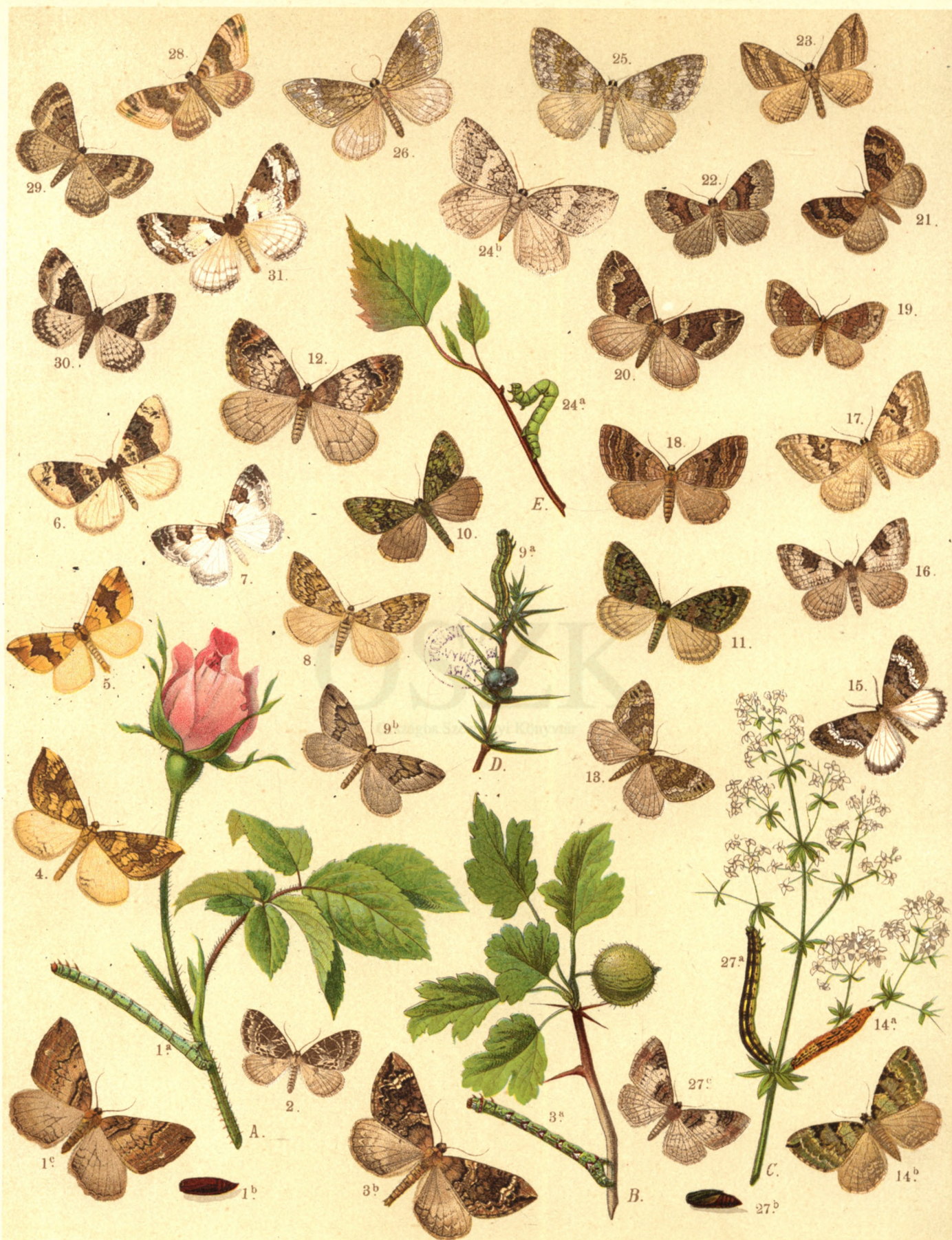
1 a. b. c. Larentia Badiata . — 2. Lygris Reticulata . — 3 a. b. L. Prunata . — 4. L. Populata . — 5. Larentia Fulvata . — 6. Lar. Ocellata . — 7. Lar. Bicolorata . — 8. Lar. Variata . — 9 a. b. Lar. Juniperata . — 10. Lar. Siterata . — 11. Lar. Miata . — 12. Lar. Truncata . — 13. Lar. Olivata . — 14 a. b. Lar. Viridaria . — 15. Lar. Turbata . — 16. Lar. Fluctuata . — 17. Lar. Montanata . — 18. Lar. Quadrifasciaria . — 19. Lar. Ferrugata . — 20. Lar. Suffumata . — 21. Lar. Pomoeriaria . — 22. Lar. Designata . — 23. Lar. Vittata . — 24. a. b. Lar. Dilutata . — 25. Lar. Caesiata . — 26. Lar. Tophaceata . — 27 a. b. c. Lar. Cucullata . — 28. Lar. Galiata . — 29. Lar. Sociata . — 30. Lar. Unangulata . — 31. Lar. Procellata .