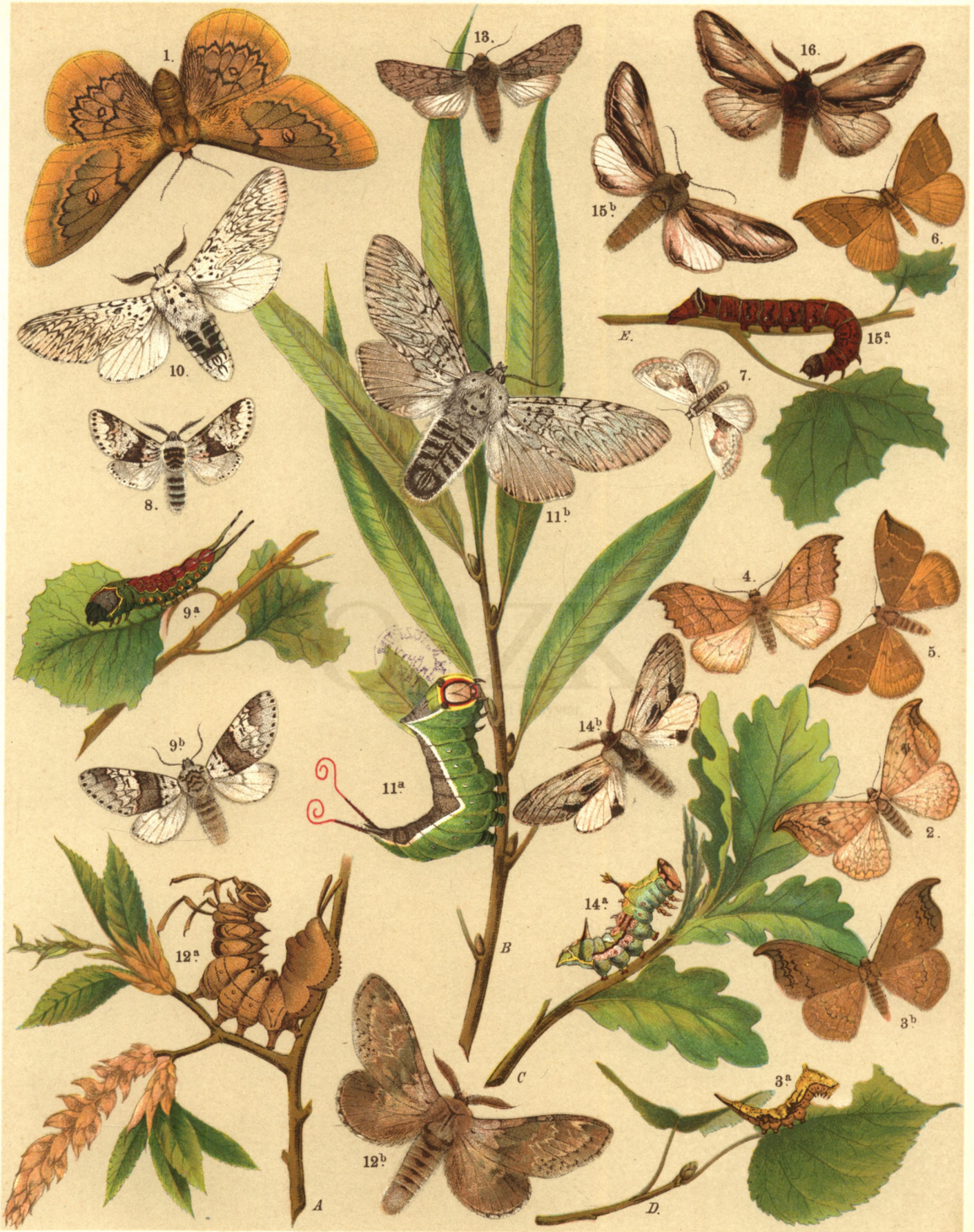
1. Perisomena Caecigena . — 2. Drepana Falcataria . — 3 a. b. Drep. Harpagula . — 4. Drep. Lacertinaria . — 5. Drep. Binaria . — 6. Drep. Cultraria . — 7. Cilix Glaucata . — 8. Cerura Bicuspis . — 9 a. b. Cer. Bifida . — 10. Dicranura Erminea . 11 a. b. Dicr. Vinula . — 12 a. b. Stauropus Fagi . — 13. Exaereta Ulmi . — 14 a. b. Hoplitis Milhauseri . — 15 a. b. Theosia Tremula . — 16. Theosia Dictaeoides .