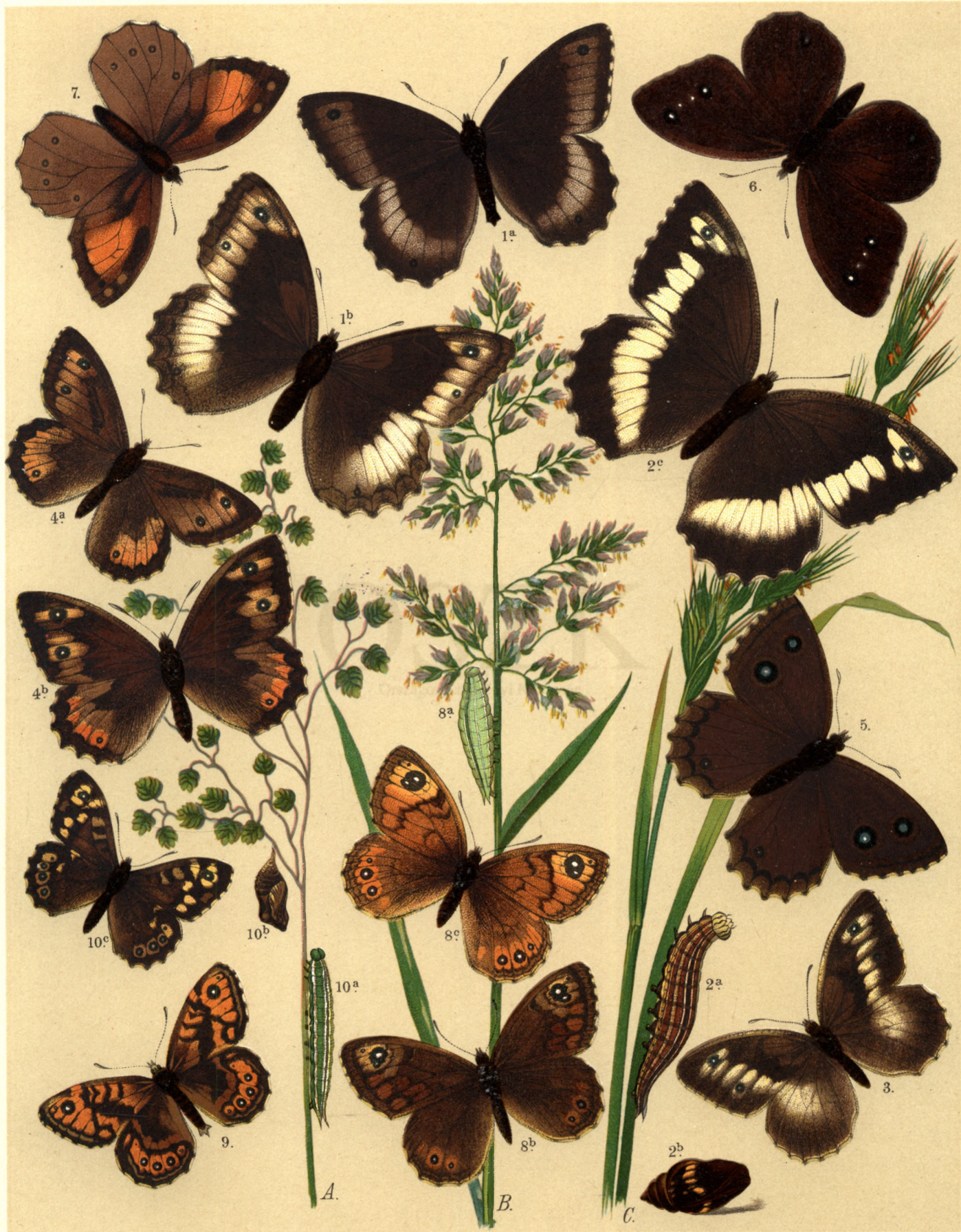
1 a. ♂ b. ♀ Satyrus Hermione. 2 a. b. c. Sat. Circe. 3. Sat. Briseis. 4 a. ♂ b. ♀ Sat. Semele. 5. Sat. Dryas. 6. Sat. Actaea. 7. Pararge Roxelana. 8 a. b. ♂ c. ♀ Par. Maera. 9. Par. Megaera. 10 a. b. c. Par. Aegeria.