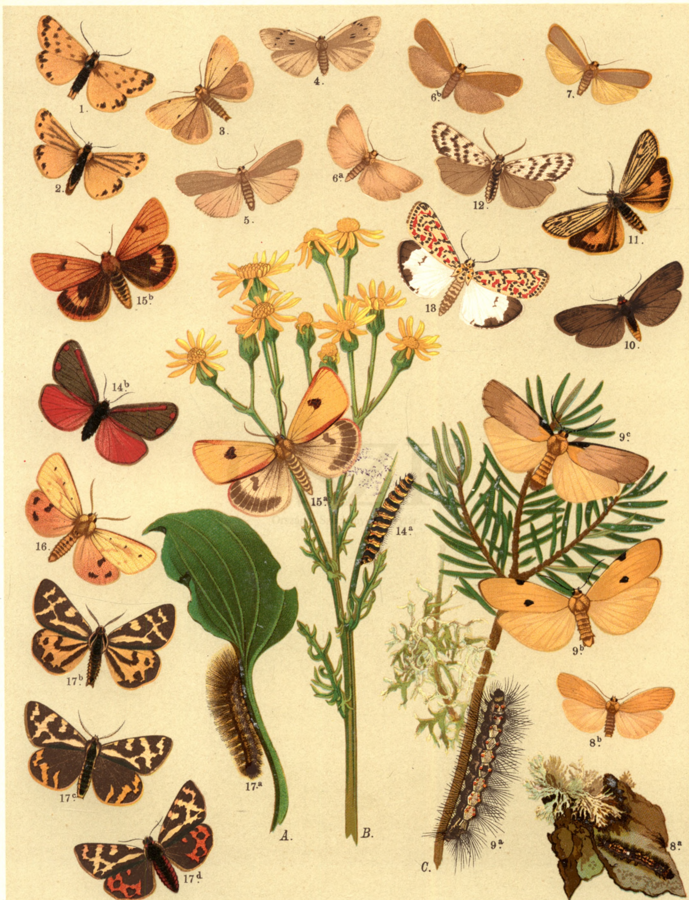
1. Endrosa Aurita . — 2. Endr. Aurita , var. Ramosa . — 3. Endr. Mesomella . — 4. Lithosia Muscerda . — 5. Lith. Griseola . 6 a. ♂, b. ♀ Lith. Deplana . — 7. Lith. Complana . — 8 a. b. Lith. Sororecula . — 9 a. b. ♀, c. ♂ Gnophria Quadra . 10. Gu. Rubricollis . — 11. Coscinia Striata . — 12. Cosc. Cribrum . — 13. Deiopeia Pulchella . — 14 a. b. Hypocrita Jacobaeae . — 15 a. ♂, b. ♀ Nemeophila Russula . — 16. Nem. Metelkana . — 17. a. b. c. ♂, d. ♀ Nem. Plantaginis .