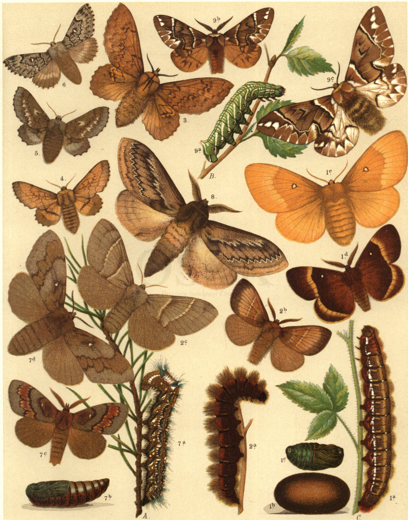
1 a. b. c. d. ♂, e. ♀ Bombyx Quercus . — 2 a. b. ♂, c. ♀ Macrothylacia Rubi . — 3. Gastropacha Populifolia . / 4. Epinaptera Tremulifolia . — 5. Ep. Ilicifolia . — 6. Selenephra Lunigera . — 7 a. b. c. ♂, d. ♀ Dendrolimus Pini . 8. Pachypara Otus . — 9 a. b. ♂, c. ♀ Endromis Versicolora .