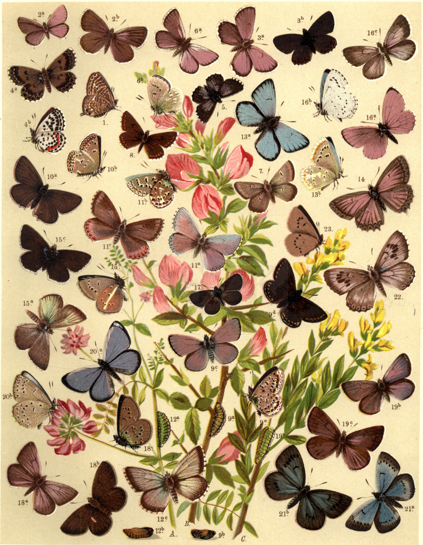
1. Lampides Telicæus. — 2 a. b. Lycaena Argiades. — 3 a. ♂ b. ♀ L. Argyrognomon. — 4 a. b. L. Orion. — 5. L. Baton. 6 a. b. L. Pheretes. — 7. L. Orbitulus. — 8. L. Astrarche. — 9 a. b. c. ♂ d. e. ♀ L. Icarus. — 10 a. b. L. Eumedon. — 11 a. b. ♂ c. ♀ L. Bellargus. — 12 a. b. c. L. Corydon. — 13 a. b. ♂ L. Hylas. — 14. L. Meleager ♀. — 15 a. b. ♂ c. ♀ L. Damon. — 16 a. b. ♂ c. ♀ Cyaniris Argiolus. — 17. Lycaena Minima. — 18 a. ♂ b. c. ♀ L. Semiargus. — 19 a. b. ♂ c. ♀ L. Cyllarus. — 20 a. b. L. Alcon ♂. — 21 a. ♂ b. ♀ L. Euphemus. — 22. L. Arion. — 23. L. Arcas.