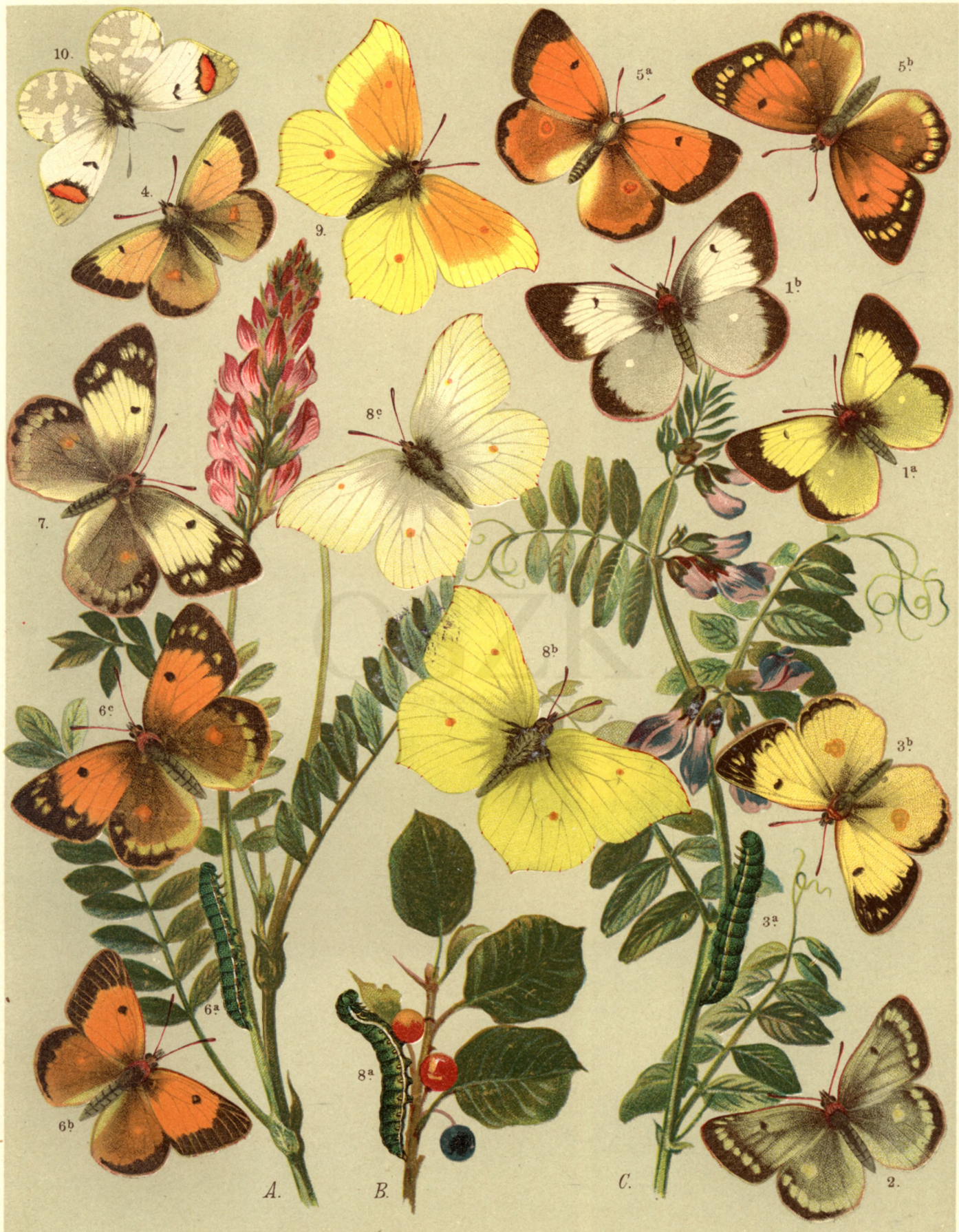
1 a. ♂ b. ♀ Colias Palaeno . — 2. Col. Phicomone . — 3 a. b. Col. Hyale . — 4. Col. Chrysotheme . 5 a. ♂ b. ♀ Col. Myrmidone . — 6 a. b. ♂ c. ♀ Col. Edusa . — 7. Col. Edusa , var. Helice . — 8 a. b. ♂ c. ♀ Gonopteryx Rhamni . 9. Gonopt. Cleopatra . — 10. Zegris Eupheme .