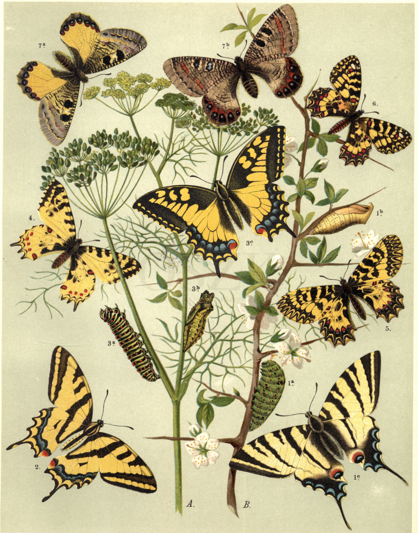
1 a. b. c. Papilio Podalirius . — 2. Pap. Alexanor . — 3 a. b. c. Pap. Machaon . — 4. Thais Cerisyi . — 5. Th. Polyxena . — 6. Th. Rumina . — 7 a. ♂ b. ♀ Doritis Apollinus .