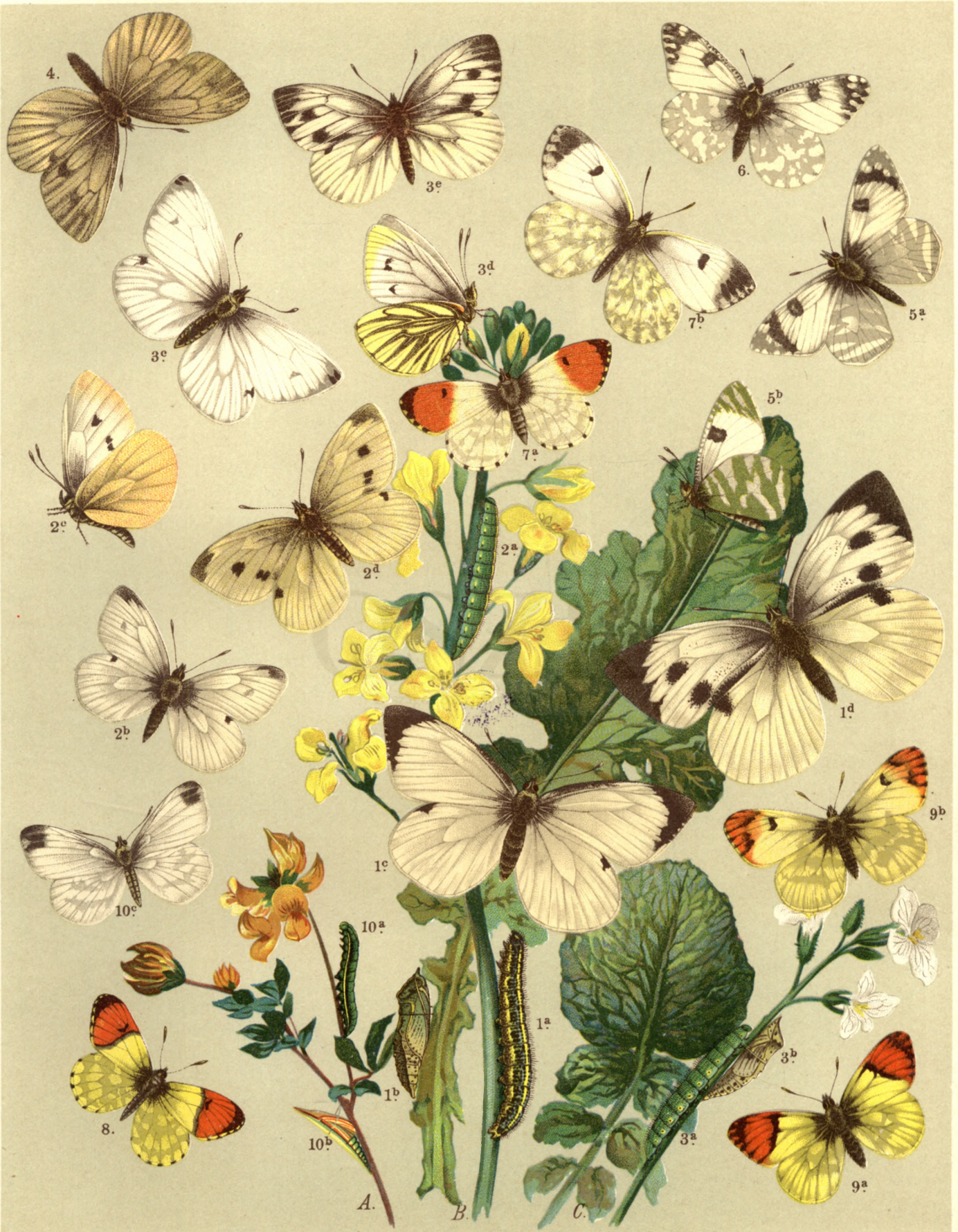
1 a. b. c. ♂ d. ♀ Pieris Brassicae. — 2 a. b. c. ♂ d. ♀ Pier. Rapae. — 3 a. b. c. d. ♂ e. ♀ Pier. Napi. 4. Pier. Napi, var. Bryoniae. — 5 a. b. Euchloë Belemia. — 6. Euch. Belia. — 7 a. ♂ b. ♀ Euch. Cardamines. 8. Euch. Damone. — 9 a. ♂ b. ♀ Euch. Eupheno. — 10 a. b. c. Leptidia Sinapis.