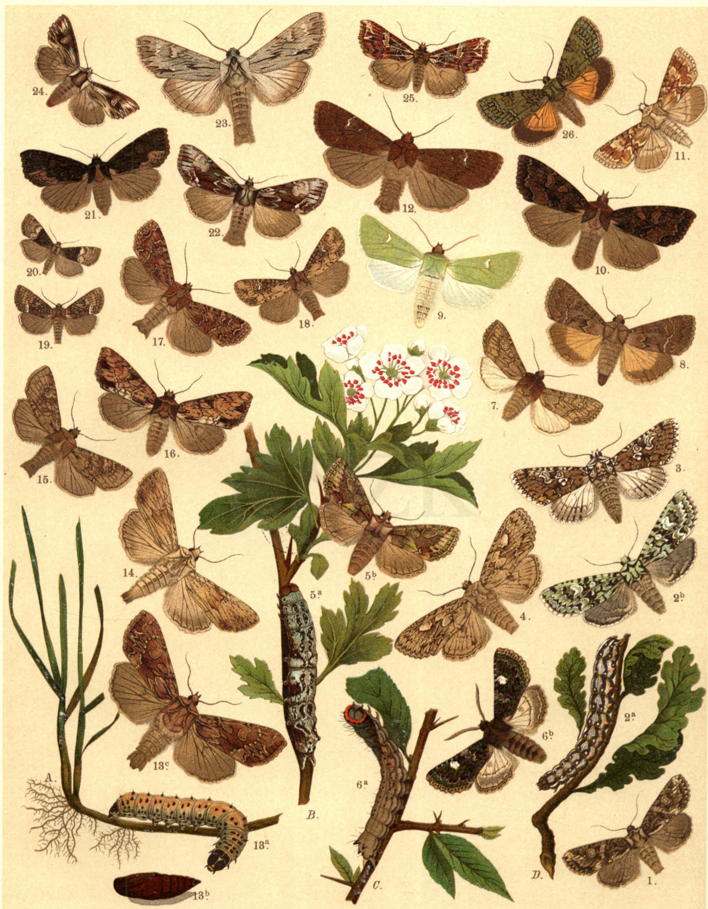
1. Dryobota Protea . — 2 a. b. Dichonia Aprilina . — 3. Chariptera Viridana . — 4. Miselia Bimaculosa . — 5 a. b. Mis. Oxycanthae . — 6 a. b. Valeria Oleagina . — 7. Apamea Testacea . — 8. Luperina Matura . — 9. Lup. Virens . — 10. Hadena Porphyrea . — 11. H. Ochroleuca . — 12. H. Lateritia . — 13 a. b. c. H. Monoglypha . — 14. H. Lithoxylea . — 15. H. Basilinea . — 16. H. Rurea . — 17. H. Gemina . — 18. H. secalis . — 19. H. Strigilis . — 20. H. Bicoloria . — 21. Dipterygia Scabriuscula . — 22. Hyppa Rectilinea . — 23. Rhizogramma Detersa . — 24. Chloantha Polyodon . — 25. Callopietria Purpureofasciata . — 26. Polyphaenis Sericata .