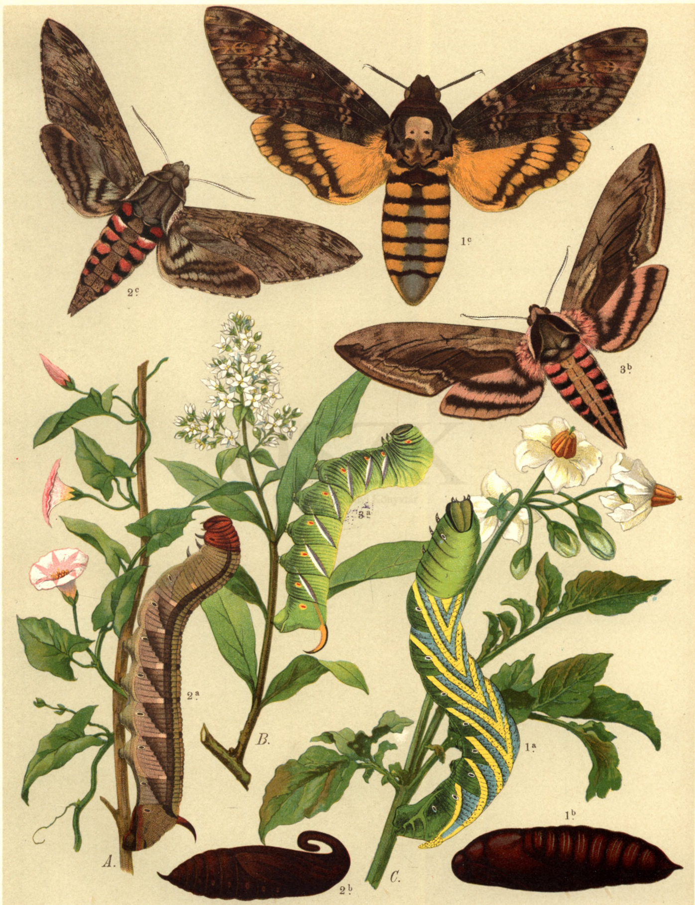
1 a. b. c. Acherontia atropos . — 2 a. b. c. Sphinx convolvuli . — 3 a. b. Sph. ligustri .