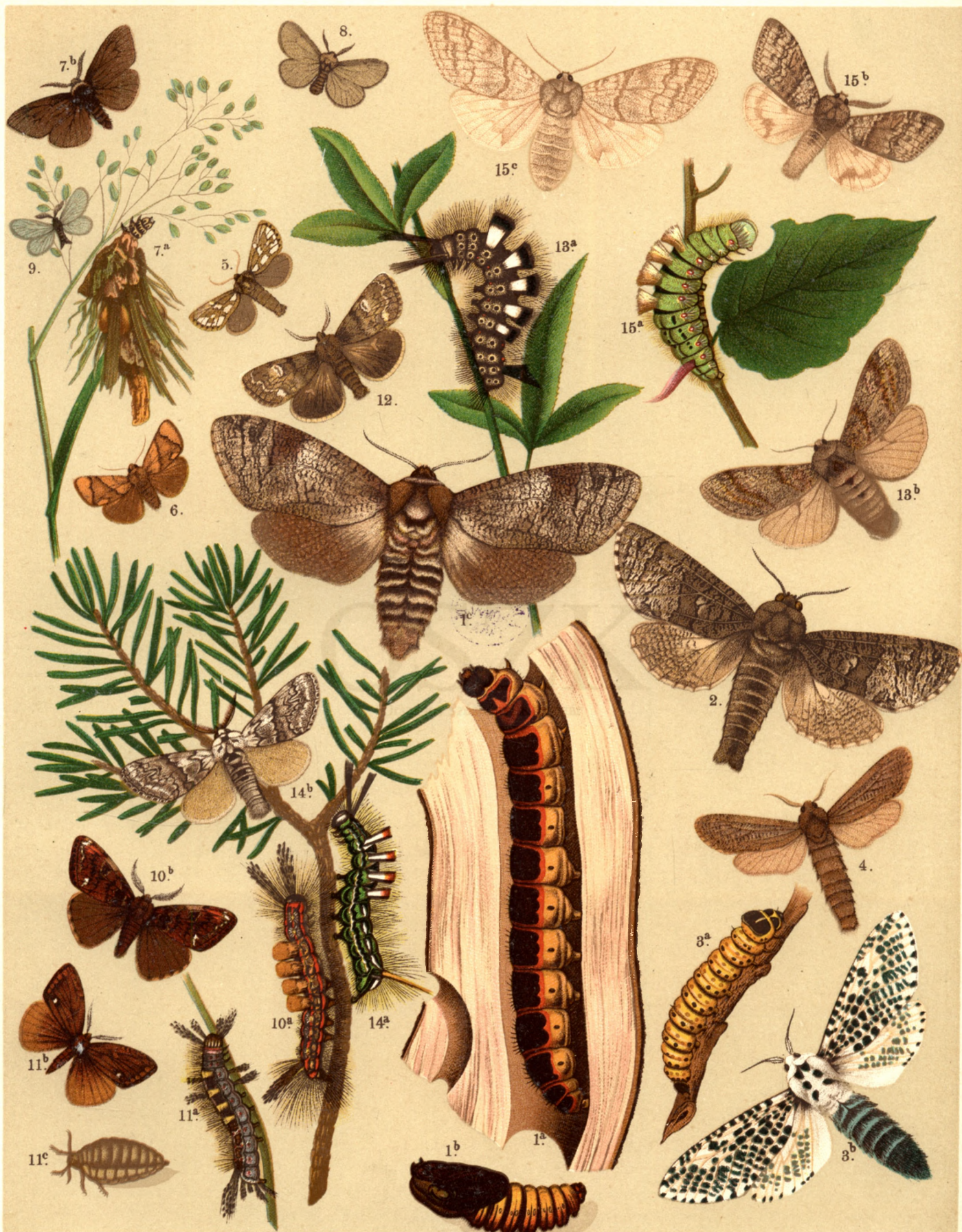
1 a. b. c. Cossus Cossus . — 2. Cossus Terebra . — 3 a. b. Zeuzera Pyrina . — 4. Phragmatoecia Castaneae . 5. Dyspessa Ulula . — 6. Heterogenea Limacodes . — 7 a. b. Psyche Unicolor . — 8. Ps. Viciella . — 9. Ps. Muscелиa . 10 a. b. Orgyia Gonostigma . — 11 a. b. ♂, c. ♀ Orgyia Antiqua . — 12. Dasychira Selenitica . — 13 a. b. Das. Fascelina . 14 a. b. Das. Abietis . — 15 a. b. ♂, c. ♀ Das. Pudibunda .