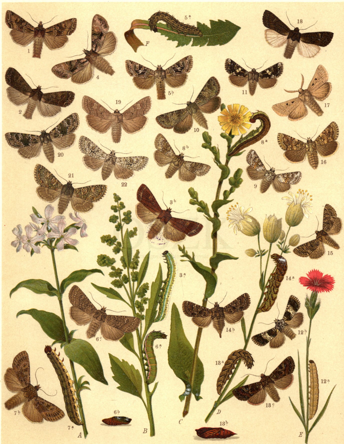
1. Mamestra Thalassina . — 2. M. Dissimilis . — 3 a. b. M. Oleracea . — 4. M. Genistae . — 5 a. b. M. Dentina . 6 a. b. M. Trifolii . — 7 a. b. M. Reticulata . — 8 a. b. M. Chrysozona . — 9. M. Serena . — 10. Dianthoecia Caesia . 11. D. Nana . — 12 a. b. D. Compta . — 13 a. b. c. D. Capsicola . — 14 a. b. D. Cucubali . — 15. D. Carphaga . 16. D. Irregularis . — 17. Episema Glaucina . — 18. Aporophyla Nigra . — 19. Ammonoica Caecimacula . 20. Polia Polymita . — 21. P. Flavincta . — 22. P. Chi .