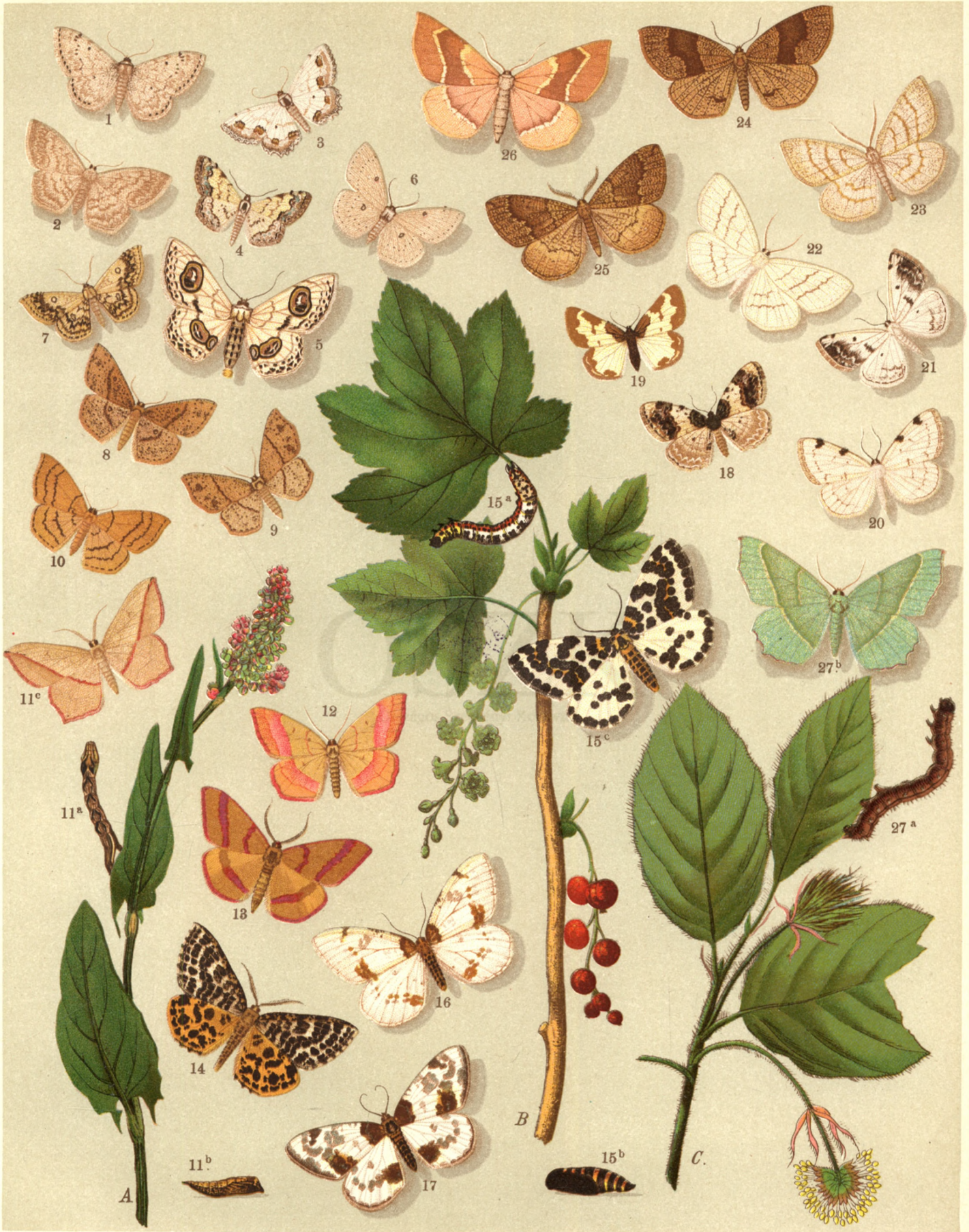
1. Acidalia Marginepunctata . — 2. Acid. Strigilaria . — 3. Acid. Ornata . — 4. Acid. Decorata . — 5. Problepsis Ocellata . — 6. Ephyra Pendularia . — 7. Eph. Annulata . — 8. Eph. Porata . — 9. Eph. Punctaria . — 10. Eph. Linearia . — 11 a. b. Timandra Amata . — 12. Rhodostrophia Vibicaria . — 13. Rhod. Calabrararia . — 14. Archanna Melanaria . — 15 a. b. c. Abraxas Grossulariata . — 16. Abr. Pantaria . — 17. Abr. Sylvata . — 18. Abr. Adustata . — 19. Abr. Marginata . — 20. Bapta Bimaculata . — 21. B. Temerata . — 22. Deilinia Pusaria . — 23. Deil. Exanthemata . — 24. Numeria Pulveraria . — 25. Num. Capreolaria . — 26. Ellopia Prosaparia . — 27 a. b. c. Metrocampa Margaritaria .