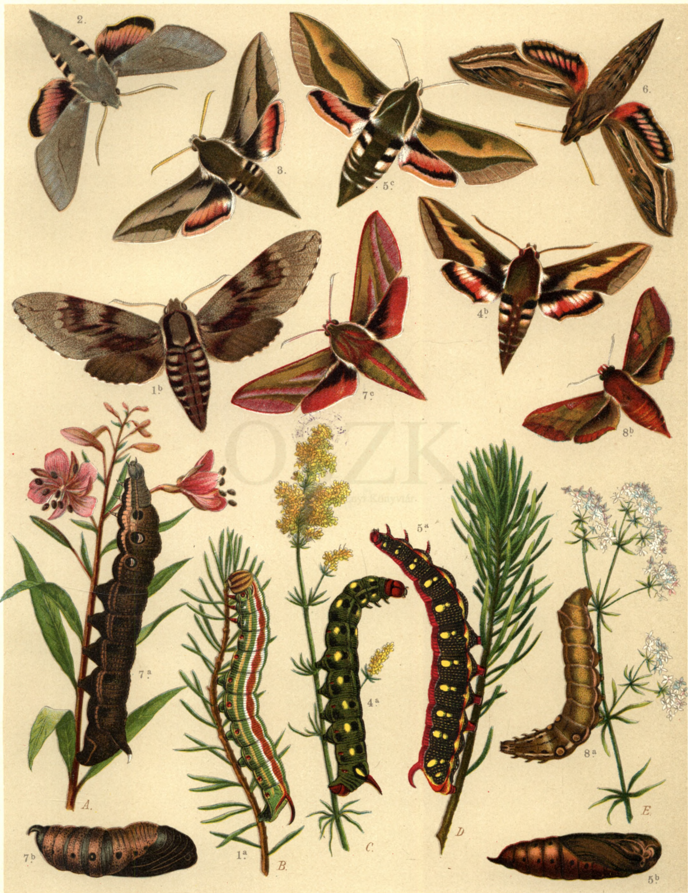
1 a. b. Sphinx Pinastri . 2. Deilephila Vespertilio . 3. Deil. Hippophaës . 4 a. b. Deil. Galii . 5 a. b. c. Deil. Euphorbiae . 6. Deil. Celerio . 7 a. b. c. Deil. Elpenor . 8 a. b. Deil. Porcellus .