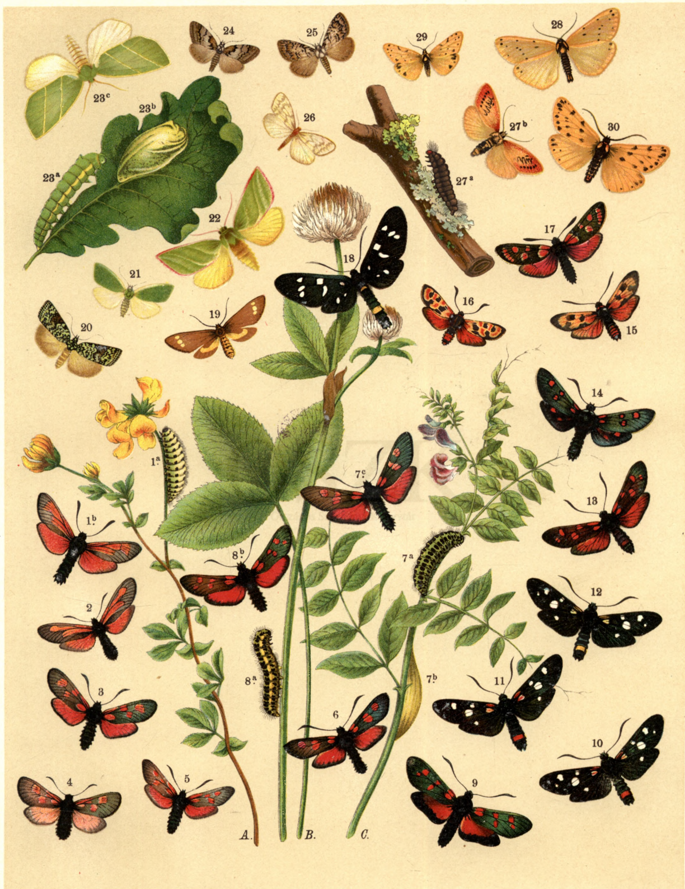
1 a. b. Zygaena purpuralis . 2. Z. Scabiosae . 3. Z. Achilleae . 4. Z. Exulans . 5. Z. Meliloti . 6. Z. Trifolii . 7 a. b. c. Z. Lonicerae . 8 a. b. Z. Filipendulae . 9. Z. Transalpina . 10. Z. Ephialtes . 11. Z. Ephialtes , var. Medusa . 12. Z. Ephialtes , var. Coronillae . 13. Z. Ephialtes , var. Peucedani . 14. Z. Lavandulae . 15. Z. Laeta . 16. Z. Fausta . 17. Z. Carniolica . 18. Syntomis Phegea . 19. Dysauxes Ancilla . 20. Sarothripus Révayana . 21. Earias Chlorana . 22. Hylophila Prasinana . 23 a. b. c. Hyl. Bicolorana . 24. Nola cucullatella . 25. Nola Strigula . 26. Nudaria Mundana . 27 a. b. Miltochrista Miniata . 28. Endrosa Irrorella . 29. Endr. Roscida . 30. Endr. Kuhlweini .