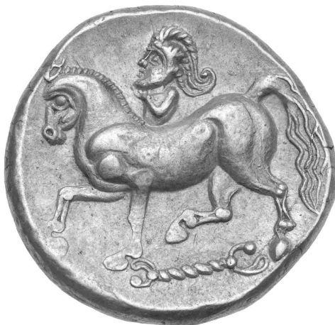
1. ábra: Kelta tetradrachma ( https://mnm.hu/hu/cikk/kelta-tetradrachma ). [2021.01.24.]

mediáció. A testiséggel — pénzzel — a transzcendens közvetítést képezték le az archaikus világban megragadható valósággá — valójában mind a mai napig ezt tesszük áttételes módon (lásd később a dollár szimbólumait). A pénz értéke maga a mediáció, mert közvetíti — megjelenítése által is — a törzsi nép eredetmítoszáit, önazonosságát és annak értékét. (Profán példával élve, egy vállalat értékét hasonlóan egy márka szimbólumba foglalja bele, jelezve, hogy a vállalat több, sőt más, mint a megragadható birtokainak összessége. Ma úgy mondjuk, hogy eszmei értéke van. A modern pénz is megközelíthető úgy, mint egy márka, aminek eszmei értéke van.)