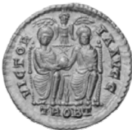
2. ábra: Valentin szolidusz https://en.wikipedia.org/wiki/Valentinianic_dynasty [2021.01.24.]

Ez a pénz a transzcendens közvetítést már egy társadalmi formációhoz köti. Az uralkodó ház — mint intézmény — részesül abban a kegyben, hogy közvetíti a teremtőt. A teremtő már nem a teremtő létbe foglalt embernek nyújtja oltalmát, hanem egy megszentelt (lásd a képen) intézménynek. A pénz közvetítő szerepét ezen túl már egy hatalom intézményén keresztül tölti be. Megváltozott tehát a közvetítés módja és tartalma is. Az ember ebben a szimbólumban közvetve csak, mint a dinasztia embere kap isteni oltalmat.