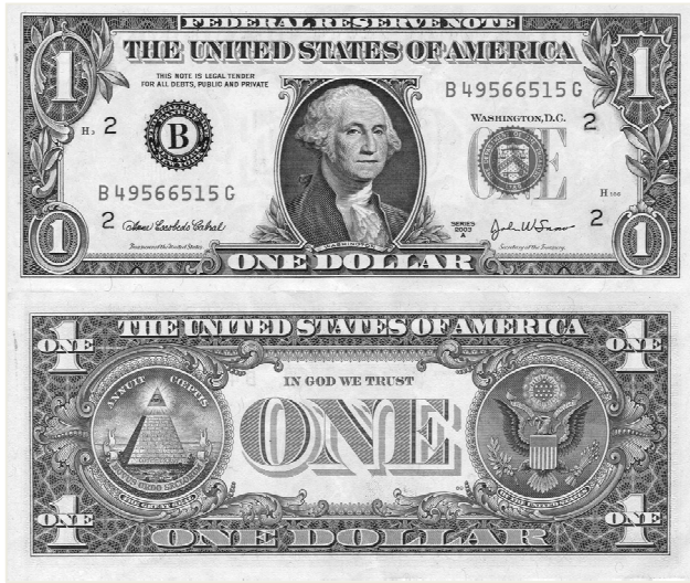
3. ábra: A dollár szakralitása ábra. Az egy dolláros bankjegy szakrális szimbólumai https://hu.wikipedia.org/wiki/Amerikai_doll%C3%A1r 10

A dollár szakrális szimbólumai kiemelten láthatók az 1 dolláros érme hátoldalán 11 .