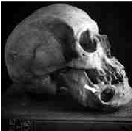
3. A mandibula corticalisát évszázadokkal ezelőtt elpusztító folyamat az állcsontban, ritka túlélés bizonyítéka (Meggyógyult koponya kezelés nélkül)

A páciens alacsony compliance nagyban késleltette a szakellátás elérését. A panasz hátterében ezután diagnosztizáltuk a fogászati okot, majd a fog extractioja, excochleatio, valamint a fisztuláját kiirtása vezetett eredményre. A helyes diagnózis után a szájsebészeti kezelésre betegünk rövid idő alatt meggyógyult.