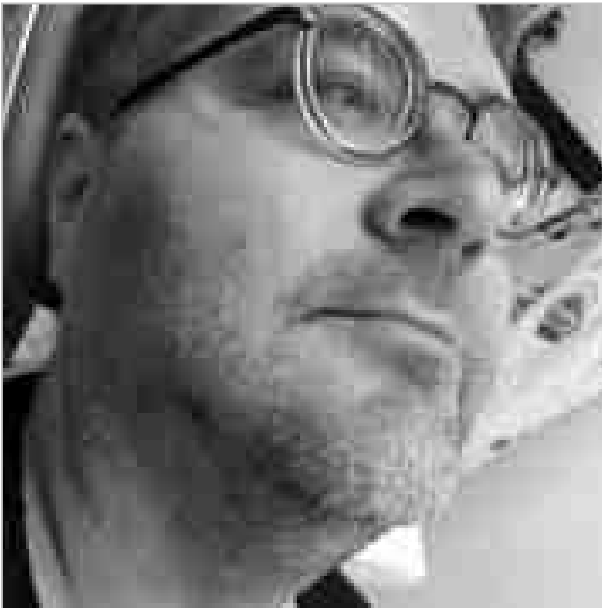
1.ábra: Példaként bemutatott esetünk elszemvedője az állcsúcs jobb oldalán az áttört folyamattal tünetmentes is lehet!(betegről fotó)

Jelenlegi járványhelyzet, a szolgálati jogviszony hatása a száj.-fej-nyaksebészeti sürgősségi esetek okán, fog megtartása „mindenáron” ?, a fogorvosi vizit halasztása mind befolyásolta a korábbi fogászati ellátási paradigmát.[4].