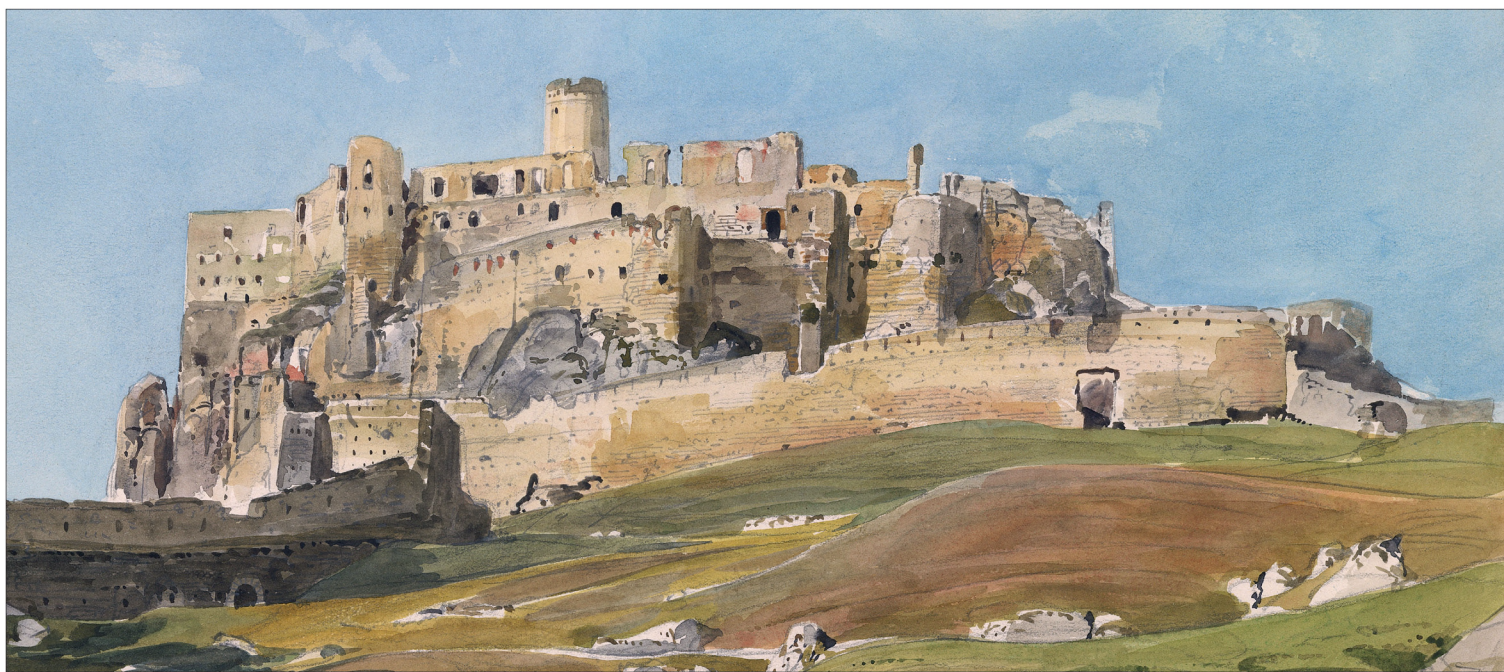
Szepesvár első udvara