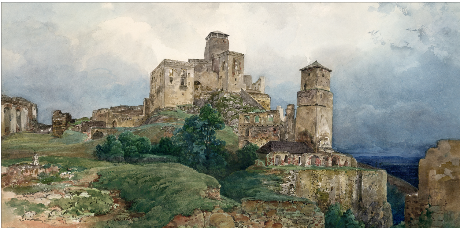
Trencsén vára a várudvarról

Trencsén fontosságát bizonyítja, hogy 1622-ben tizenhárom hétig kincseskamrájában őrizték a Szent Koronát, amelyet a nikolsburgi békekötés értelmében Bethlen Gábor visszaadott II. Ferdinándnak. A Rákóczi-szabadságharc idején a császári seregek egyik legerősebb támaszpontja volt, 1708-ban a bécsi udvart támogató város mellett zajlott a trencsényi ütközet, amelyben a nagyságos fejedelem hadai olyan súlyos vereséget szenvedtek, amit soha többé nem tudtak kiheverni. A várat 1790-ben elpusztító tűzvészben a város is leégett, csak a 19. század közepén indult újra fejlődésnek.