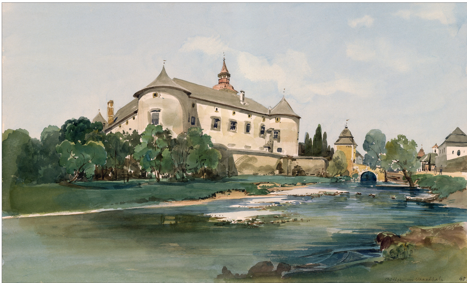
A nagybiccsei várkastély Ceruza, akvarell, papír, 296 x 467 mm; MTA KIK, Kézirattár, Ms 4409/53

NAGYBICCSE mezőváros Trencsén vármegyében, a Vág jobb partján. A díszes kastélyt a régi vár helyére Thurzó Ferenc királyi főudvarmester építtette. A Thurzók idején Nagybiccse a protestantizmus jelentős központja volt, evangélikus gimnázium is működött itt.