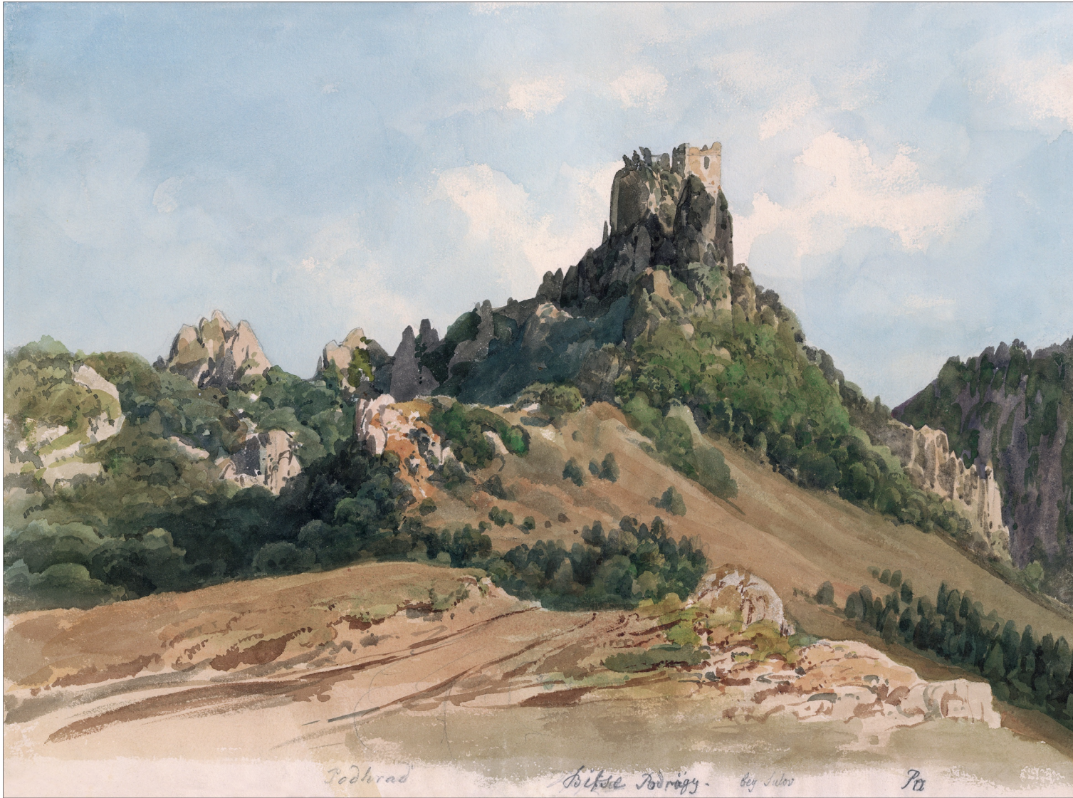
Hricsó romjai Ceruza, akvarell, papír, 272 x 376 mm; MTA KIK, Kézirattár, Ms 4409/57

HRICSÓ vára a Mohács előtti időkben királyi vár volt. A kuruc háborúk idején rombolták le. A várhoz monda is fűződik, a kegyetlen és szőszegő Thurzó Ferencre átkot szóró hricsói kőbarát mondája.