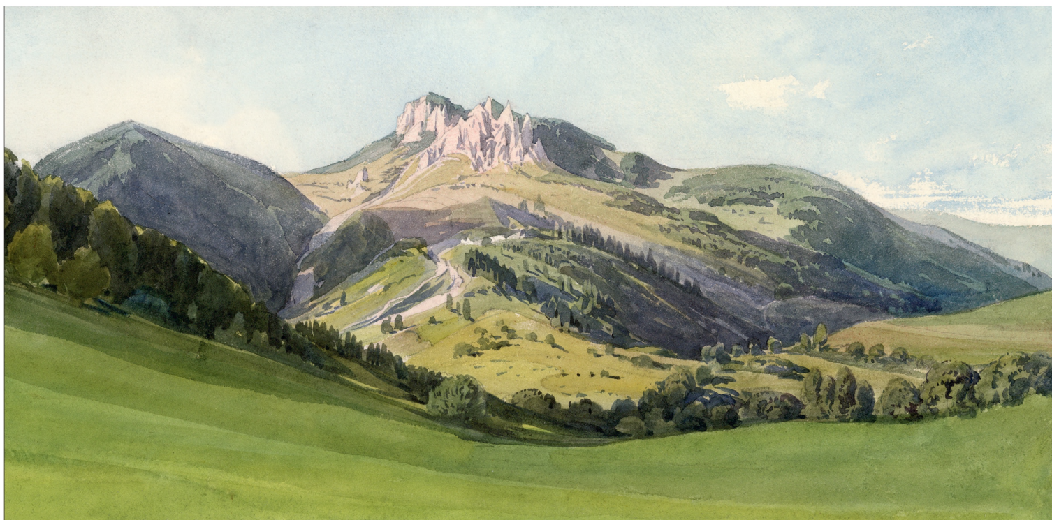
Táj a Vöröskő szikláival