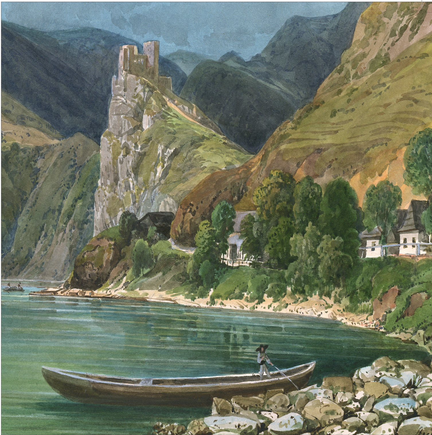
Sztrečno vára a Vág bal partjáról (részlet) Ceruza, akvarell, papír, 302 x 465 mm; MTA KIK, Kézirattár, Ms 4409/70