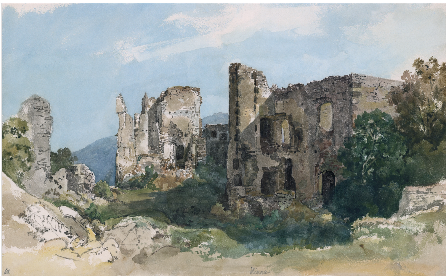
A vinnai vár belső udvara