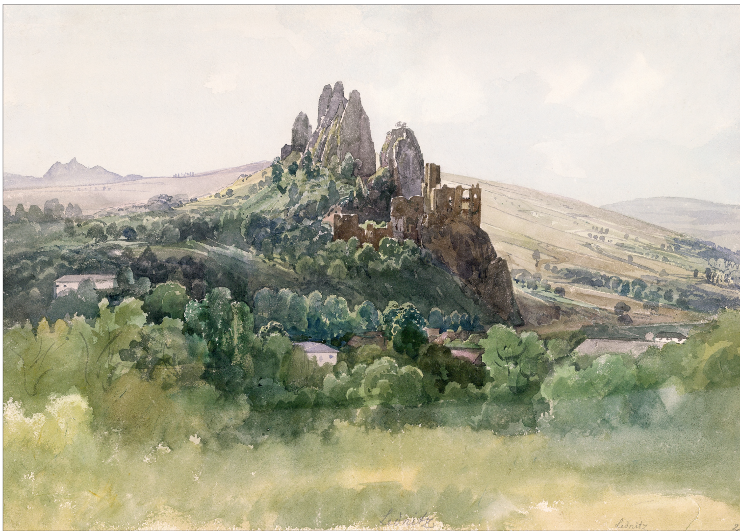
Lednic várának romjai a falu felett

Hajdan Oroszlánkő mellett LEDNIC volt a hágók kulcsa Morvaország felé. A vár az építészet különleges példája: meredek sziklán épült belső részébe több méter hosszú, 5-6 méteres magasságban sziklába vájt alagúton át lehet bejutni, ahonnan 80 kőlépcső vezet a főbástyához.