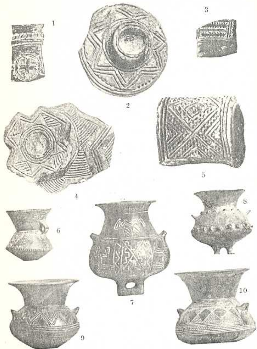
1—5. ZÓKI KULTÚRA. 6—10. BRONZKOR I-II. SZAKASZ.