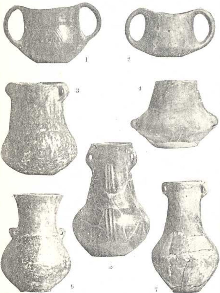
1—7. RÉZKORI KERÁMIA.