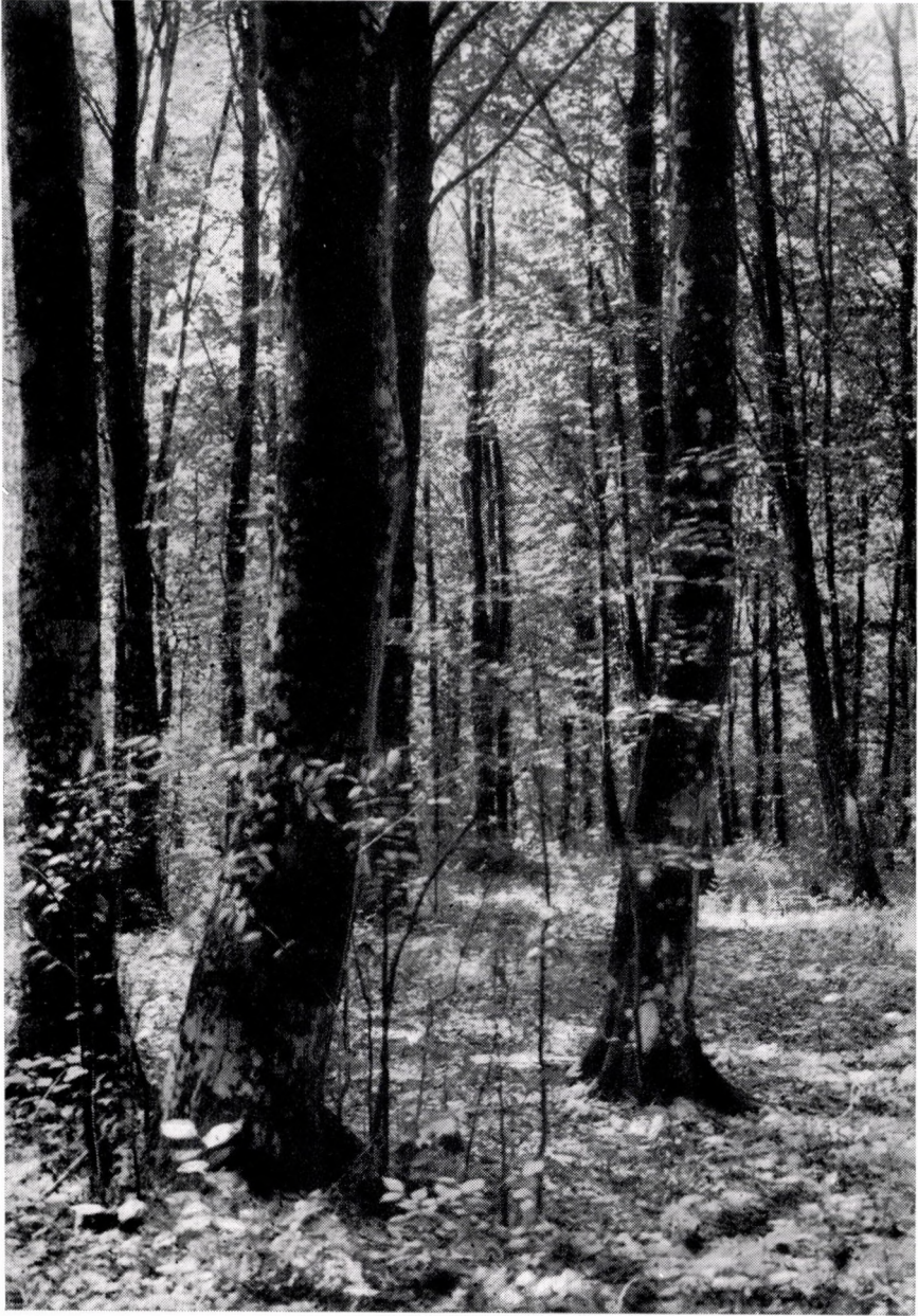
Aconito-Fagetum, dentariosum glandulosae. Ungarn, Nördliches Mittelgebirge; Sátor (Zempléner)-Geb. »Dargó«.