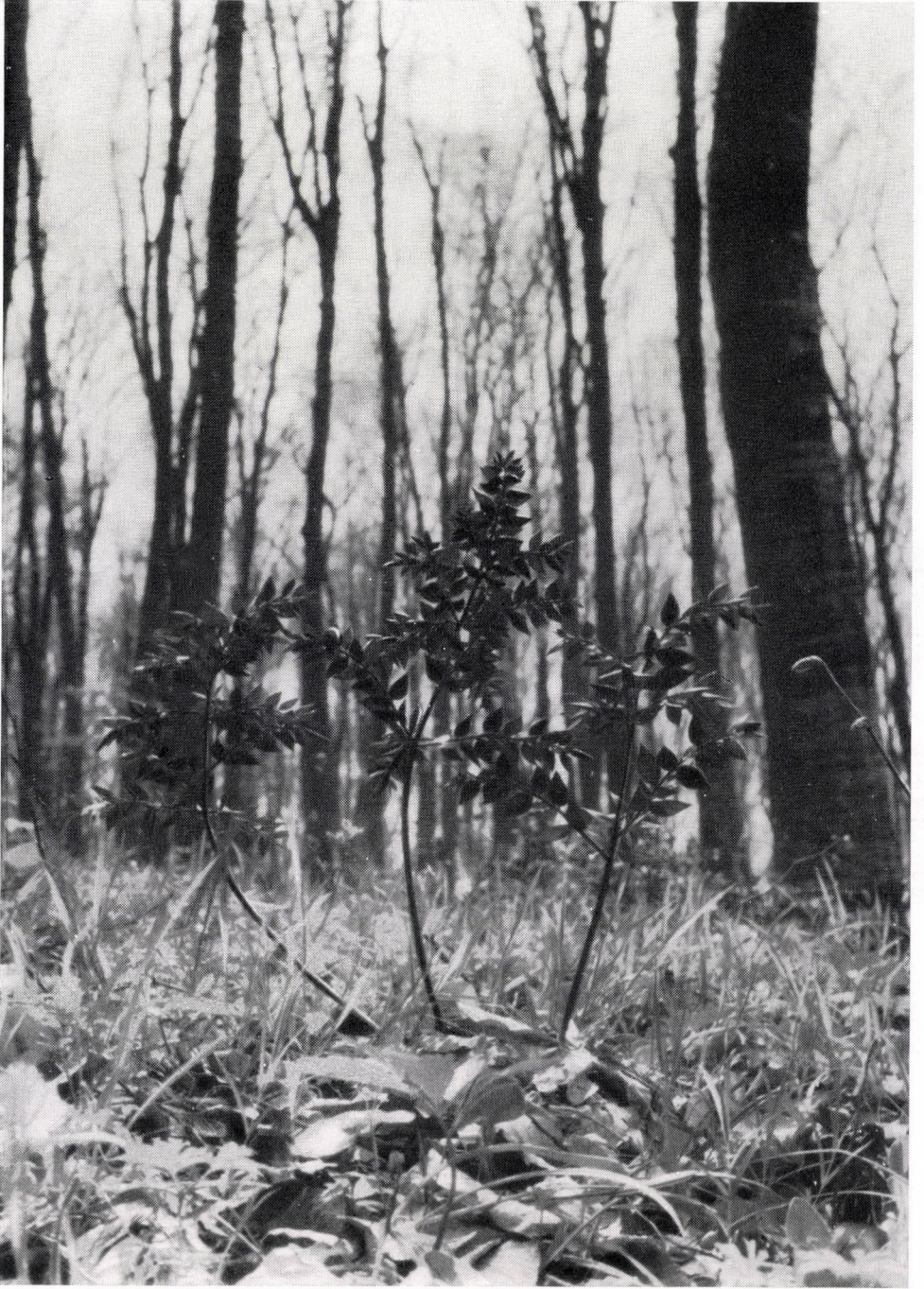
Vicio oroboidi -Fagetum somogyicum, caricetosum pilosae, mit Ruscus aculeatus . Ungarn: Süd-Transdanubien (Præillyricum): Zselic.