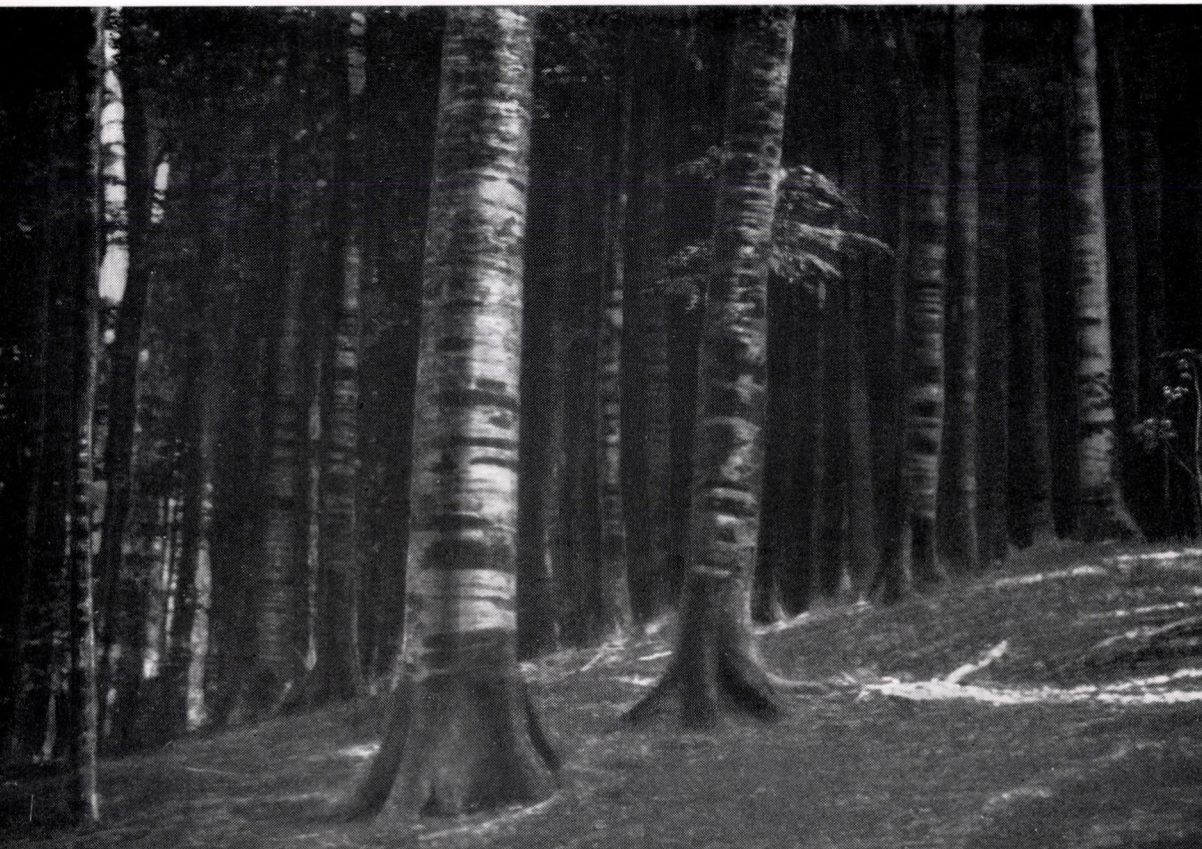
Symphyto-Fagetum oxalidetosum. Südkar- paten, Parîng-Geb.