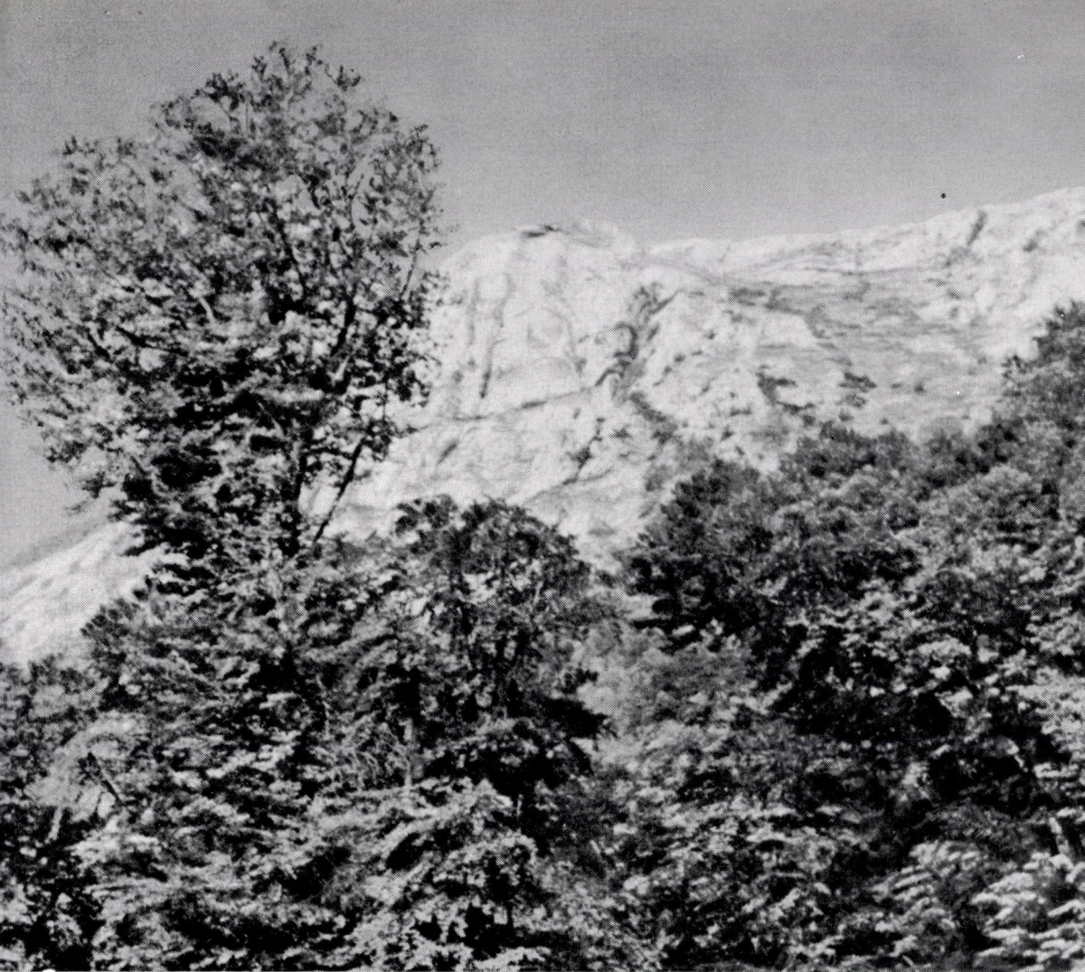
Aceri steveni-Fagetum tauricae. Krim. Obere Grenze des hochmontanen Buchenwaldes im Jaila-Geb.