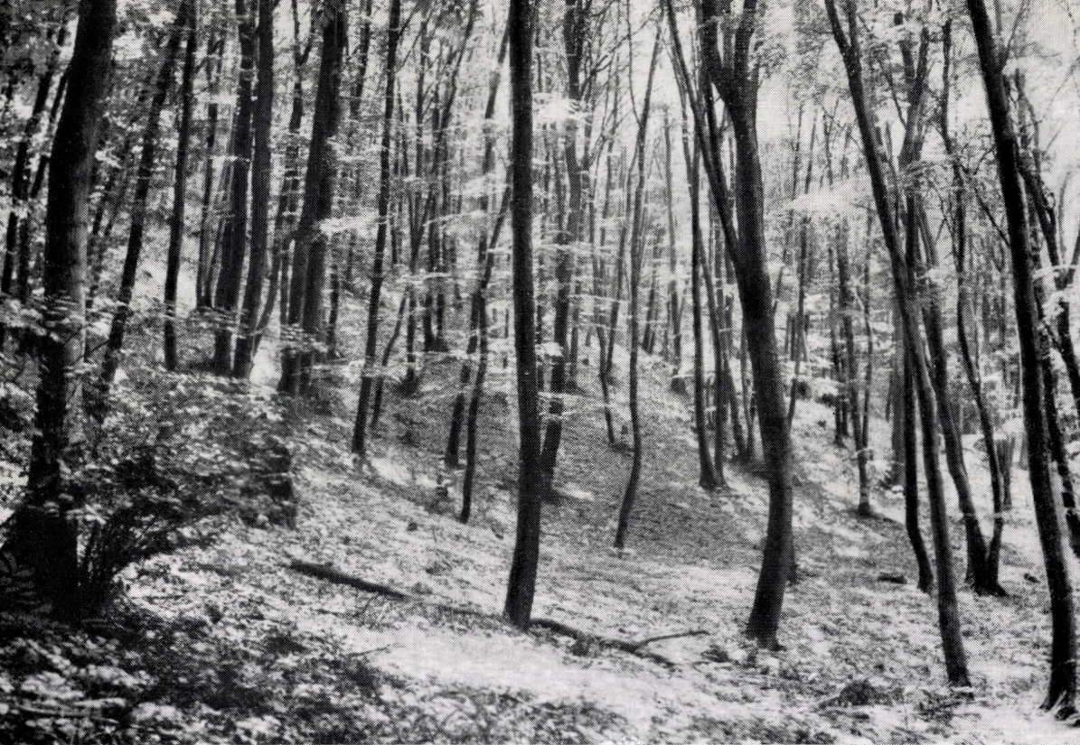
Melitti-Fagetum hungaricum, mercurialidosum. Ungarn, Westliches Mittelgebirge : Naszál.