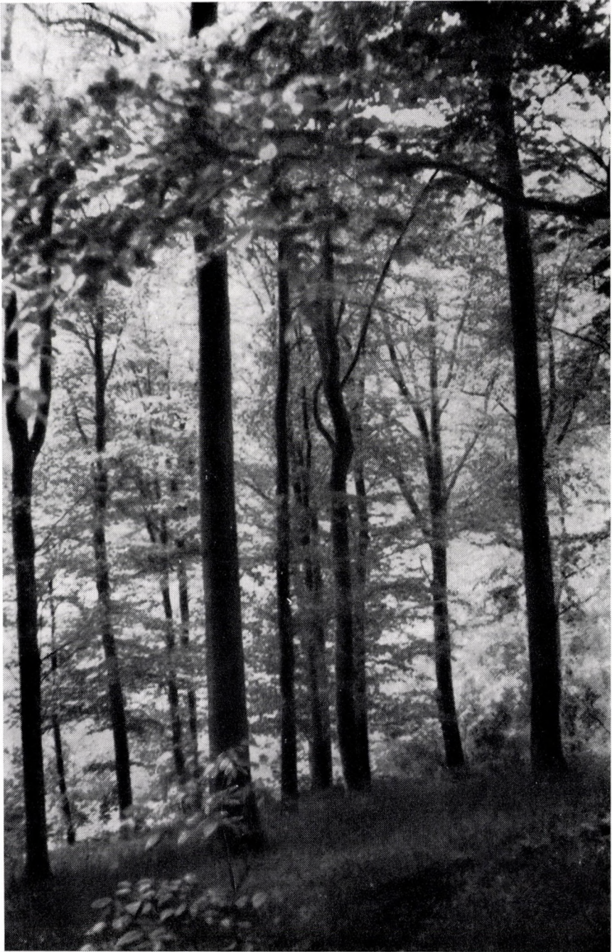
Deschampsia flexuosae-Fagetum, subcarpaticum luzuletosum. Ungarn, Nördliches Mittelgebirge : Mátra-Geb. »Piszkéstető«.