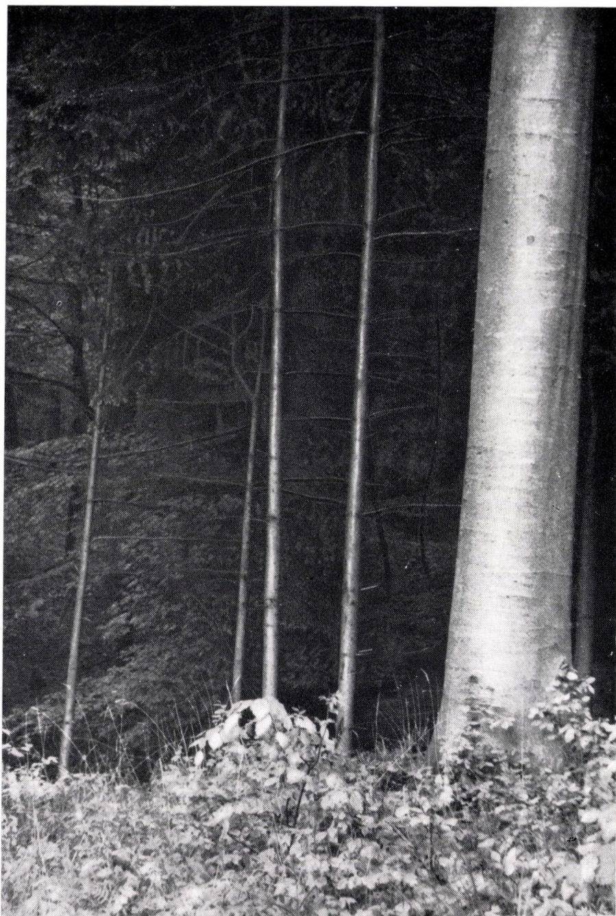
Abieti-Fagetum noricum . Ungarisches Alpenvorland, Berge von Sopron »Hidegvízvölgy«.