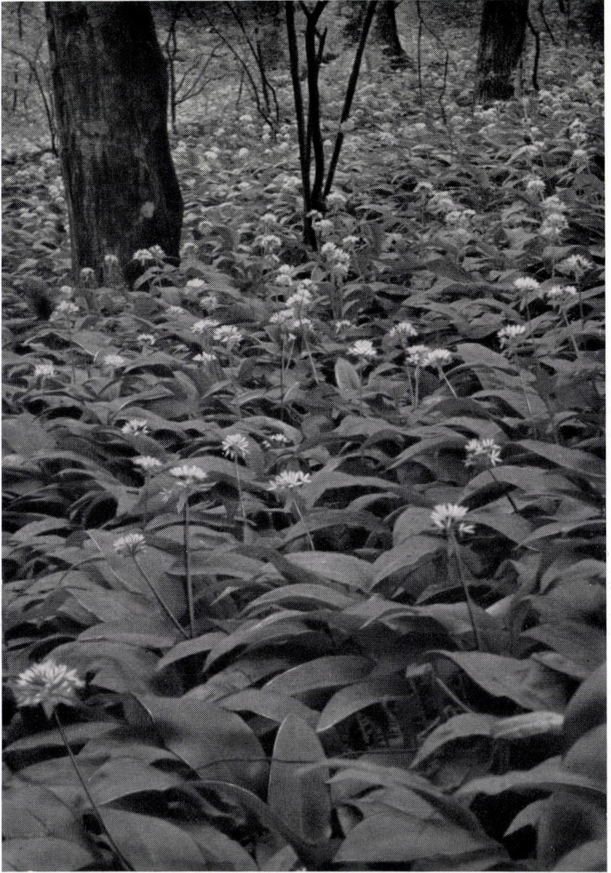
Melitti-Fagetum hungaricum, allietosum ursini. Ungarn, Westliches Mittelgebirge: Bakony-Geb.