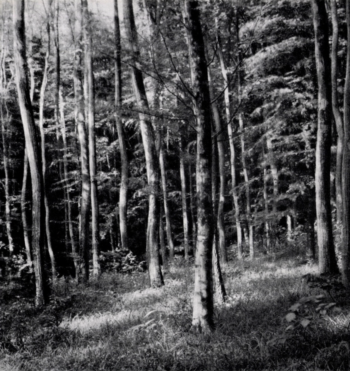
Vicio oroboidi-Fagetum somogyicum , mit Quercus petraea , Q. cerris , Tilia argentea , subass. caricetosum pilosae . Ungarn : Süd-Transdanubien (Pracillyricum) : Zselic.