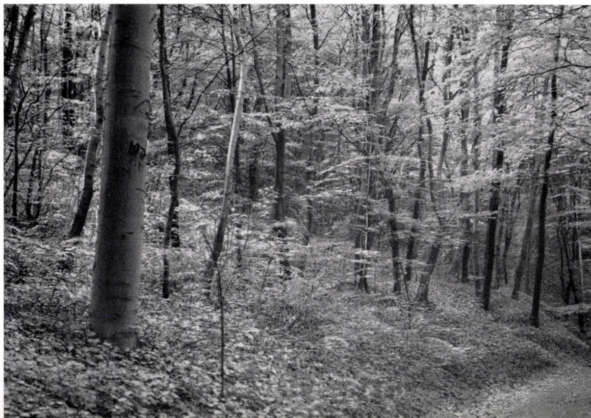
Quercus petraeae-Carpinetum pannonicum, hederosum. Ebenda.