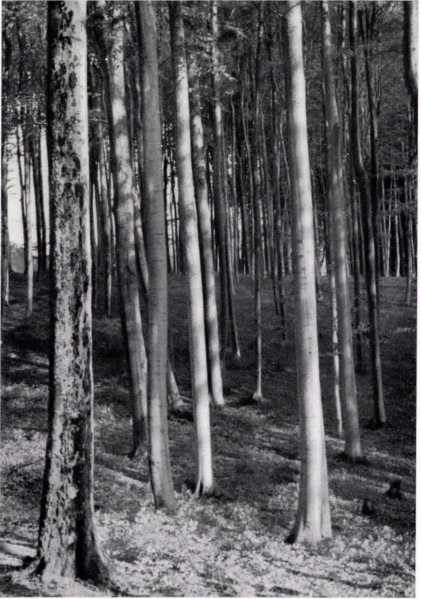
Deschampsia flexuosae-Fagetum, subcarpaticum myrtilletosum, Ungarn, Nördliches Mittelgebirge: Bükk-Geb. bei Csurgó.