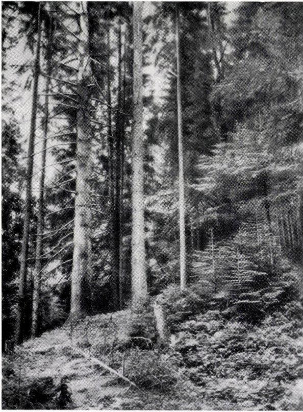
Chrysanthemo rotundifolio-Piceo-Fagetum. Ostkarpaten, Rodnaer Alpen »Valea Vinului«.