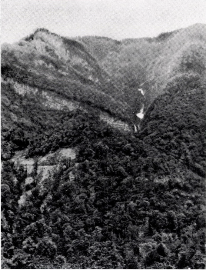
Abieti nordmannianae-Fagetum. Caucasus, im Tale Bzib, um 900 m.