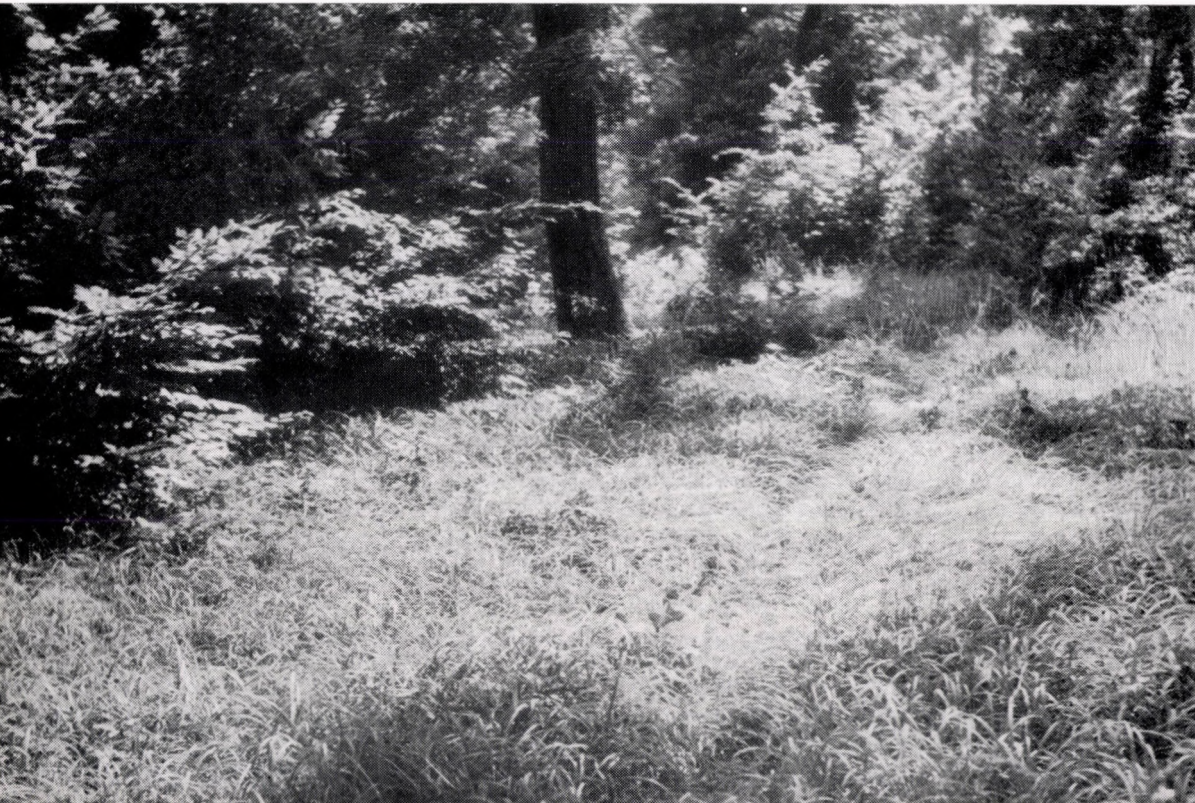
Quercus petraeae-Carpinetum pannonicum, caricetosum pilosae. Ungarn. Westliches Mittelgebirge : Naszál.