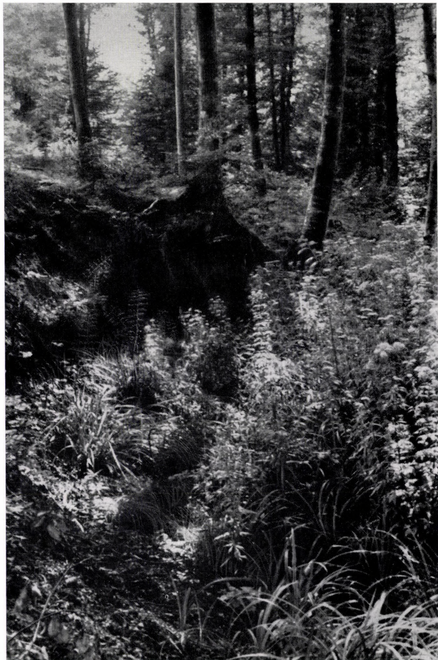
Vicio oroboidi-Fagetum somogyicum altherbosum. Ungarn : Süd-Transdanubien (Pracillyricum) : Zselic.