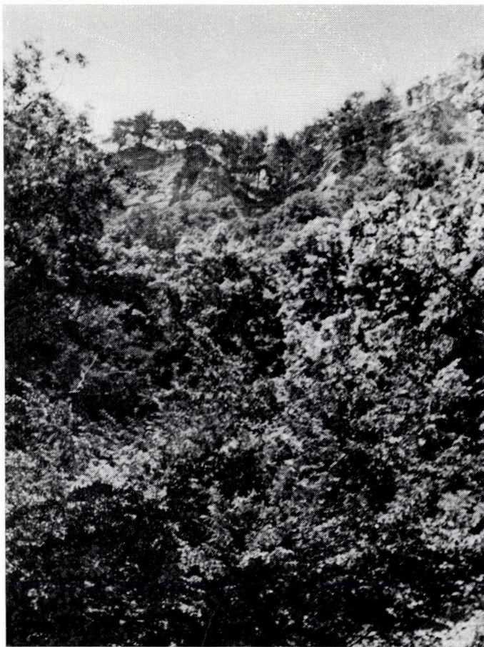
Lauroceraso-Fagetum orientalis. Kolchis, Reservation Agurka unweit von Sotschi.