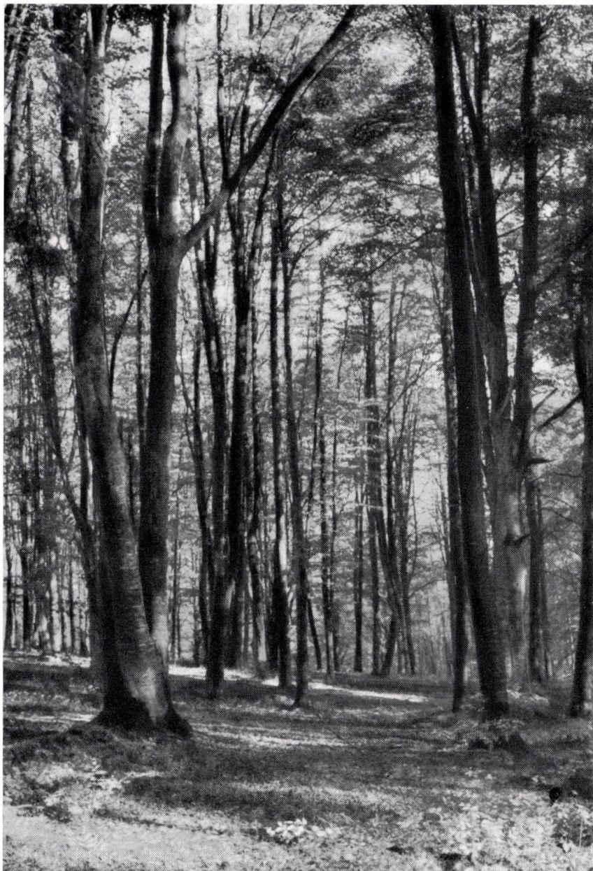
Aconito-Fagetum, Ungarn, Nördliches Mittelgebirge ; Bükk-Geb. bei Bánkut. Photo Simon