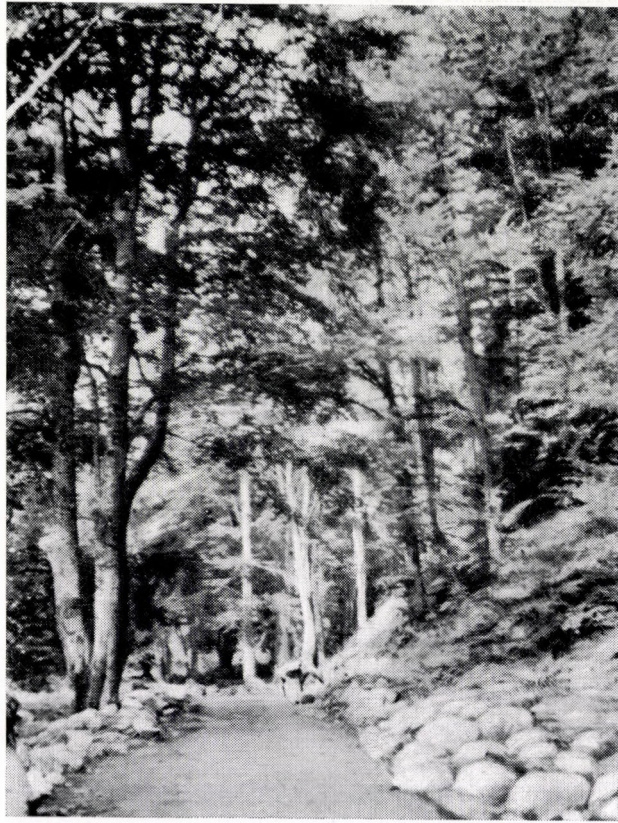
Abieti-Fagetum in Bulgarien. Pirin-Geb. um 1000 m.