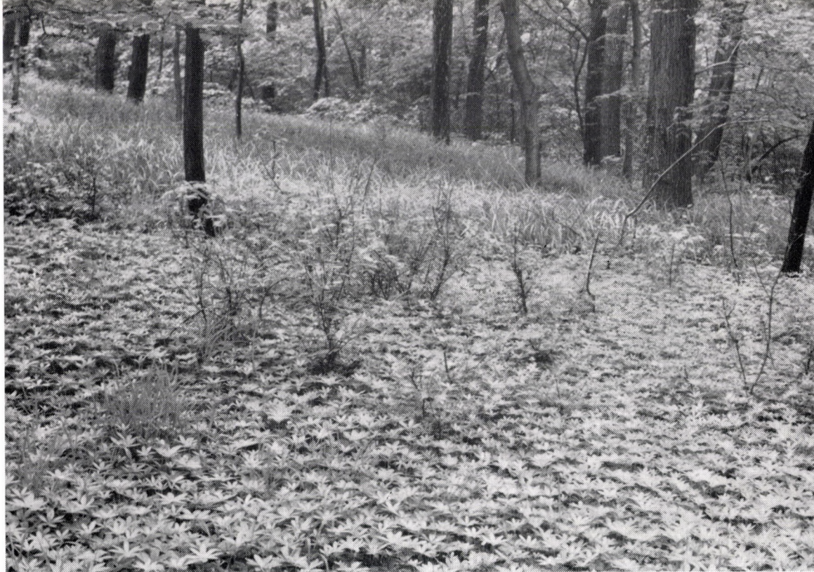
Quercus petraeae-Carpinetum pannonicum, asperuletosum. Ungarn, Budaer Geb. »Kálváriahegy«, mit Tilia coriata uná Fagus .