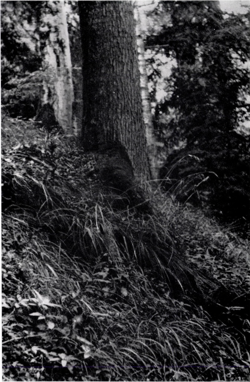
Pulmonario-Abieti-Fagetum austro-carpaticum, festucosum drymeiae. Südkarpaten : Bucegi, über Sinaia.