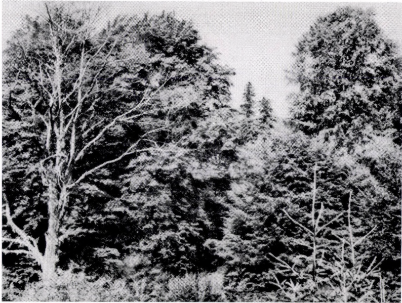
Piceo-Fagetum in Bulgarien. Pirin-Geb., um 1650 m.