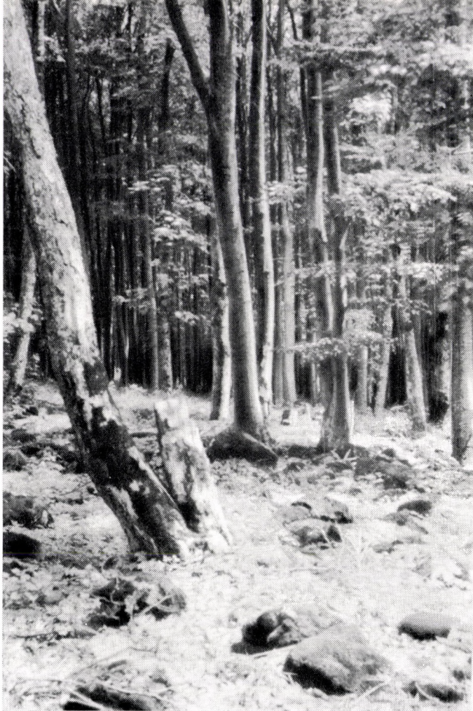
Immergrüne Vegetation in den Buchen- ( Helleboro odoro-Fagetum mecsekense ) und Eichen-Hainbuchenwäldern ( Asperulo taurinae-Carpinetum ) des Mecsek-Geb. in Ungarn. Frühlingsbild, im Hintergrund noch Schnee, mit Ruscus aculeatus , Hedera helix , Helleborus odorus