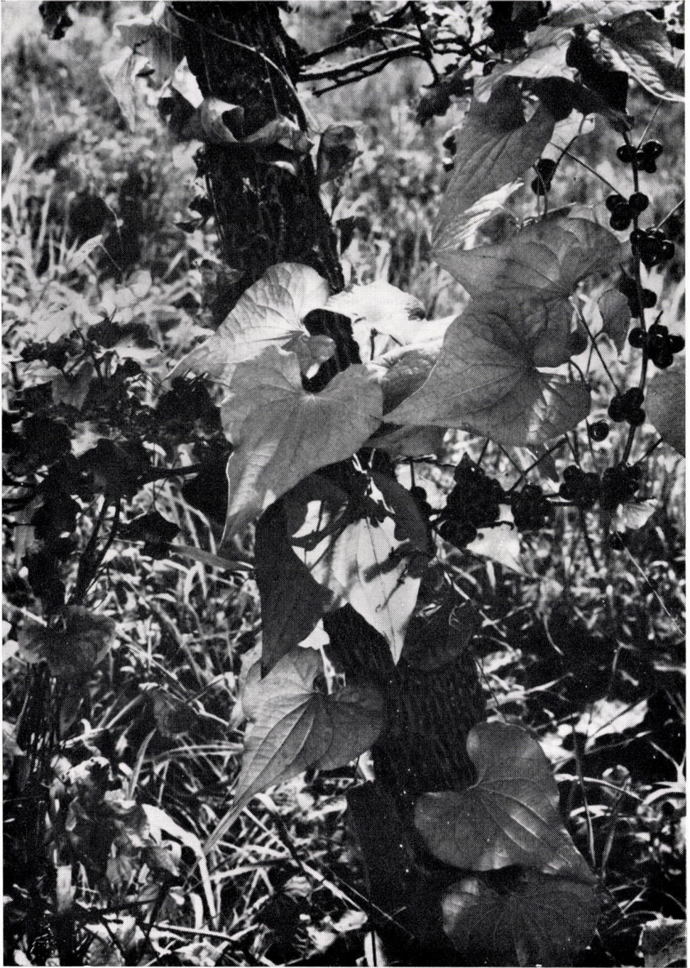
Asperulo taurinae-Carpinetum mecskense : Tamus communis , Mecsek-Geb.