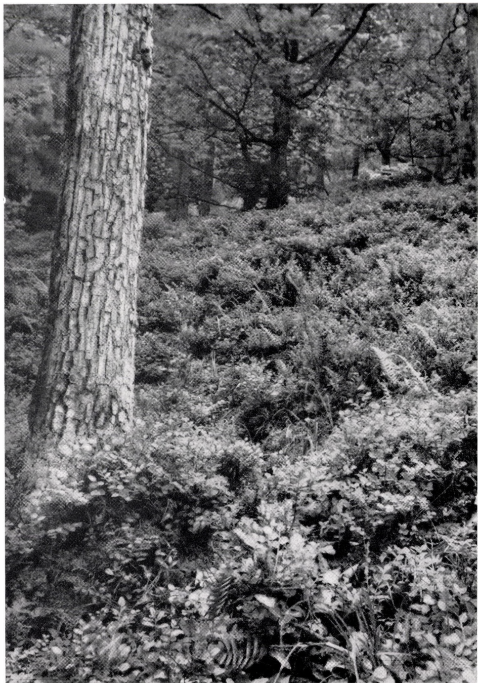
Genisto tinctoriae-Quercetum subcarpathicum myrtilletosum . Ungarn, Nördliches Mittelgebirge : Sátor (Zempléner)-Geb. »Lackóhegy«.