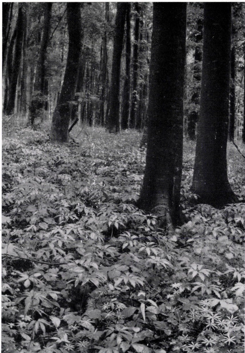
Melitti-Fagetum subcarpathicum asperuletosum . Ungarn, Nördliches Mittelgebirge : Sátor-Geb. »Dargó«.