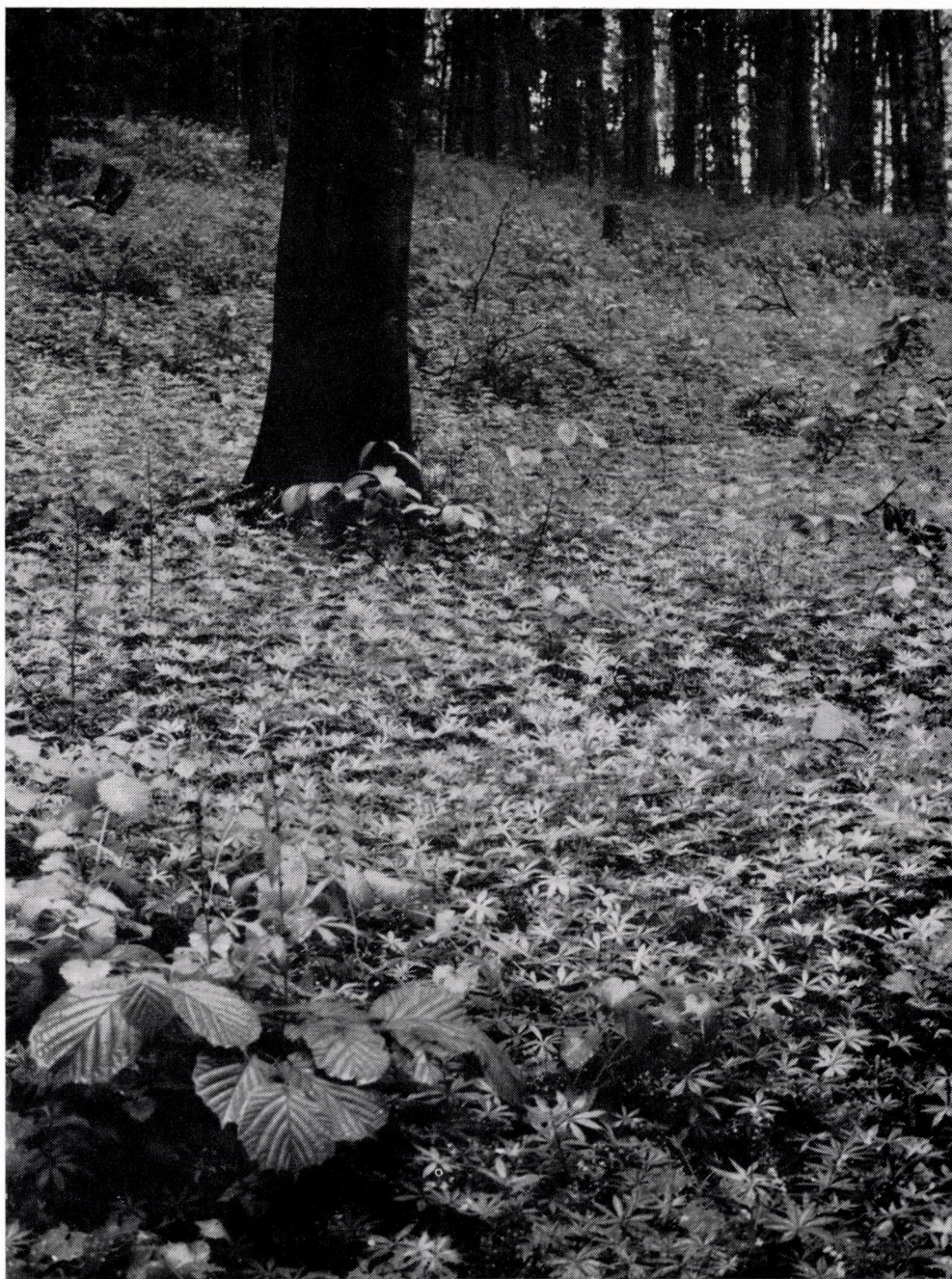
Quercus robor-Carpinetum hungaricum. Ungarn, Nördliches Tiefland, Wald »Bockerek« bei Csaroda.