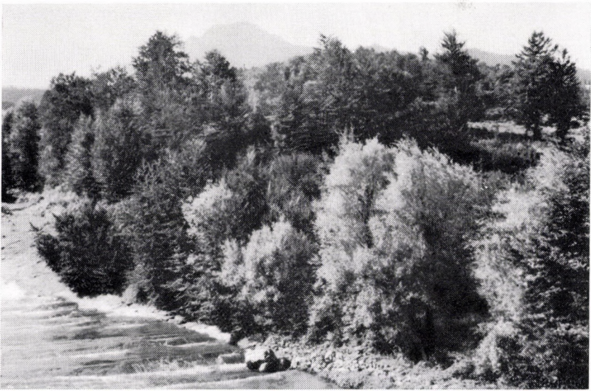
Carpinö-Fagetum bulgaricum . Bulgarien, Mittleres Balkengebirge (Stara Planina), im Vordergrund Weiden um 700 m.