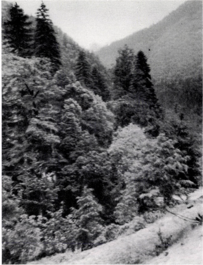
Rhododendro flavo-Fagetum orientalis. Caucasus, im Tale Bzib (im Vordergrund).