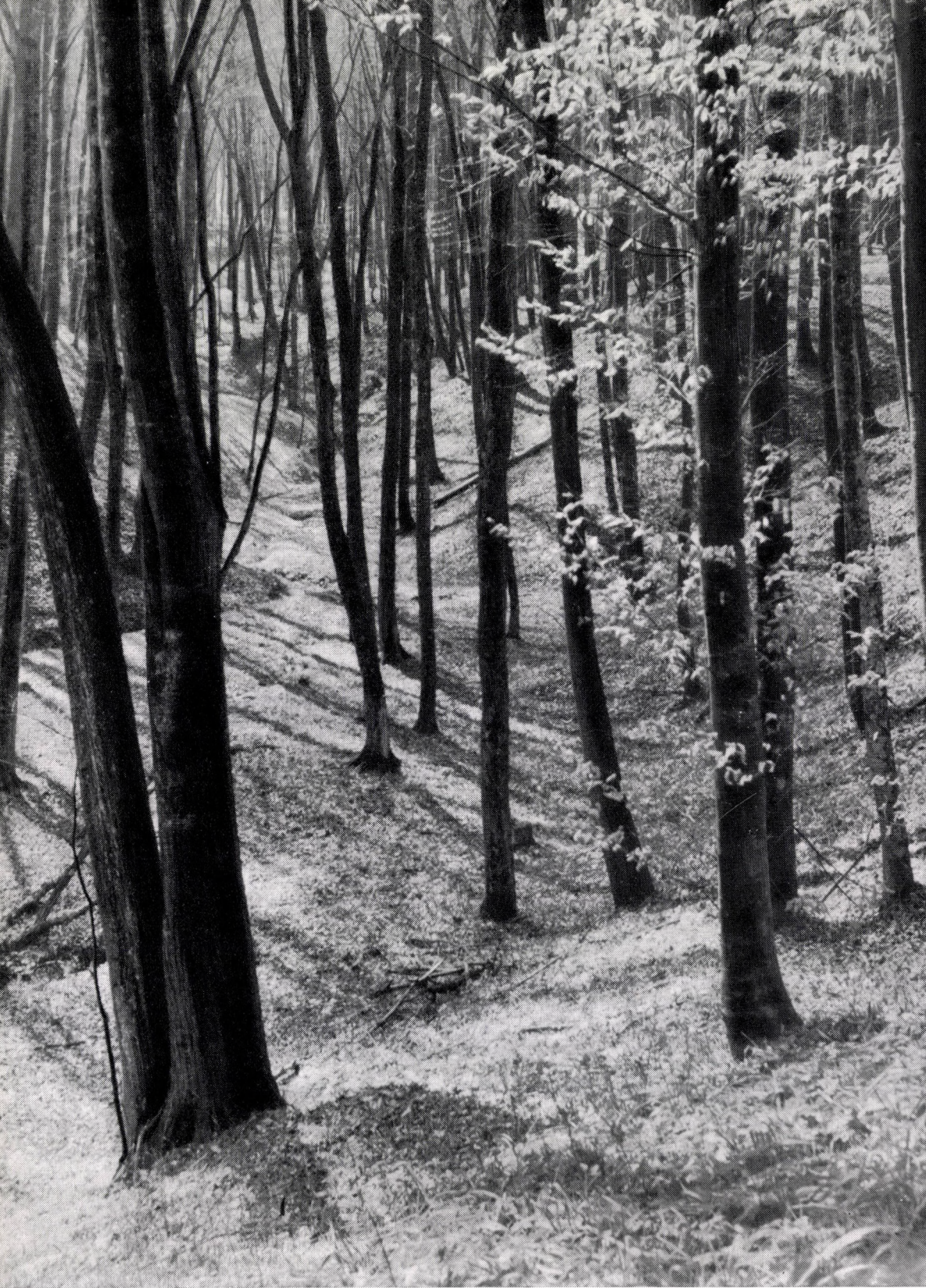
Vicio oroboidi-Fagetum somogyicum (Frühlingsbild), mit Tilia argentea und Carpinus betulus . Ungarn Süd-Transdanubien (Præillyricum) : Zselic.