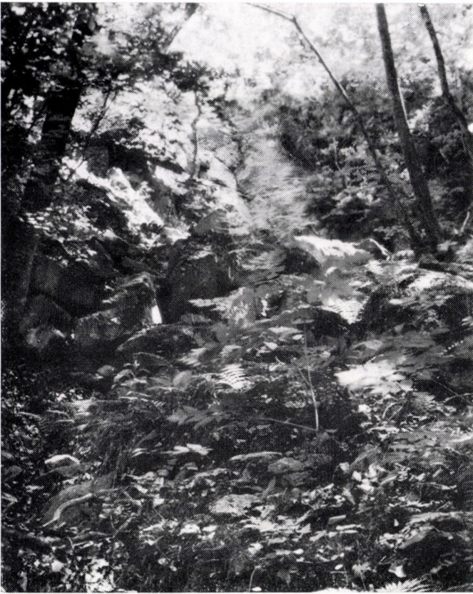
Melitti-Fagetum subcarpaticum altherbosum . Ungarn, Nördliches Mittelgebirge : Sátor-Geb. »Kishuta«, mit Farnen und Aruncus .