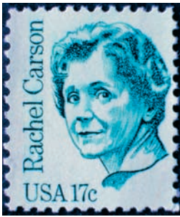
Rachel Carson (1907–1964) képe bélyegen