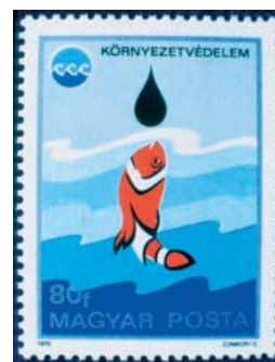
A vízszennyezés veszélyeire figyelmeztető magyar bélyeg

olyan légköri gáz, amely át-ereszti (csak kis mértékben nyeli el) a rövidebb hullám-hosszú napsugárzást, de jelentős mértékben elnyeli a földfelszín hosszuhullámú kisugárzását, és ezáltal hozzájárul a felszín, illetve a felszín közeli levegőréteg felmelegedéséhez. E tulajdonsággal rendelkezik többek között a vízgőz, a széndioxid, a metán és számos más légköri nyomgáz. Az ilyen tulajdonságú és jelentősebb tartózkodási idejű gázok légköri mennyiségének felhalmozódása megnöveli a földi légkör üvegházhatását, és globális éghajlatváltozást idézhet elő.