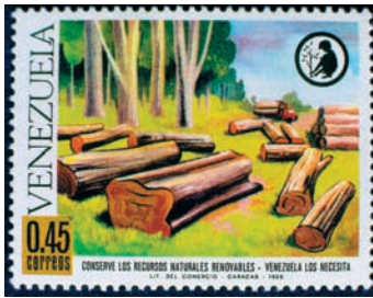
Trópusi erdők tarvágása venezuelai bélyegen