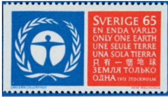
A Stockholmi Konferencia egyik bélyegképe