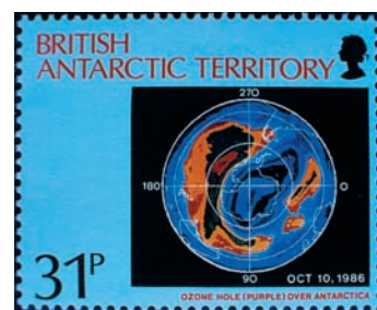
A megsérült ózonpajzsról készült úrfelvétel angol bélyegen

A népesség 2,5 milliárd főről 5,8-ra emelkedett, sőt ma már tudjuk, hogy jóval meghaladta a hatmilliárdot. A nyolcmillió lakosnál is népesebb városok, vagyis a megavárosok száma kettőről huszonötre emelkedett. Érdekes adat, hogy az átlagosan megtermelt élelmiszer-mennyiség lépést tartott, sőt felülmúlta a népesség növekedését. A számok a termelést mutatják,