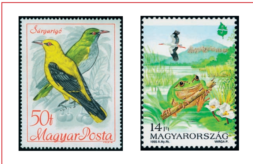
Akik a nyári esték hangulatát adják: a sárgarigó és a kecskebéka

Mindenesetre én bizakodó vagyok. Bízom abban, hogy a politikusok, a gazdasági vezetők és a civil társadalom egyaránt belátja, hogy alapvető változásokra van szükség a termelésben, a fogyasztásban, az életvitelben és az értékrendekben. Ha lassan is, de ez a folyamat végbe fog menni, és akkor, óvatosan bár, de optimisták lehetünk. Az emberek többsége szereti a természetet, az élővilágot, és saját egészségének megőrzését is nagyon fontosnak tartja.