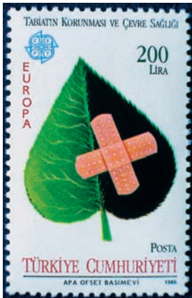
A savas eső káros hatását szimbolizáló török bélyeg