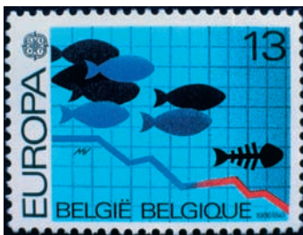
A vízminőség romlása a halak pusztulásához vezet