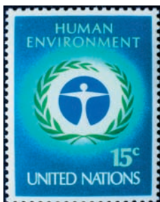
Az ENSZ által kiadott Emberi környezet c. bélyeg

bizonyos természetes rendszerek (növénytakarás, biocönózis) állapotának valamilyen kritérium szerinti leromlása. A folyamat lehet „spontán” vagy humán (agráripari) indítatású.