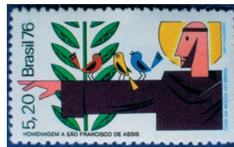
Assisi Szent Ferencet a római katolikus egyház 1979-ben az ökológia védőszentjévé nyilvánította

A Brundtland Bizottság ajánlásainak figyelembevételével az ENSZ Közgyűlés 1989-ben úgy döntött, hogy 1992-re konferenciát szerveznek Rio de Janeiróba, hivatalos nevén az ENSZ Környezet és Fejlődés Konferenciáját. Ekkorra már a környezetvédelem mellett a gazdasági szektor szerepe is