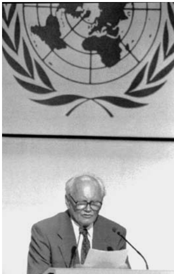
Göncz Árpád köztársasági elnök a Riói Konferencián, 1992

előtérbe került, természetesen abban az értelemben, hogy miként egyeztethető össze a gazdasági érdek a környezeti érdekekkel.