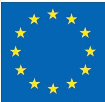
Az Európai Unió jelképe

nem az egyéni hozzáférést, amely már más kategória, s amelyet már a gazdasági és szociális lehetőségek határolnak be. Az éves vízfelhasználás óriási növekedést mutat; 1300 km 3 -ról 4200 km 3 -ig jutottunk el. Ez azt jelenti, hogy a vízkészletekkel pazarlóan gazdálkodunk. Az esőerdők jelenleg az 1950-ben mért felületnek csupán a 70 százalékát adják. A CO 2 -kibocsátás közel ötszörösére emelkedett. Az elefántok száma pedig a tizedére csökkent fél évszázad alatt.