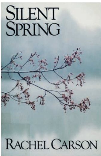
A Néma tavasz amerikai kiadásának címlapja

kártevőt és kórokozót irtó anyag. Többnyire szintetikusan előállított vagy természetes eredetű, a főbb károsító csoportokra (fitofág állatok, fitopatogén gombák, baktériumok, gyomnövények, vérszívó rovarok stb.) ható, valamely csoportra szelektív vagy totális hatású toxikus anyag.