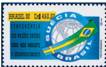
A Riói Konferencia egyik bélyegképe

A konferencia szerintem nem volt kudarc, de átütő sikert sem hozott. Tény, hogy a riói nagy vállalások jelentős része nem teljesült. Ezért újabb ígérek helyett a Johannesburgi Konferencia visszatért a riói elvekhez és