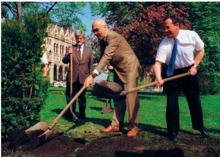
A Föld Napja alkalmából fákat ültetnek szerte az országban

22-én tartották meg az Egyesült Államokban az első Föld Napja rendezvényt. A média nagy segítséget nyújtott az esemény népszerűsítéséhez, ennek köszönhetően országszerte mintegy húszmillió ember vett részt a különböző rendezvényeken, felvonulásokon, és tiltakozott a környezet romlása ellen. A modern környezetvédelmi mozgalmak megjelenését ettől a dátumtól számítják. Később a kezdeményezés áttért a többi kontinensre, és ma már világszerte – így Magyarországon is – minden évben megtartják a Föld Napját április 22-én, amikor is áttekintik a globális és helyi problémákat.